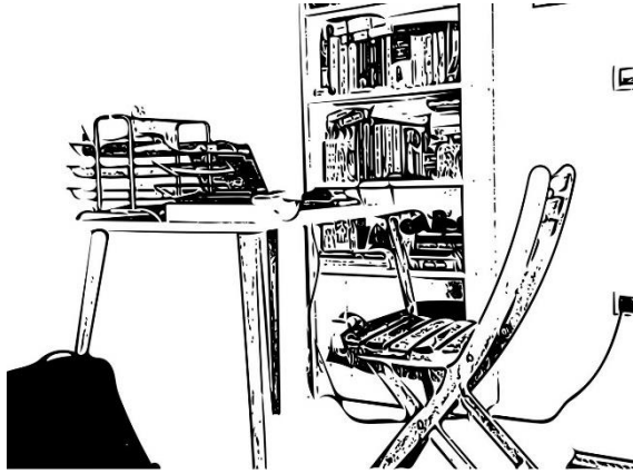
Şekil 6. Katılımcı 6'nın çalışma alanı (Kaynak: Katılımcının paylaştığı fotoğraf esas alınarak yazarlar tarafından oluşturulmuştur).

Eşi ve köpeği ile yaşayan 27 yaşındaki K6, evden çalışmaya başladıktan sonra kanepeler, kitaplık ve televizyonun bulunduğu ve normalde sık kullanmadıkları odayı çalışma odası olarak kullanmaya başlamıştır (Tablo 1, Şekil 6).