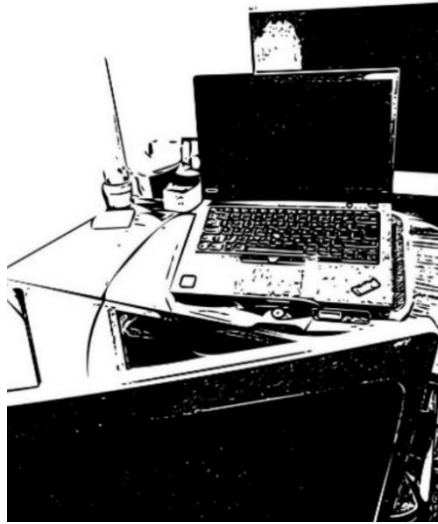
Şekil 7. Katılımcı 7'nin çalışma alanı (Kaynak: Katılımcının paylaştığı fotoğraf esas alınarak yazarlar tarafından oluşturulmuştur).