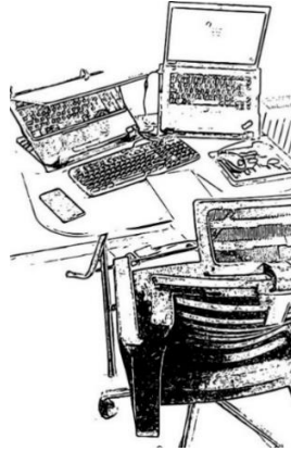
Şekil 5. Katılımcı 5'in çalışma alanı.

Eşi ile yaşayan operasyonel geliştirme uzmanı K5 (28), daha önce evde bir çalışma alanı bulunmadığını ifade etmiştir (Tablo 1). Evden çalışma zorunluluğu gerektiren bu süreçte depo olarak kullandıkları bir odayı çalışma alanına dönüştürmüştür (Şekil 5). Öncesinde bir süre salondaki masada çalıştığını, ancak rahat edemediğini belirten K5'in bu ifadesi, daha çok ofis ortamlarında dikkat çekilen çalışma alanının kişiselleştirilmesi ile kazanılacak bölgesel hakimiyet gerekliliğinin evdeki ortak alanda çalışılması durumunda da görülebileceğini ortaya koymaktadır.