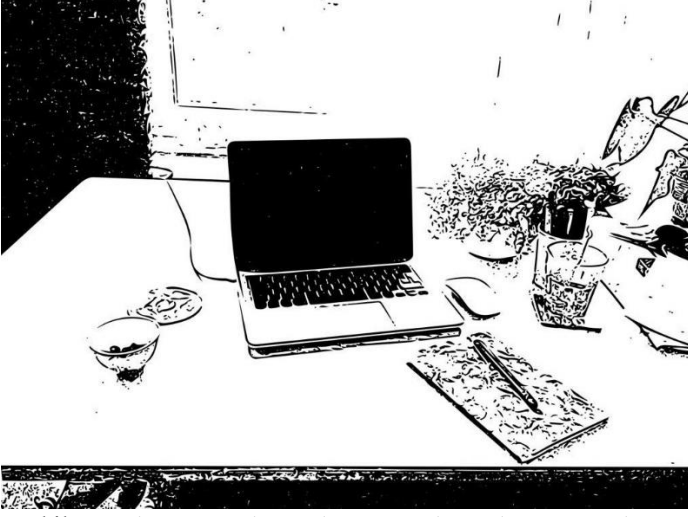
Şekil 8. Katılımcı 8'in çalışma alanı (Kaynak: Katılımcının paylaştığı fotoğraf esas alınarak yazarlar tarafından oluşturulmuştur).

“Çiçeklerimi düzenledim, tavandan sarkıttım. Bakınca kendimi mutlu hissediyorum, bu halini seviyorum. Evde bir yerde dağınıklık gördüğümde bu beni rahatsız ediyor, işim olsa bile onu düzenliyorum. Evi şimdiye kadar hiç olmadığı biçimde çok kullanıyorum ve evdeki işim artıyor. Evde alan açmak ve evi ferahlatmak için az eşya bulunmasını istiyorum. Evde molaların arasında çalışıyor gibiyim; köpeğimle ilgileniyorum, kendime çay-kahve hazırlıyorum, bir şeyler atıştırıyorum.” Evdeki çalışma ortamında ferahlık hissi ve düzen ihtiyacına dikkat çeken K8, ev işlerinin zaman zaman çalışmasını aksattığını ifade etmiştir.