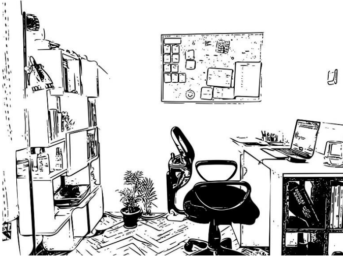
Şekil 2. Katılımcı 2'nin çalışma alanı (Kaynak: Katılımcının paylaştığı fotoğraf esas alınarak yazarlar tarafından oluşturulmuştur).

27 yaşında bir öğretmen olan ve ev arkadaşı ile yaşayan (Tablo 1) K2'nin halihazırda yüksek lisans yapıyor olması sebebiyle yatak odasında bir çalışma alanı bulunmaktadır (Şekil 2). Ancak evden çalışma düzenine geçilmesi ile bu alanda bazı uygunlaştırmalar yapmıştır.