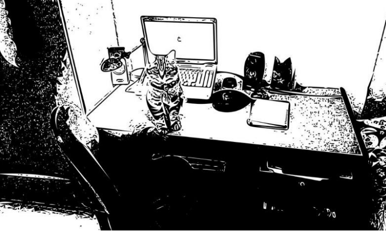
Şekil 1. Katılımcı 10'un çalışma alanı (Kaynak: Katılımcının paylaştığı fotoğraf esas alınarak yazarlar tarafından oluşturulmuştur).

Teknoloji ve bilişim sektöründe danışmanlık yapan 30 yaşındaki K10, ev arkadaşı ve kedisi ile yaşamaktadır (Tablo 1). “Daha iyi bir internet sağlayabilmek için modemi değiştirdim, odamda okuma alanı oluşturdum, kendime sallanan bir sandalye satın aldım. Mutfaktaki sandalye yerine iyi bir sandalye aldım, bazen orada çalışıyorum. Hep aynı noktada çalışmak benim için sıkıcı oluyor, evde monotonluk beni etkiliyor, işim gereği hareketliydim ve farklı konumlarda çalışıyordum. Bu nedenle evde oturarak çalışmak ve hareketsiz kalmak beni kötü etkiliyor. İnternet ya da elektrik ile ilgili sıkıntılar da olumsuz etkiliyor (Şekil 10).” K10, evde sabit bir çalışma alanı olsa da çevrim içi çalışma öncesi farklı firmalara giderek danışmanlık verdiği için bu mekânsal değişiklik alışkanlığını sürdürürebilmek için evde de zaman zaman mekân değişikliği yapmaktadır.