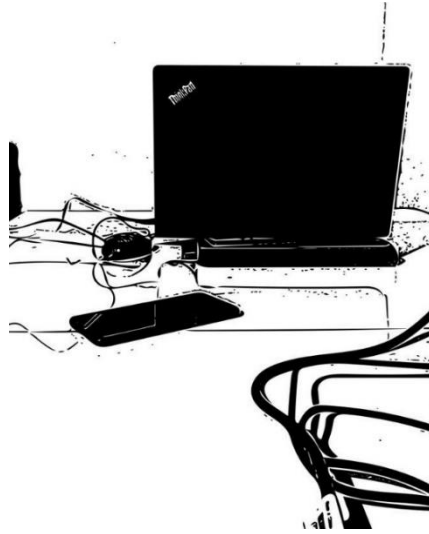
Şekil 9. Katılımcı 9'un çalışma alanı (Kaynak: Katılımcının paylaştığı fotoğraf esas alınarak yazarlar tarafından oluşturulmuştur).

çalışma alanı olarak tanımladım. Bazen katlanan laptop standı ile koltukta ya da yatakta çalışıyorum.” İnternet bağlantısı ve kameradan görünecek boş bir arka plan, K9 için evden çalışmanın gereklilikleri olarak görülmektedir ve çalışma alanını bu temellere göre şekillendirmiştir (Şekil 9).