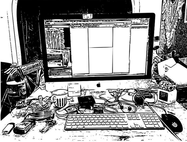
Şekil 1. Katılımcı 11'in çalışma alanı (Kaynak: Katılımcının paylaştığı fotoğrafı esas alınarak yazarlar tarafından oluşturulmuştur).

Reklam sektöründe sanat yönetmeni olan K11 (31), eşi ve kedisi ile yaşamaktadır (Tablo 1). “Yemek masasının bir tarafı çalışma alanım, modern dik-dörtgen bir ahşap masa. Açıkçası çalışma masasından daha konforlu. Yemek masasının yarısını işgal ettim, masanın yanına gitar ve amfimi de yerleştirdim, arada molalarda gitar çalıyorum. Bilgisayar başında çok fazla vakit geçirdiğimden eşimin yüzünü görmek için salona geçtim. Bazen kanepeye geçiyor, birbirimizle muhabbet edebiliyoruz yoksa ben mağaraya kapanır gibi içeride bir odada ömrümü tüketiyorum.” Uzun çalışma saatleri sebebiyle ayrı bir odada çalıştığına eşi ile görüşemediğini ifade eden K11, alan olarak yarısını kullandığı salondaki yemek masasının çalışmayla ilgili tüm ihtiyaçlarına yanıt verdiğini düşünmektedir (Şekil 11).