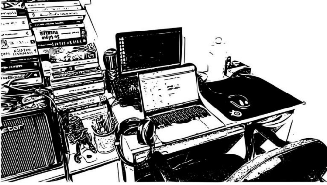
Şekil 1. Katılımcı 1'in çalışma alanı (Kaynak: Katılımcının paylaştığı fotoğraf esas alınarak yazarlar tarafından oluşturulmuştur).

K1 (28) reklam yazarıdır ve anne babası ile yaşamaktadır (Tablo 1). Çalışma alanı olarak yatak odasını kullandığını ifade etmiştir.