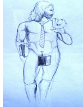
Resim 10. Öğrenci 7 (Picture 10. Student 7)

Yaratıcı ifade sanatsal sürecin kalbidir ve öğrencilerin kendi anlamlarını buldukları ve geliştirdikleri en temel noktadır. Bu süreçte öğrencilerin kişisel fikirlerini farklı bir biçimde yansıtabilmesi beklenmektedir. Alıntılarda da görüldüğü öğrenciler geçmiş ile kurdukları bağlantılar yoluyla bugünün toplumuna ilişkin fikirlerini görselleştirmişlerdir. Yaklaşım biçimleri sorgulayıcı niteliktedir.