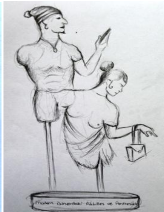
Resim 6. Öğrenci 30 (Pict. 6. Student 30)