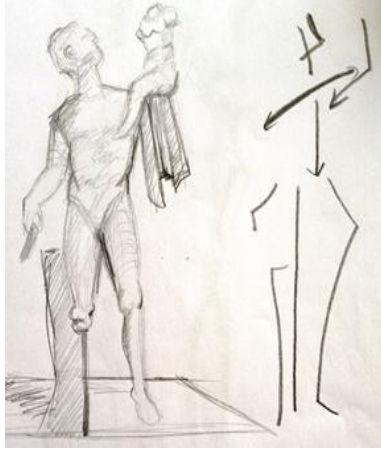
Resim 1. Öğrenci 2 (Picture 1. Student 2)

Dik bir duruş var. Yukarıya kalkmış bir elle duruş hareketlendirilmeye çalışılmış. Bir bacak vücudun tüm ağırlığını taşıyor ve ağırlık bir tarafa verildiği için vücutta hareketli görülüyor (Öğr. 2).