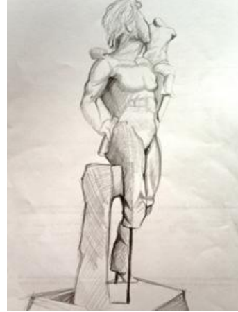
Resim 2. Öğrenci 2 (Picture 2. Student 2)

Alıntılarda ve Resim 1 ve 2'de öğrencilerin kompozisyon çözümlemeye ilişkin ifadeleri yer almaktadır. Kompozisyon çözümleme öğrencilerin sanatçıların fikirlerini anlatma biçimlerini görsel yollu anlamaları içindir. Eserlerdeki biçimsel kurulumun anlaşılması kendi ifade biçimlerinin oluşmasına destek sağlamış ve öğrencileri yeniden yorumlama üzerine araştırmalara yönlendirmiştir. Örneğin;