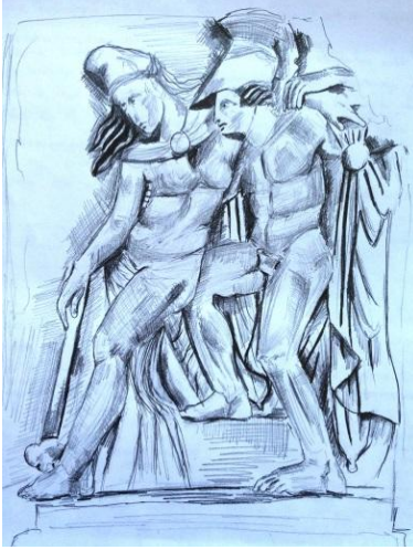
Resim 4. Öğrenci 5 (Picture 4. Student 5)

Resim 3 ve 4'te öğrencinin yeniden yorumlama üzerine yapmış olduğu çizgisel araştırmalar görülmektedir. Öğrenci farklı çizgi biçimleri ile yeni anlatımlara imkân tanıyacak araştırmalar peşindedir. Ürettiği alternatif bakış açıları yeni yaratıcı bir anlatıma zemin hazırlamak içindir.