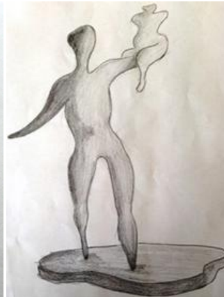
Resim 7. Öğrenci 19 (Pict. 7. Student 19)