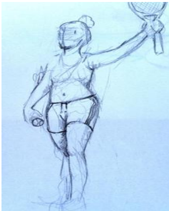
Resim 5. Öğrenci 6 (Pict. 5. Student 6)

Geçmişteki zafer anlayışının günümüzde değiştiğini düşünüyorum. Onun için çalışmamda Nike heykelinden hareketle sporda zafer kazanmak düşüncesine yoğunlaşmayı düşündüm (Öğr. 6). Günümüz sanatında eserlerin pek çoğunda ayrıntılar ya da mükemmel formlar işlenmiyor. Daha sade ve esnek anlatımlar var. Onun için bu eserin günümüzdeki yorumunda daha sade yalın bir anlatıma gitmenin gerektiğini düşünüyorum. Bazen esprili yaklaşımlar yapıyor sanatçılar. Bende yalın ve esprili bir anlatım olabilir mi diye düşündüm (Öğr 19).