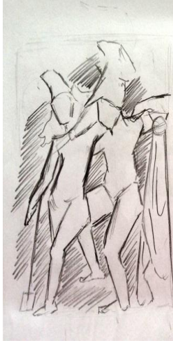
Resim 3. Öğrenci 5 (Picture 3. Student 5)