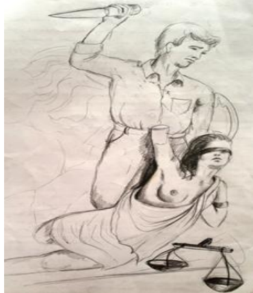
Resim 9. Öğrenci 23 (Picture 9. Student 23)