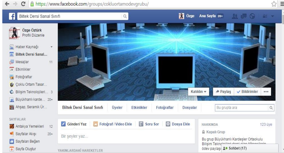
Şekil 3. Biltek Dersi Sanal Sınıfı Ödev Grubu (Figure 3. Biltek Lesson Virtual Class Homework Group)