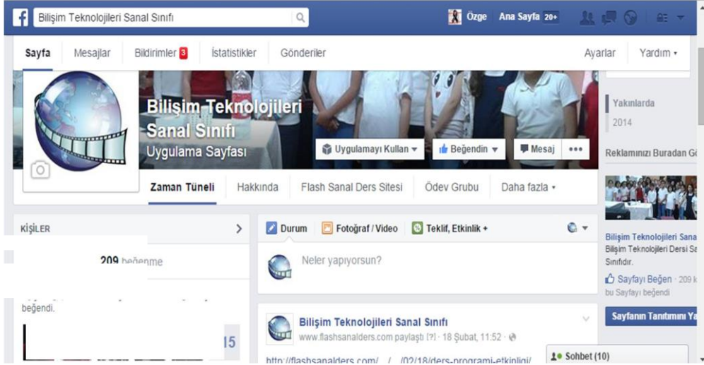
Şekil 2. Bilişim Teknolojileri Sanal Sınıfı Facebook sayfası (Figure 2. Information and Communication Technology Lesson Virtual Class Facebook Page)