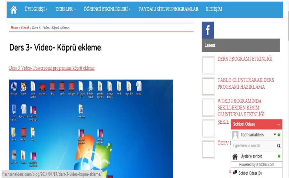
Şekil 1. www.flashsanalders.com sitesi (Figure 1. www.flashsanalders.com site)