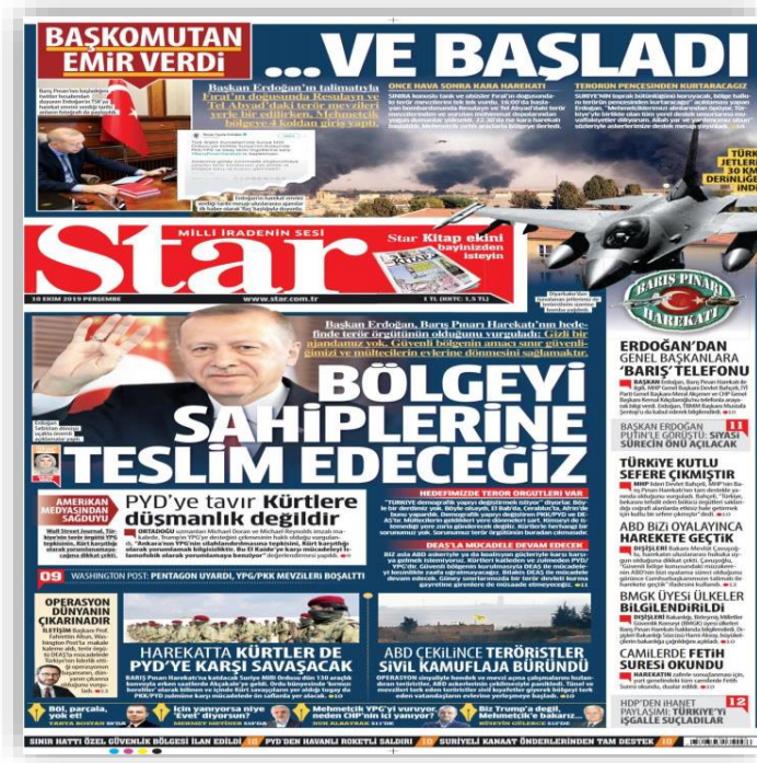
Resim 6. (Star, 10 Ekim 2019)

10 Ekim günü yapılan manşet ile Barış Pınarı Harekâtının başladığını ve yapılan harekât ile “Bölgeyi Sahiplerine Teslim Edeceğiz” manşeti ile harekâtın haklılığını, meşruiyetini okuyucu ile buluşturma ihtiyacı hissedilmiştir. Bu manşetle beraber harekâta dair oluşabilecek soru işaretleri de engellenmeye çalışılmıştır.