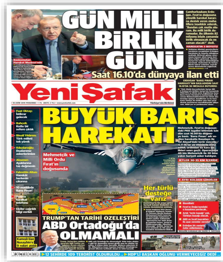
Resim 4. (Yeni Şafak, 10 Ekim 2019)

10 Ekim günü yapılan manşet “Büyük Barış Harekâtı” ile barış vurgusu yapılmış ve aslında yapılan harekât her ne kadar savaş algısı yaratsa da bunun bölgeye barış getireceğini okuyucuyla iletmek istenmiştir. Okuyucunun zihninden oluşan olumsuz kelime olan “savaş” a karşı “barış” kelimesinin kullanmasının temel amacı budur.