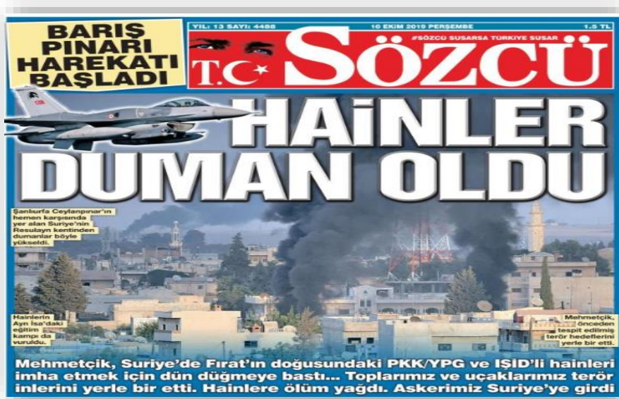
Resim 2. (Sözcü, 10 Ekim 2019)

Sözcü gazetesi harekâtın başladığı 9 Ekim günü “Trump’ın İpiyle Kuyuya İnılmaz” manşetiyle harekâtı gündemine taşımıştır. Haberde özellikle Trump’ın Türkiye ile ilgili tutumunun tutarsız olduğu ve bu doğrultuda da ikili oynadığı vurgusu yapılmıştır. Askeri harekât öncesi bu tutarsız tutum ve atılan manşetle de alakalı gazete, harekâta karşı çokta istekli görünmeyen bir çizgide kendisini konumlandırmıştır. Nitekim haber içeriklerinde Trump’ın Türkiye’ye karşı tavırları ele alınırken diğer taraftan muhalefetin Trump ile Erdoğan arasındaki görüşmelerin açığa çıkarılması taleplerine yer veriliyor.