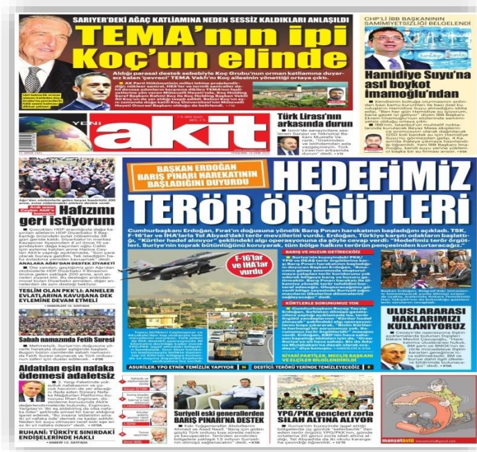
Resim 5. (Akit, 10 Ekim 2019)

10 Ekim günü yapılan manşette “Hedefimiz Terör Örgütleri” denilerek bu harekâtın asıl amacının Suriye’ye girmek olmadığını, aksine harekâtın temel amacının, terör örgütlerini bölgeden temizlemek olduğunu okuyucuya iletmek istenmiştir. Bu başlık ile beraber bu harekâtın haklılığı ortaya çıkarılmaya çalışılmıştır.