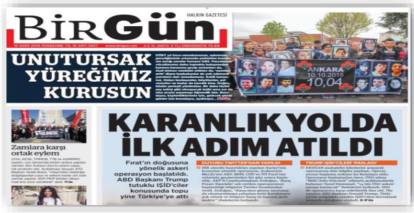
Resim 3. (Birgün, 10 Ekim 2019)

BirGün gazetesi harekâtın başladığı 9 Ekim günü “Yolun Sonu Karanlık” manşetiyle harekâta karşı bakış açısını da ortaya koymaktadır. Nitekim haber içeriğinde harekâtle birlikte doğabilecek sorunlar ön plana çıkartılmıştır.