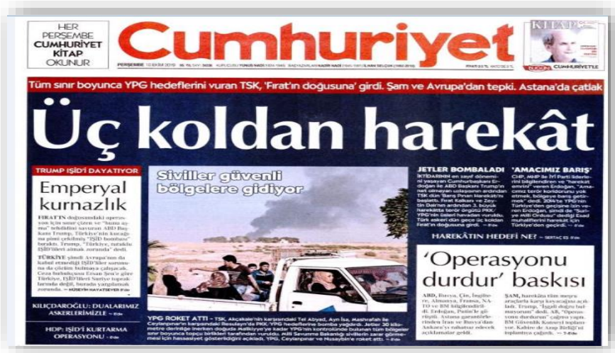
Resim 1. (Cumhuriyet, 10 Ekim 2019)

Cumhuriyet gazetesi harekâtın başladığı 9 Ekim günü “Türkiye’yle Oynuyor” manşetiyle okurlarının karşısına çıkmıştır. Muhalefet parti liderlerinin özellikle Suriye meselesinde Amerika Birleşik Devletleri (ABD) Başkanı Donald J. Trump’ın Türkiye’ye güven vermemesine ve tehdit etmesine karşılık, Türkiye’nin dolayısıyla hükümetin ses çıkaramamasına yönelik eleştirileri haberde ön plana koyulduğu görülmüştür. Harekâtın gerçekleşmesi durumunda ise tek yumruk olmayız mesajı haberde verilmektedir.