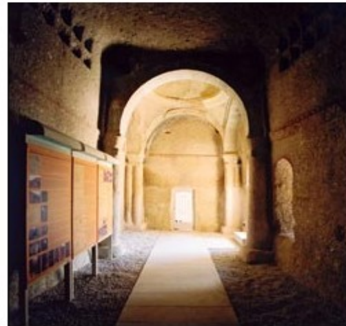
Şekil 11. Sarıca Kilise-Sonra (Figure 11. Sarıca Church-After)