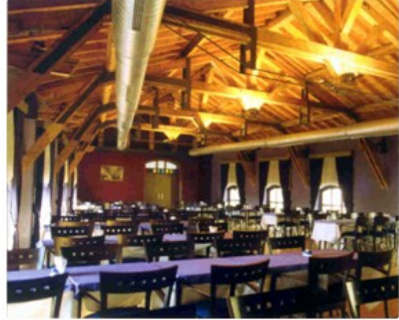
Şekil 7. Cibali Fabrikası-Önce [16] (Figure 7. Cibali Factory-Before)