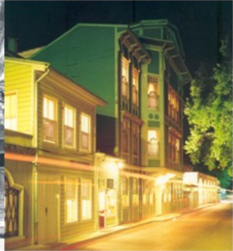
Şekil 5. Yeşil Ev-Sonra [10] (Figure 5. Green House-After)