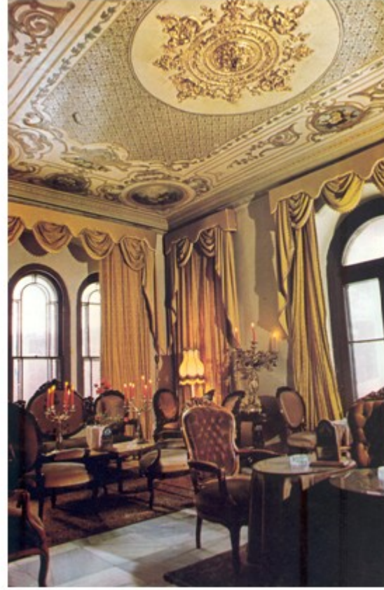
Şekil 3. Malta Köşkü-Sonra [4] (Figure 3. Malta Pavillion-After)