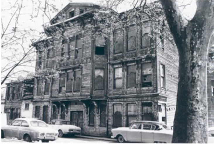
Şekil 4. Yeşil Ev-Önce [10] (Figure 4. Green House-Before)