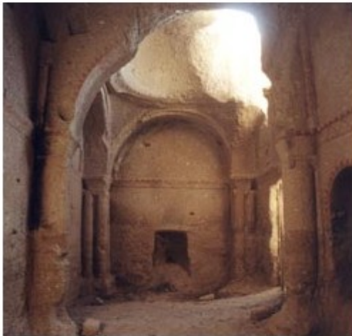
Şekil 10. Sarıca Kilise-Önce (Figure 10. Sarıca Church-Before)

Bizans Mimarisi'nde ilk örneklerine 9. yüzyılda rastlanan kapalı Yunan haçı ile üç yapraklı yonca plan şemasının karışımı olarak inşa edilmiş olan kilisenin onarımını ve canlandırılmasını kapsayan restorasyon proje ve uygulaması 1997-2002 yılları arasında VASCO Turizm Yatırım Sanayi ve Ticaret A.Ş. sponsorluğunda KA.BA. Eski Eserler Koruma ve Değerlendirme - Mimarlık LTD. ŞTİ. tarafından gerçekleştirilmiştir. Proje kapsamında kilisenin doğal malzemesinin sağlamlaştırılması, yapısal sorunların giderilmesi, duvar resimlerinin onarılması, ziyaretçilerin kullanımı için yürüme yolu yapılması, bilgi levhaları yerleştirilmesi ve uygun ışıklandırma yapılması, altyapının güçlendirilmesi gibi çalışmalar yürütülmüştür (Şekil 10, Şekil 11). Kapadokya'da bulunan bu değerli kültürel mirasın yaşatılmasına ilişkin olarak gerçekleştirilen proje 2006 yılında mimari mirasın korunması dalında "Europa Nostra" ödülüne layık görülmüştür [23 ve 24].