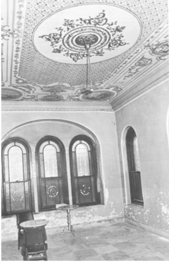
Şekil 2. Malta Köşkü-Önce [4] Figure 2. Malta Pavillion-Before)

Çadır Köşkü, Yıldız Korusu ve köşkün tamamlayıcı yapıları niteliğinde olan Pembe ve Yeşil Seralar ile kameriyeler de onarım projesi kapsamında ele alınmıştır. Sözü edilen projenin uygulanmasının ardından yapı kafeterya olarak hizmete açılmıştır. Malta Köşkü'nün korunması ve çağdaş kullanım amacıyla değerlendirilmesi amacıyla gerçekleştirilen uygulama 1979 yılında "Europa Nostra" ödülüne layık görülmüştür (Şekil 2, Şekil 3) [4, 5 ve 6]. Türkiye "Europa Nostra" dan ilk ödülünü Malta Köşkü onarım uygulaması ile almıştır.