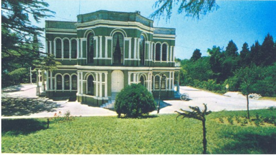
Şekil 1. Malta Köşkü [4] (Figure 1. Malta Pavillion [4])

İstanbul'da Yıldız Parkı içinde, Yıldız Sarayı'nı parktan ayıran duvarın doğu yönünde yer alan Malta Köşkü, 19. Yüzyıl'ın ikinci yarısında, Sultan Abdülaziz tarafından Çırağan Sarayı'nın arka bahçesi olan koruda yaptırılan iki adet seyir ve istirahat köşkünden biridir (Şekil 1). Malta isminin kaynağı tam olarak bilinmemekle birlikte Osmanlı'da fethedilen ya da fetih için teşebbüs edilen yerlerin isimlerinin sarayın mekânlarına isim olarak verilmesi geleneğinden geldiği sanılmaktadır. Diğer bir görüş ise köşkün Malta'dan getirilen taşlar ile inşa edilmesi nedeniyle bu ismi aldığı yönündedir. Malta Köşkü'nün Sultan Abdülhamid döneminde Yıldız Sarayı'na bağlatıldığı ve yapının saray halkının dinlenme ve ziyaret mekânı olarak kullandığı bilinmektedir. Malta Köşkü, Sultan Abdülhamid'in yurdu terk etmesinin ardından yaklaşık 40 yıl süre ile boş kalmıştır [4].