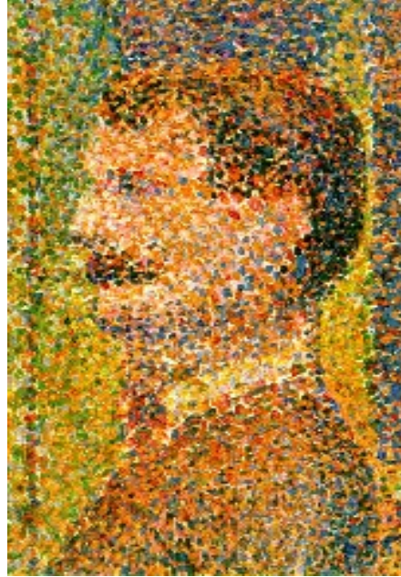
Resim 4. Georges Seurat ve “La Parade”(1889)-Detay” (Picture 4. Georges Seurat and “La Parade”(1889)-Detail”)

vardır: bir kısmı, çubuk şeklinde, uzun; bir kısmı ise, piramit şeklinde ve yayık. Bunlara, çubukçuklar ve okçuklar denir. Renkli görme, piramit şeklindeki okçuklar üzerine düşen uyarımlarla meydana gelir, renkli görmeyi sağlayan bu okçuklardır.” (Tunalı, 1981:91). Tuval üzerinde karışmış olarak bulunan renk karışımları okçukları uyarırken renk uyarımı sonucu insanda renk izlenimi medya gelir. Seurat’ın resimlerinde ise ayrı ayrı noktalar halinde tuvale yan yana sürülen çeşitli renklerin her birinden gelen uyarımlar, ağ tabakasındaki bir okçuk üzerine düşerler ve böylece göz çeşitli birbirinden ayrı bulunan renk noktalarını bir renk karışımı içinde eritir.