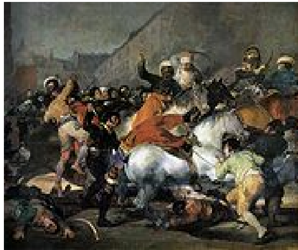
Resim 2. Fransisco de Goya ve "2 Mayıs 1808" (Picture 2. Fransisco de Goya and "2 May 1808")

Özellikle özgür ruhu ve özgün anlatım biçimi ve resim sanatına getirdiği yeniliklerle kendisinden sonraki kuşakları etkileyebilmiş bir ressamdır Goya. Sanatının erken dönemlerinde, o sıralarda moda olan duvar pano boyamaları ile farklılığını göstermiştir. Bir çeşit toplum eleştirisinde bulunur inceden inceye. "Capriehos"ları ise bize detaylı realizm verir. "Savaşın Felaketleri" serisi ile de savaşın vahşiliğini sanki bir savaş muhabiri gibi gözlerimizin önüne sürer. "Charles IV ve Ailesi" isimli resminde ise zekasını kanıtlar. Çünkü İspanyol halkına saray ve efradını en gerçek halleri ile gösterir. Böylece özgün düşüncelerini sanatıyla birleştirdiğini kanıtlayarak Velazquez'den bir adım öne çıkmayı başarmıştır (Akçaoğlu, 1998:14-17).