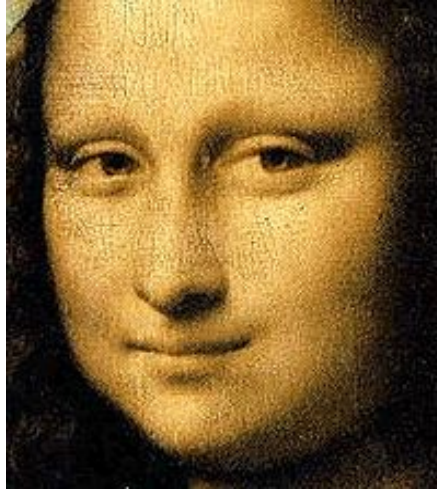
Resim 1. Leonardo da Vinci, "Mona Lisa" (Picture 1. Leonardo da Vinci, "Mona Lisa")