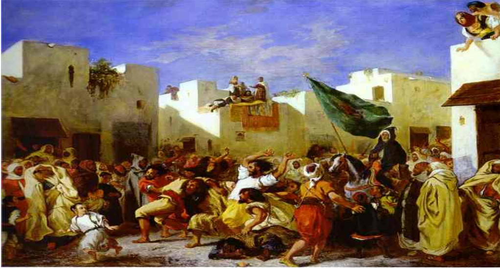
Resim 3. Delacroix ve "Tangierin Fanatikleri" (Picture 3. Delacroix and "The Fantastic of Tangier")

Fransızlar Cezayir'i işgal ettiğinde, diplomatik bir görevle Yemen'e gönderilmiş, bu vesileyle Kuzey Afrika'yı görme fırsatı bulmuştur. Kuzey Afrika doğup büyüdüğü yerden farklı ve bir o kadar da güneşliydi. Hem buradaki kültür hem de yaşam tarzı onu etkisi altında bırakmıştır. Özellikle güneşin görünür dünyayı nasıl renklendirip canlandırdığını fark eden Delacroix paletinde renkleri buna göre ayarlamak zorundaydı. Böylece ilk defa sarı ve mavi rengi yan yana kullanma cesaretini gösterdi ki arkasından gelen izlenimcilere de yol göstermiş oldu.