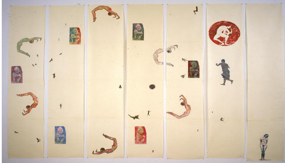
Resim 4. Nancy Spero, Akrobat, 280.67x52.07 cm, Kağıt Üzerine Karışık Teknik, Çizim, Boyama ve Kolaj, 1990.

(Picture 4. Nancy Spero, The Acrobat, 280.67x52.07 cm, Drawing; Collage Mix Media and collaged papers on paper, 1990.)