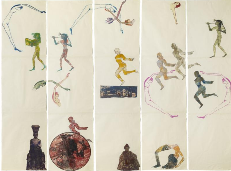
Resim 3. Nancy Spero. The Goddess Nut II, Kağıt Üstüne Elle Baskı ve kolaj, 213.4 x 279.4 cm, 1990. (Picture 3. Nancy Spero. The Goddess Nut II, Handprinting and printed collage on paper, 213.4 x 279.4 cm, 1990.)

"Artaud Kanunları" ve Brecht şiirlerinden yola çıkarak ve onlara göndermeler yaparak oluşturduğu birçok resmi, özgün baskısı ve enstelasyonu (yerleştirmesi) vardır. Nancy Spero'nun, edebi eserlerle özellikle de şiirle olan ilişkisi sadece Antonin Artaud ya da Bertolt Brecht şiir ve metinleri ile ilgili değildir. Sanatçının önceki dönemlerden, mitolojiden ve kültürler arası hikâyelerden beslenerek oluşturduğu çalışmaları birçok şeyi bir arada barındırır. Mısır kültüründe yer alan tanrı ve tanrıça figürleri, uzak doğu sanatında yer alan ince uzun dikey kompozisyon anlayışı ve resim yazı birlikteliği Spero'nun çalışmalarının neredeyse merkezinde yer almaktadır.