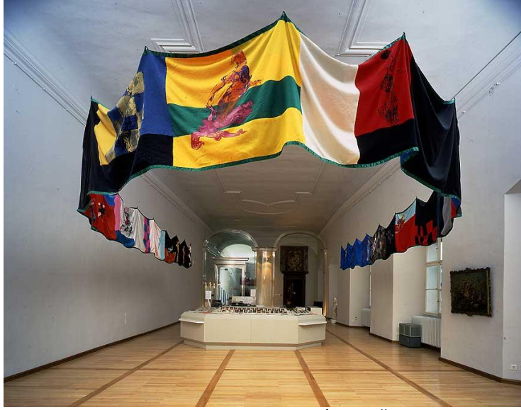
Resim 2. Nancy Spero. A Cycle in Time, İpek Üstüne Elle Baskı, 1995. (Picture 2. Nancy Spero. "A Cycle in Time," Handprinting on silk. 1995.)