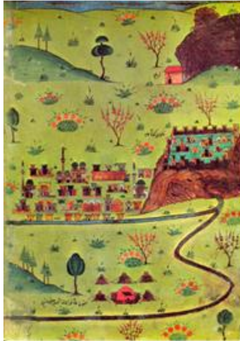
Şekil 5. 1533-1536 yılları arasında Kütahya

Source: http://sehirler.net/resim-kutahya-resimleri-35-kutahya-kalesi-4243.htm )