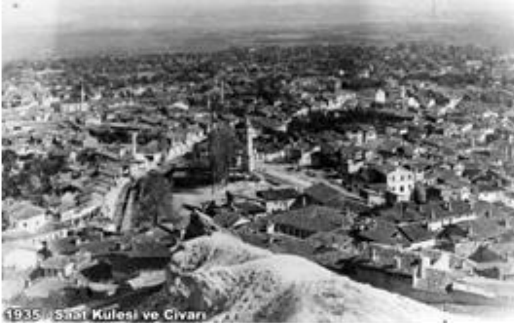
Şekil 3. 1935 Saat Kulesi ve çevresi

(Figure 2. Ulu Mosque and around 1930)