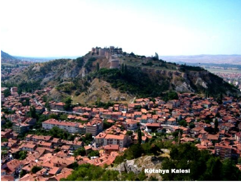
Şekil 4. Günümüzde Kütahya