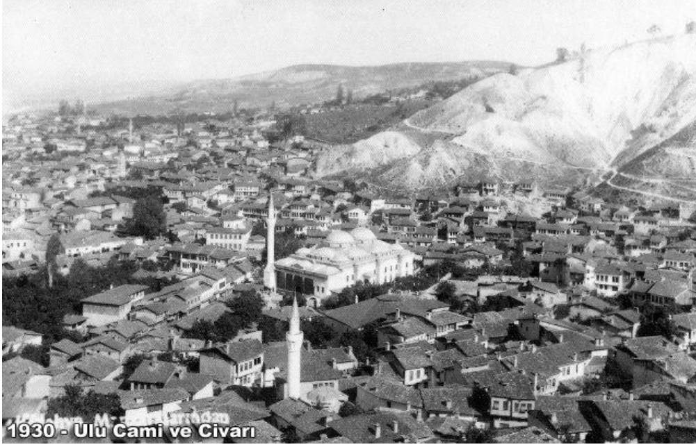
Şekil 2. 1930 Ulu Cami ve çevresi (Kaynak: http://www.muratgenisel.com/191-kutahyadan-eski-gorunumler.html )

(Figure 2. Ulu Mosque and around 1930) Source: http://www.muratgenisel.com/191-kutahyadan-eski-gorunumler.html )