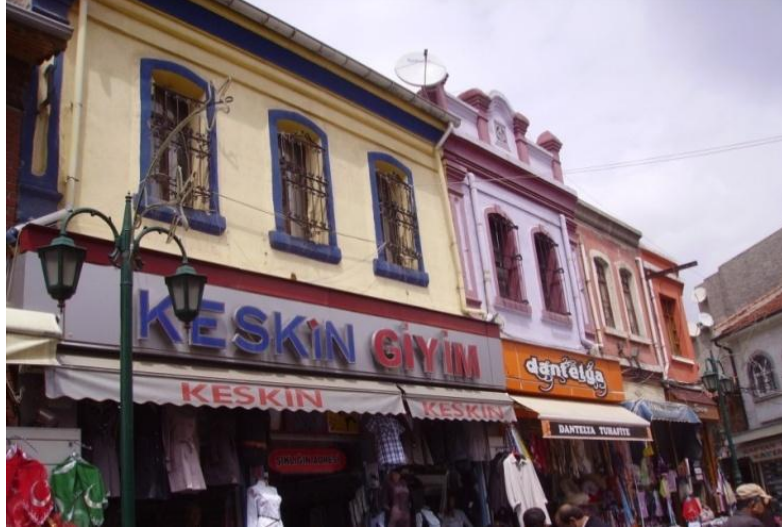
Şekil 4. Taşbaşı sokak cepheleri (Figure 4. Street facades of Tasbası)