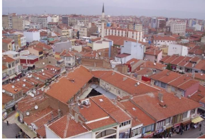
Şekil 3. Taşbaşı çarşı dokusu (Figure 3. Tissue of Tasbasi marketplace)

Dokunun bir diğer karakteristik özelliği de, yapılar arasındaki avlulu mekânlardır. Sokaktan bir geçitle girilen, yapı adasının ortasında genişleyen ve bazen bir başka geçitle diğer sokağa bağlanan veya kendi içinde kapanan açık alanlar gibi sürprizli mekânlar bulunmaktadır. Bu avlulu çarşı mekanları da işlevlerine göre farklılık göstermektedirler. Avlular ile hafif bir eğimle dönerak yürüyene farklı görme açıları veren sokaklar sürprizli vista noktaları oluşturmaktadır. Bazı sokak kesişimlerinde oluşan meydancıklar da dokuya olumlu katkıda bulunmaktadır [10]. Tüm bu özellikleri ile Taşbaşı Çarşısının, Osmanlı Çarşılarının genel karakteristiklerini bünyesinde barındırdığı görülmektedir (Şekil 2, 3).