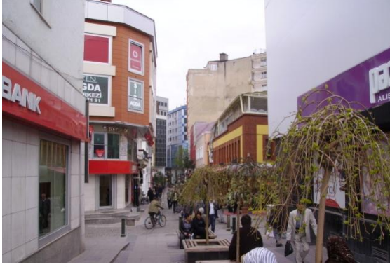
Şekil 7. Yenilenmiş bir sokak (Figure 7. A Renowated Street)