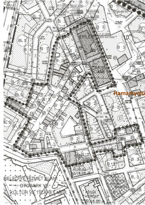
Şekil 2. Taşbaşı Sit Alanı [14] (Figure 2. Taşbaşı Conservation Area)

Taşbaşı Çarşısı'nın kente tarihsel derinlik katan tarihi yapı stoku, Eskişehir'e özgü bir mimari stile sahip ticaret yapıları olarak Odunpazarı'ndaki konut dokusundan farklılık gösteren ve bir arada belli bir doku oluşturan yapılardır [10]. Çarşı dokusu, bitişik nizam dükkân sıralarının bulunduğu, yüksekliği genelde tek kat ile üç kat arasında değişen çok küçük parsellerden oluşmaktadır. Çarşıda dükkân cepheleri yaklaşık olarak 3-5 m. aralıyken, ada derinlikleri 5-10 m. civarında değişmektedir. Yapı adalarının her tarafını çevreleyen yollar ise 3-5 m. olanlarının yanı sıra genelde 7-10 m. genişliğindedirler. Tüm sokak ve yapılar, insan ölçeği ile uyumlu boyutlardadır. Çarşıda, kuyumcular, ayakkabıcılar, tuhafiyeciler, züccaciyeciler, hırdavatçılar, aktarlar, kahveciler, hallaçlar, bileyciler, toptan ve perakende bakkaliyeler vb. gibi tek tek etkinliklerin toplandığı sokakların varlığı, geleneksel merkez özelliklerini yansıtmaktadır [12]. Gerek ticari işlevin gerekse kullanıcı alışkanlıklarının bir sonucu olarak zemin katlar yoğun olarak ticaret, üst katlar depo biçiminde kullanılmıştır.