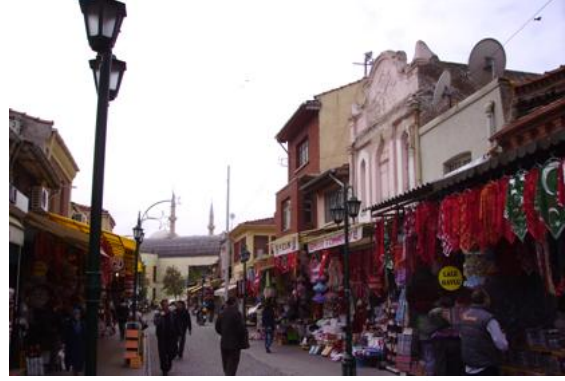
Şekil 8. Taşbaşı'nda bir sokak (Figure 8. A Street in Tasbasi)

Çarşının sürdürülemeyen özelliklerinin bulunmasının yanında, fiziksel, sosyal ve kültürel sürdürülebilir nitelikleri ağır basmaktadır. Kolay ulaşılabilen konumu, içinde sıcak su kaynaklarını barındırması nedeniyle tüm kent halkının yoğun olarak kullandığı ve canlılığını her dönemde koruyan bir merkez olması, bu özelliklerin başında gelmektedir. Yeni gelişen ticaret alanlarına rağmen Eskişehir kent bütünü içinde görece avantajını ve konum özelliğini sürdürmektedir [10]. Bu durum, çarşının hiçbir dönemde çöküntü bölgesi haline gelmemesinin en önemli nedenlerinden biridir. Zaman içinde ortaya çıkan fiziksel yıpranmalara karşın işlev olarak önemini sürdürmüştür.