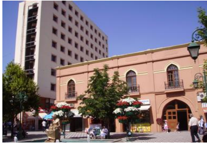
Şekil 6. Taşhan ve Taşbaşı Ticaret Merkezi (Figure 6. Tashan and Tasbasi Trade Center)

Yerel yönetimin yaptığı son uygulamalar ise, altyapının getirilmesine ek olarak, sokak ve cephe bazında yapılan iyileştirmeler ile kentsel mobilyalar eklenmesi şeklinde olmuştur (Şekil 7). Geleneksel çarşının yaya trafiğinin gündüz çok yoğun olması nedeniyle, yerel yönetim tarafından bazı ulaşım düzenlemeleri yapılmıştır (Şekil 8). Buna göre alanın iki taşıt güzergâhı dışındaki tüm yolları yaya yoluna dönüştürülürken, alanın servis hizmeti akşamın geç saatleri ile sabahın erken saatleri arasına alınmıştır. Ayrıca kentin ulaşım hizmetine katılan iki tramvay hattının kesişim noktasının, Taşbaşı Çarşısının sınırını oluşturan ve kentin önemli ulaşım aksı olan İki Eylül Caddesi üzerinde yer alması, bölgenin ulaşımını kolaylaştırırken merkezi niteliğini de güçlendirmektedir. Böylelikle alan, yalnızca toplu taşıma ve sınırlı sayıda motorlu araçla ulaşılabilen, yaya odaklı bir merkez haline dönüşürken, tarihi dokunun da taşıtların yol açacağı zararlı etkilerden korunması sağlanmıştır.