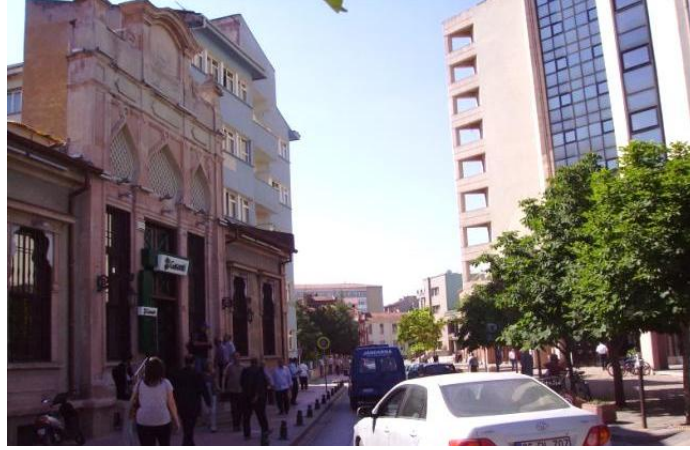
Şekil 5. Eski Osmanlı Bankası Taşbaşı Ticaret Merkezi, Vergi Dairesi (Figure 5. Former Ottoman Bank, Tasbasi Trade Center, Tax Office)