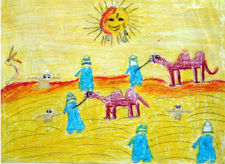
Foto 3. 11 yaş çocuğunun görme biçimi (Photo 3. 11 year old child's visual format)

Sanat yapıtları ya da estetik objeler eleştirel, yapısal anlamlar içerdiğine göre, sanat yapıtlarının temelinde bilgi objesinin bulunması gerektiği düşünülebilir. Çünkü sanatçı öznesi ile bu öznenin yöneldiği estetik obje arasındaki bağ, objenin özne tarafından görülmesi-algılanması temeline dayanır. Çünkü nesnelere-objelerin sanatçı tarafından görülmesi onun aslında bir bilgi objesi olarak algılandığını gösterir. Bir anlamda bu algılama onun yorumlanması demektir. Böylelikle sanatçı bilgi objesini sanat yapıtlarına dönüştürerek onu estetik obje haline getirir. Yani sanat yapıtları estetik obje haline gelmeden önce bir bilgi objesidir, bu anlamda bilgi objesi de estetik objeyi önceden tayin eder. Çocuğun da yaptığı resimde algıladığı dünya ve bilgi birikiminin etkisine vurgu yapmakta fayda görülmektedir. Ancak çocuğun ürettiği şeyde yetişkin bir sanatçının estetik kaygıları aranmaz, aranmamalıdır. Çünkü çocuk bu felsefi kavrayışa sahip değildir. Çocuk için güzel olan üzerinde durduğu kavram ya da nesneden seçip ayırabildikleridir. Çocuğun gelişim sürecinde farkındalıklarını artırmak için görüntü hafızasını zenginleştirmek ve kendi imgeleri ile imge kökleri arasındaki bağlantıları güçlendirerek imgelemci düşünme yetisini geliştirmek gerekir. Onların yarattıkları imgeleri anlayabilmek ve yorumlayabilmek için genel olarak imgenin ne olduğunu tanımlamakla işe başlamayı uygun görüyoruz. Bunu yaparken çocuğun bir insan yavrusu olduğuna dair en başta yaptığımız vurguya yaslanıyoruz.