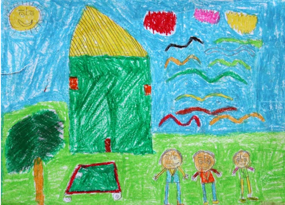
Foto 2. 9 yaş çocuğunun görme biçimi (Photo 2. 9 year old child's visual format)

Bu araştırma çocukların, ürettikleri sanat yoluyla görme biçimlerinin çözümlenmesi konusuna yaptığı katkılar bakımından oldukça önemlidir.