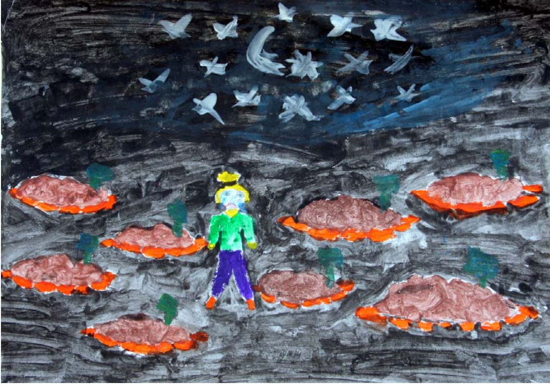
Foto 4. 12 yaş çocuğunun görme biçimi (Photo 4. 12 year old child's visual format)

Sanatsal imge, gerçekliğe ilişkin yansımanın özel bir biçimi olduğu ölçüde, oluşu ve özü de bilginin genel kurallarına uyar. Buna karşın, çok özgün olan niteliklerinden bir şey yitirmez.