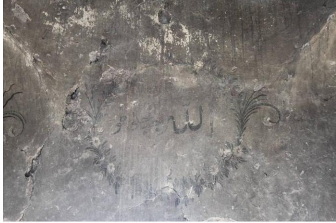
Fot.7. "Allah Celle celalehu" Yazılı Madalyon Photo.7. Medallion Engraved: "Allah Celle celalehu"