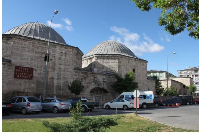
Fotoğraf 1. Sivas Behram Paşa Hamamı (Kurşunlu Hamam) (Photo 1. Sivas Behram Paşa Hammam (Kurşunlu Hammam))

Hamam günümüzde sağlam bir şekilde ayakta durmakta ve asıl fonksiyonuna yönelik hizmet vermektedir. Çifte hamam olarak inşa edilmiş olan yapının erkekler kısmı girişi güneye, kadınlar kısmı girişi ise batıya açılmaktadır 4 . Hemen hemen birbirinin simetrisi olan her iki kısımda; sırasıyla, soyunmalık, soğukluk, sıcaklık, su deposu ve külhan kısımlarından oluşmaktadır.