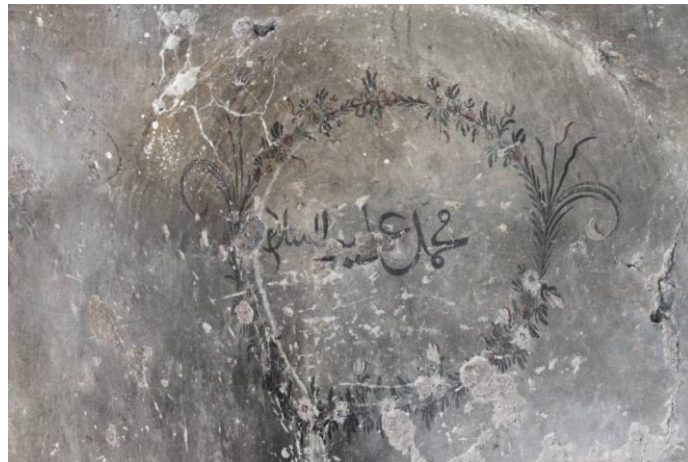
Fotoğraf 6. "Muhammed Aliyyisselam" Yazılı Madalyon (Photo 6. Medallion Engraved: "Muhammed Aliyyisselam")

Allah, Hz. Peygamber, halifeler ile peygamber torunlarının isimlerinin yazılı olduđu bu mekanın sonraki dönemlerde mescit olarak kullanıldıđı aşıkardır. Yöre halkı ile yapılan mülakatlarda; dedelerinin hamamın medrese olarak kullanıldıđına dair aktarmış olduđu bilgiler tarafımızca derlenmiştir. Bu sözlü bilgiler ve mekanlar üzerinde yer alan ifadelerden, hamamın 20. Yüzyıl başlarında medreseye dönüřtürüldüđu, sıcaklık mekanının gÜneyindeki kubbeli kısmında mescit olarak kullanıldıđı anlaşılmaktadır.