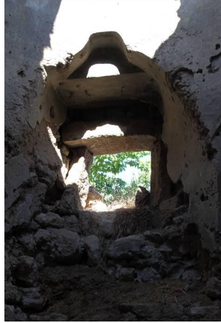
Fot.5. Sıcaklık Kuzey Bölüm Penceresi (Photo 5. "Sıcaklık" Room North Section Window)

Allah, Hz. Peygamber, halifeler ile peygamber torunlarının isimlerinin yazılı olduđu bu mekanın sonraki dönemlerde mescit olarak kullanıldıđı aşıkardır. Yöre halkı ile yapılan mülakatlarda; dedelerinin hamamın medrese olarak kullanıldıđına dair aktarmış olduđu bilgiler tarafımızca derlenmiştir. Bu sözlü bilgiler ve mekanlar üzerinde yer alan ifadelerden, hamamın 20. Yüzyıl başlarında medreseye dönüřtürüldüđu, sıcaklık mekanının gÜneyindeki kubbeli kısmında mescit olarak kullanıldıđı anlaşılmaktadır.