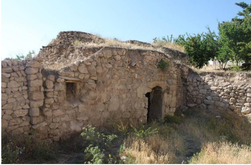
Fotograf 3. Çepni Köyü I Nolu Hamam (Photo 3. Çepni Village Hammam Numbered 1)

Sivas ili Gemerek ilçesine bağlı Çepni Köyü'nde bulunmaktadır (Fotoğraf 3). Hamam üzerinde inşa ya da onarım kitabesi yer almamaktadır. Yapının mevcut planı dikkate alındığında dönemsel hiçbir özellikle karşılaşılmamaktadır. Ancak Hikmet Denizli yapının hemen yakınında bulunan Çepni Köyü Camisi üzerindeki inşa kitabesinden (M.1629) hareketle, hamamında caminin vakfı olarak 17. yüzyılda inşa edilmiş olabileceğini ifade etmektedir (Denizli, Tarihsiz:313).