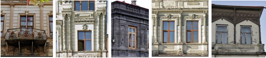
Şekil 8. İncelenen binaların figüratif öğe detayları (Kaynak: Google Earth, 2021; Türkan, 2017, s.94, 156)

Figüratifleştirme bakımından çalışmadaki binaların kitlesel yapısı önemlidir. Figürsel öğeler arasında genellikle bitkisel motifli korkuluk, kilit taşı, rozet, lento ve plaster gibi elemanlar bulunmaktadır (Şekil 8).