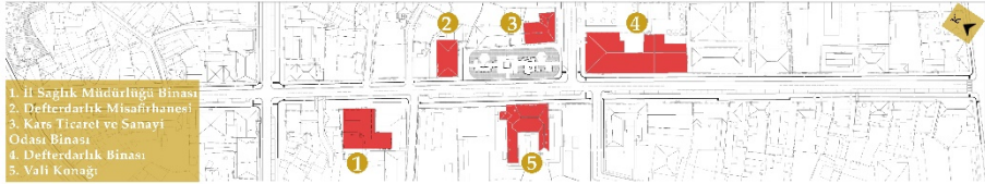
Şekil 4. Haydar Aliyev caddesi planı

Çalışma kapsamında yapılacak analizlerin tutarlılığı ve seçilen yapıların konumları açısından Kars Merkez'de bulunan Haydar Aliyev (Ordu) Caddesi üzerinde çalışılmasına karar verilmiştir (Şekil 4-6). Haydar Aliyev Caddesinin kimliğinin değeri, binalarının bir arada olmasına ve kullanımlarının devam etmesine dayanmaktadır. Tablo 1'de seçilen kamu yapılarının künyeleri gösterilmektedir.