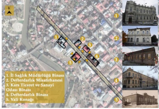
Şekil 9. İncelenen binaların girişleri, yönelimleri ve caddeye bakan cepheleri (Görseller: Google Earth, 2021; Türkan, 2017, s.71, 78, 94, 150, 156)