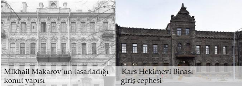
Şekil 1. Petersburg 1870 ve Kars Baltık mimari örnekleri

Rus yerleşimi kalenin güneyinde St. Petersburg'un kent plan sisteminde olduğu gibi gridal düzende birbirini dik kesen büyük caddelerle planlanmıştır. Çevresinde geç Baltık stilinde ve Rus üslubunda kilise, şapel ve katedraller olan açık meydanlar bulunmaktadır. Yerleşim en fazla 3 katlı, cad-delerde bitişik nizamda sıralanan kat sistemleri, kornişler, saçaklar, çatı ve baca biçimleri, her katta farklılaşan sütun dizilimleri, dışa taşınmış, rustika biçimi kesme taşları, üçgen alınlıklar ve andezit/bazalt taşı kullanılarak kur-gulanmış cephelere sahip yapılardan oluşmaktadır (Gündoğdu, 2010).