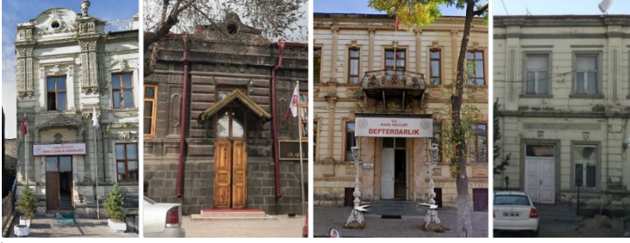
Şekil 7. İncelenen binaların girişleri

Mekânsallaştırma özelinde binalar incelendiğinde sokaktaki kamu bağlamı görülmektedir. Konu alanı olarak seçilen binalar çevrelerindeki diğer mekânlardan ayrılmaktadır. Binaların cephe düzenleri, vurgulanmış girişler ve dekoratif elemanlar ile mekânsal görünümleştirme güçlendirilmektedir (Şekil 7).