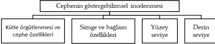
Şekil 3. Göstergebilimsel yöntem aşamaları

Benimsenen analitik çerçevede Lukken vd. (1993) tarafından geliştirilen göstergebilimsel yöntem temel alınmıştır. Bu yöntem, göstergebilimden binanın mimarisi için bir yorum bilimi olarak yararlanmaktadır. Tüm yapının anlamını ve gösterge sistemini daha iyi anlamak için cepheye dair farklı anlam katmanlarını analiz etmektedir (Guirguis, Dewidar, Kamel ve Iscandar, 2018). Çalışmada kullanılan cephenin göstergebilimsel incelenmesi adımları Şekil 3’de verilmiştir.