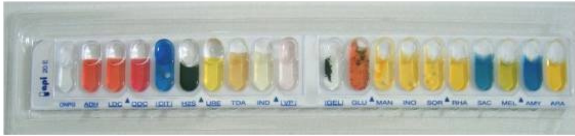
Şekil 2. API 20E test kitindeki tipik Salmonella reaksiyonları

inoküle edilmiş ve çalkalamalı (200 rpm) inkübatörde 37 °C'de 18 saat inkübasyona bırakılmıştır. İnkübasyon sonrasında, steril saf su ile 1:100 (hacim:hacim) oranında dilüe edilen örneklerden 100 µL Müller Hinton (Oxoid, UK) agar plakları üzerine yayma ekim yapılmıştır. Antimikrobiyal ajanlar (Oxoid, UK) emdirilmiş 6 mm'lik steril kağıt diskler, agar yüzeyine yerleştirilmiş ve 37 °C'de 18 saat inkübe edilmiştir. Disk difüzyon yöntemi için, 16 farklı antimikrobiyal madde kullanılmıştır. Kullanılan antimikrobiyal diskler ve içerikleri Tablo 1'de verilmiştir. İnkübasyon sonrası, disklerin etrafındaki zon çapları ölçülmüş ve Klinik Laboratuar Standartları Enstitüsü (CLSI)'nin belirlediği sınırlar ile karşılaştırılarak suşlar duyarlı (S), orta dirençli (I) ve dirençli (R) olarak belirlenmiştir (7).