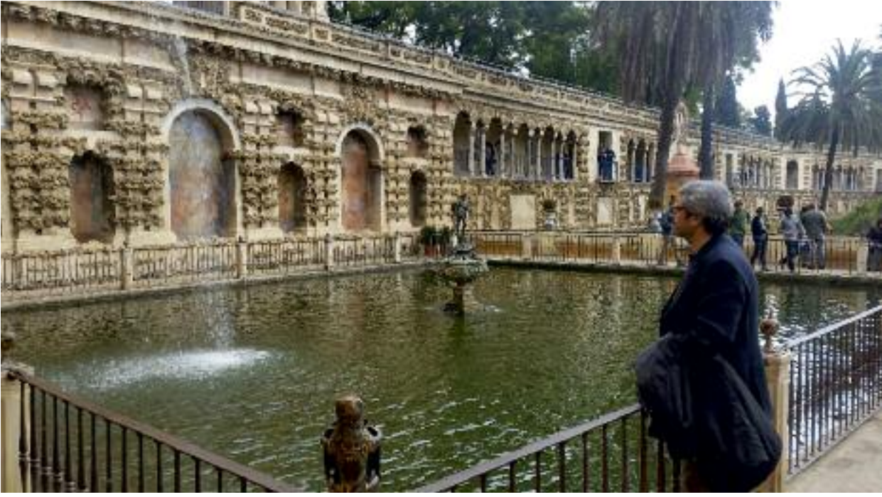
Sevilla ırmağı çevresi / İspanya

İslam'ın 8. Yüzyıldan itibaren Kuzey Afrika ve İran'a doğru yayılmasıyla beraber, İslami mutfak, müziği, kıyafeti, mimariyi ve edebiyatı etkileyecek bir boyut kazanmıştır. İbn Batuta'nın 1325-1354 yılları arasında Pekin, Kalküta, Buhara, İstanbul, Granada ve Timbuktu'yu içine alan seyahatinde İbn Batuta yeni tatları ve manzaraları, karşılaştığı memleketlerin ve insanların alışılmadık yönlerini, örfleri ve anıtlara aynı ilgiyi göstererek kaydetmiştir. Bu gezgin coğrafyacılar, toplumları anlatmanın yanı sıra peyzajı da ayrıntılı bir şekilde gözlemlemiş, sıklıkla da İslam dünyasının bir parçasını diğeriyle, Sevilla'nın ırmak manzarasını Dicle ve Nil'le ya da Bağdat'ı Kahire'yle, bir cümlede ikisini birden överek karşılaştırmıştır. 2