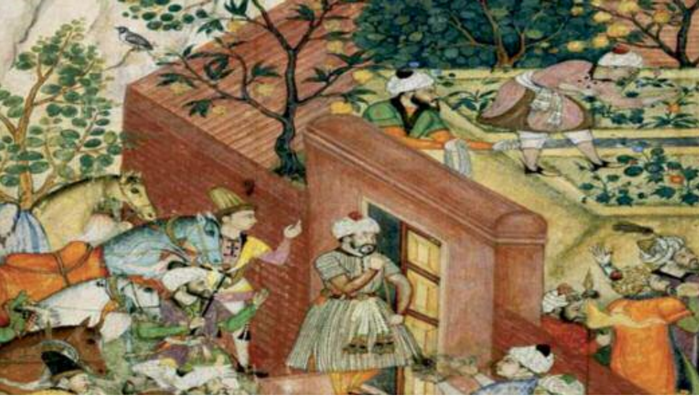
İslam dönemi bahçe tasviri.