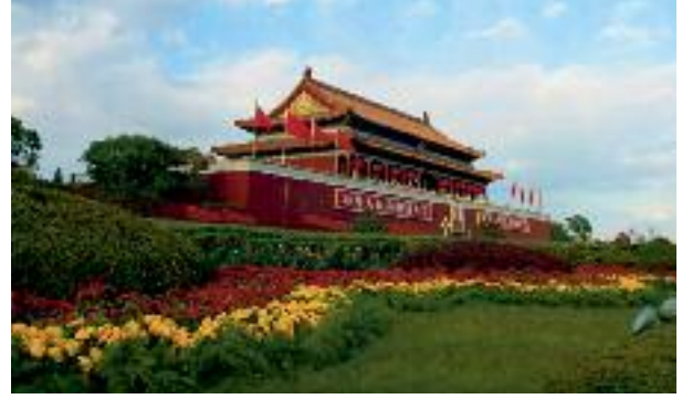
Pekin / Çin

Zaman tüm süreçler boyunca canlılığını korur. Sadece geçmişin birikimleri; ruhsuz bedenlerde ölüdür. Anlam içermeyen modern bahçeler ve parklar; İslam bahçe tasavvuruna yabancı, Müslüman şehirler ile kadim uygarlıktan habersiz bedenler gibi ruhsuzdurlar.