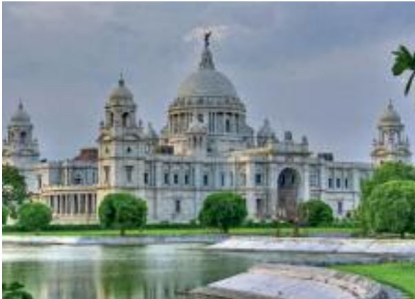
Kalküta / Hindistan

Cennet kavramına göndermeler 14. Yüzyıl Endülüs ve Hindistan’ındaki camilerin gelişiminde de görülür. Hindistan’da ağaç ölümden sonra dirilişin sembolü olarak yorumlanmıştır.