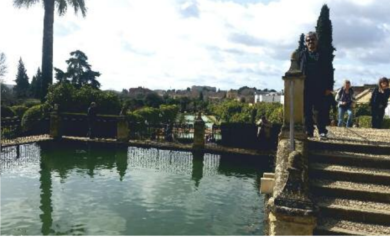
Cordoba - İspanya

İnsanlar bahçeleri bir taraftan mekânsal yapılar olarak seyrederken bir taraftan da işitme ve koku duyularıyla deneyimler. Bir bahçe, damlayan suyun ve kuşların ötüşünün müziğinden mahrum olamaz. İslam bahçeleri, sayısız şiirde de geçtiği gibi, çoğunlukla şarkıları ve ötüşleriyle dinleyenlere zevk veren bülbül ve kumrularla doluydu. İranlı büyük şair Firdevsi, Kızıl Deniz kıyısındaki bir bahçeyi tarif ederken, “Bülbül bütün bahar dallarına konar/Yumuşak nağmeleri yayılır” diye yazmıştı. Bir başka şair Manuçihri, bir bahçede ilkbaharı şöyle tarif ediyordu: “Kumru müezzindir, sesi de ezandır.” Bahçeler çiçeklerin güzel kokularıyla doludur; çiçek açan portakal ağaçlarının kokusu, bir anlığına sesleri ve görüntüyü unutup gözlerini kapayarak derin bir nefes alan insanı sarıp sarmalayan yoğun bir duyusal deneyimdir. Bahçelerdeki ağaç ve bitkilerin büyük kısmı sadece görüntüleri için değil, zevk veren kokuları ve sululu meyvelerinin tadı için ekilip dikilmiştir.