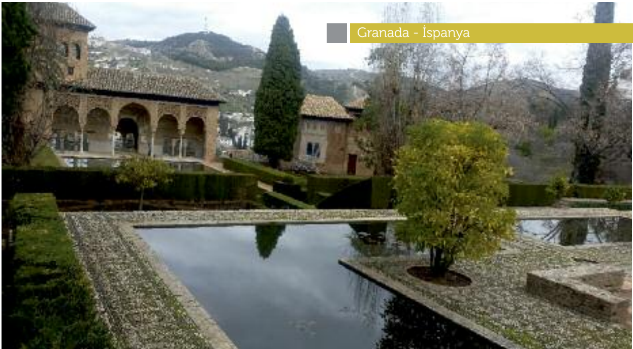
Granada - İspanya

Bağ-ı Nilüfer (Lotus Bahçesi), Babürlü İmparatorluğu'nun kurucusu Babür tarafından 1527-30 arasında Dholpur'da inşa edilmiştir. Bahçede yükseltilmiş bir su kemeri (yaklaşık 83 metre yükseklikte) vasıtasıyla su tedarik eden bir basamaklı kuyu ve bir dağıtım havuzu, hamam, küçüklü büyüklü havuzları olan etrafı çevrili bahçeler içeriyordu. Bunların hepsi birbirine kaya yüzeyine oyulmuş ve bir taraçadan diğerine geçerken suyu küçük çadarlar 12 üzerine boşaltan bir su kanalı (18 cm genişliğinde ve 5-8 cm derinlikte) tarafından bağlanıyordu. Bahçe adını, lotusun kapalı tomurcuk halinden çiçeklenmeye ve nihayet taç yaprakları solarak tükenme safhalarından oluşan hayat çizgisi model alınarak oluşturulmuş birbirine bağlı su teknelerinden almıştır. Çiçek safhası en büyük su teknesiydi. Kesişen su kanallarının merkezindeki taş taraçaların en alt katında dururdu. Su, buradan cahar bağ şeklinde daha alçak bir bahçeli seviyeye akardı. Babürlü bahçelerinde görülen çeşme fiskiyeleri yerine, küçük şelaleler ve su tekneleriyle sınırlıydı.