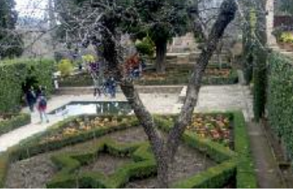
Granada / İspanya