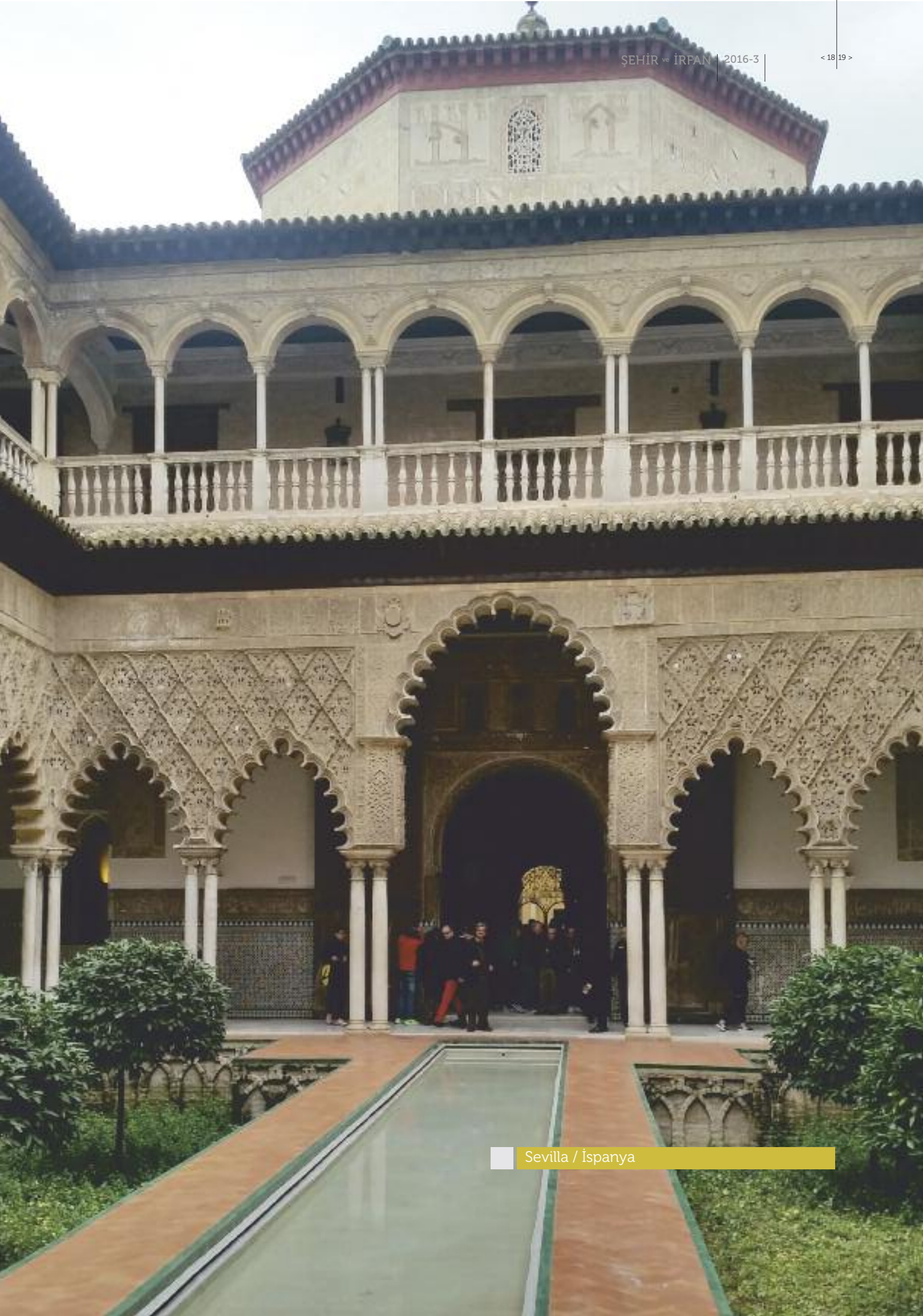
Sevilla / İspanya