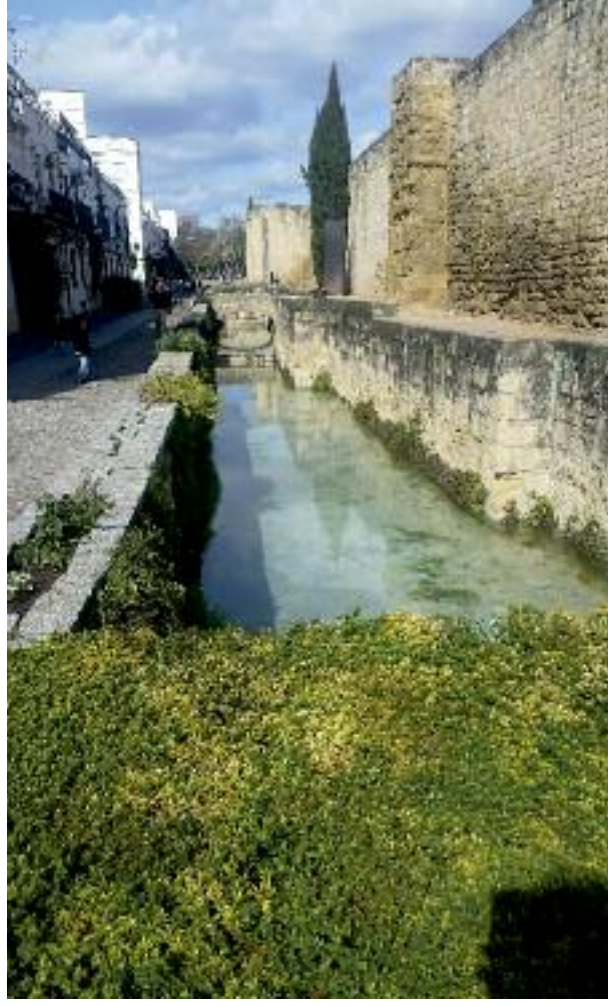
Granada / İspanya