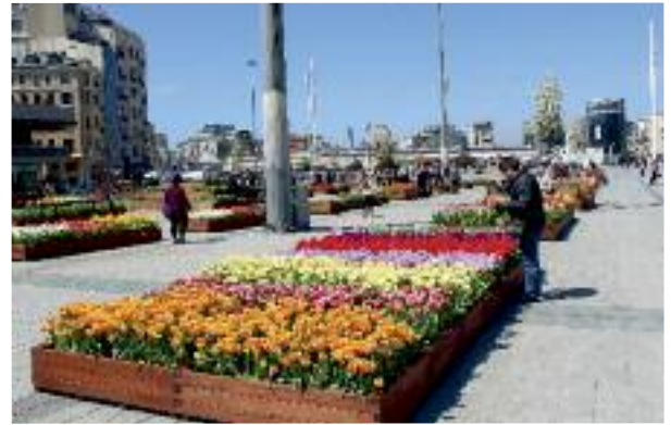
Taksim / İstanbul

Zaman tüm süreçler boyunca canlılığını korur. Sadece geçmişin birikimleri; ruhsuz bedenlerde ölüdür. Anlam içermeyen modern bahçeler ve parklar; İslam bahçe tasavvuruna yabancı, Müslüman şehirler ile kadim uygarlıktan habersiz bedenler gibi ruhsuzdurlar.