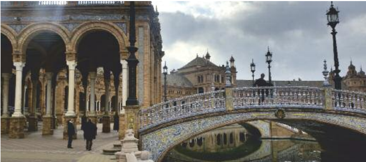
Irmak ve çevresi / Sevilla - İspanya

Bahçe kavramı; suyun değerli, verimli toprağın kıt olduğu bölgelerde, tüm doğal güzellikleri içinde barındıran mekânlar olarak ayrıca önem kazanmıştır. İslamiyetin doğduğu Arap yarımadasında da tabiat şartlarının zorluğu, denetim altında tutulabilecek tek yer olan bahçelere verilen önemi ve değeri arttırmıştır. Kur’an-ı Kerim’de cennetin bir bahçe olarak detaylarıyla tasviri, İslam dünyasında bahçe ve cennet kavramlarının birbirleriyle bütünleşmesini sağlamıştır. Cennette bulunan dört ırmağın birbirine dik açıyla keşişmesiyle oluşan, dört bölümlü bahçe anlayışı, İslam Bahçe Sanatının temelini oluşturmuştur. Cennetsel bir unsur olarak algılanan su da, İslam bahçelerinin vazgeçilmez ögesi haline gelmiştir.