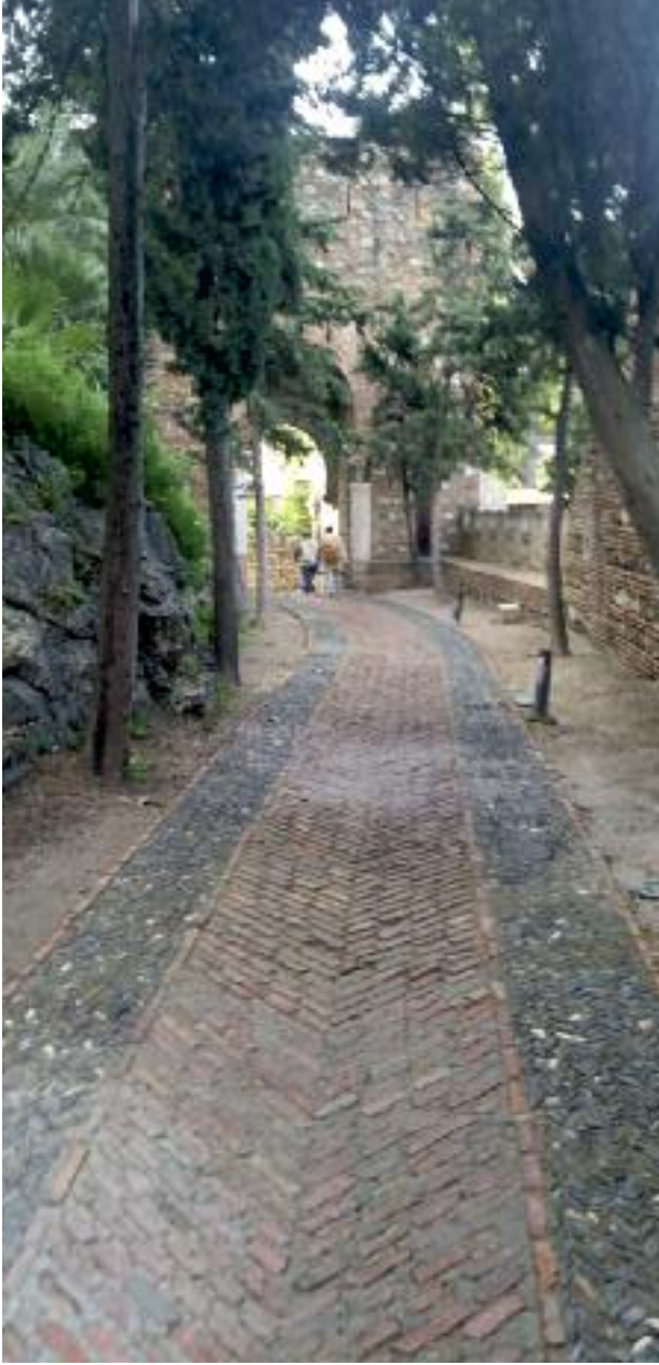
Melaga / İspanya

Kuran'ın ve çeşitli hadislerin cenneti bir bahçe olarak tasvir etmesine ve camilerde bulunan mozaik ve sütunlardaki ağaç ve doğa tasvirleri, açıkça cennet bahçesini akla getirme niyetiyle yapılmıştır. Kurtuba surları dışında Hayrû'l-Zeccali, 10. Yüzyıl sonunda ya da 11. yüzyıl başlarında hanedandan olmayan varlıklı bir aileye ait bir zevk bahçesi idi. Bu bahçe “duyuların tatmini” ve “ayıklığın ve sarhoşluğun zevkleri” için kullanılmaktaydı. 14