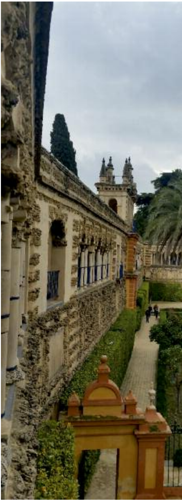
Sevilla / İspanya