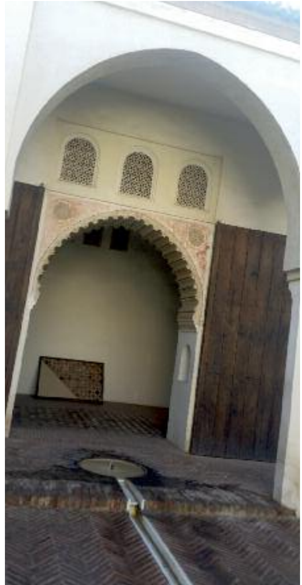
Melaga / İspanya

İslam medeniyetinin bulunduğu bölgedeki peyzaja kökten değişimler getirdiği görülmektedir. İslam medeniyeti bahçe ve peyzaj kültüründe “Cahar Bağ” gibi bir bahçe tipolojine sahiptir. Ayrıca coğrafyanın iklimsel sorunlarını minimize etmek için, suyun becerikli bir biçimde ıslahı ve taşınmasıyla Ortadoğu ve Kuzey Afrika'nın kavruk toprakları tarım ürünleriyle ekonomiyi dönüştürmekle kalmayıp, güçlü bir kültürel ifade biçimi haline de gelen insan yapısı yeşil vahalarla bereketlendi. Hayvanlar ile bitkilerden de yararlanılarak bir peyzaj kültürü geliştirildiği görülmektedir. İslam Bahçe kültüründe, su temel öğelerden biridir. Hem yapay hem de ırmaktan gelen doğal haliyle suyun