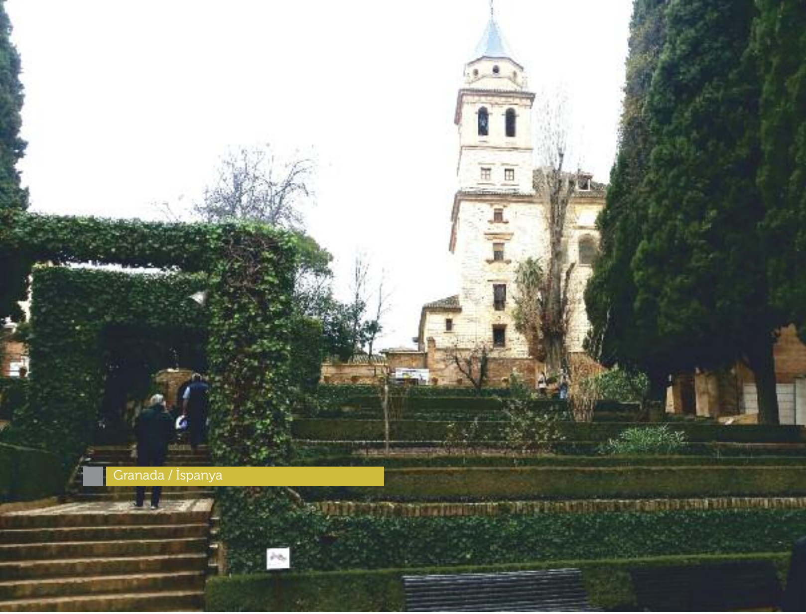
Granada / İspanya