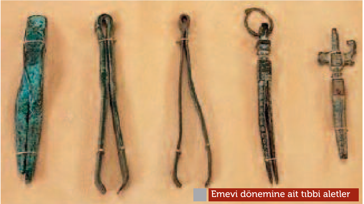
Emevi dönemine ait tıbbi aletler

Cüzzamlı ve uyuz hastaların tedavi edilmeye çalışıldığı düşüncesi de bu düşüncüyü kuvvetlendiren bir husustur. 48 Edessa'daki tıp okulunun kökenleri Babilonya, Pagan ve Heretik kültüre dayanmakla birlikte özellikle Edessalı bilginlerin çalışmaları Grek filozof ve teologların çalışmalarıyla, tıp yazmalarına dayanmaktadır. Edessa Tıp Okulu Hipokrat ve Galen modeli tıp eğitimi yapılanmasını esas aldılar. Aslında 313 yılında Roma İmparatoru Konstantin, Hristiyan mezheplere halk hastaneleri kurulma özgürlüğü tanıdı. Bu anlamda antik hastaneler arasında yer alan Edessa Cüzzam Hastanesi, St. Efraim tarafından kuruldu. 49 Edessa Okulu Grek tıbbının değişmez ve IV. yüzyıl dünyasında rakipsiz geleneklerini eğitimini yapmakla ön plana çıkmıştır. IV. yüzyılın ilk dönemlerinde kentte başlayan Hristiyan teolojisinin eğitimi tıp eğitimini ikinci plana atmıştır. Fakat buna rağmen Tıp ile ilgili çalışmaların artmasında iki faktör etkili olmuştur.