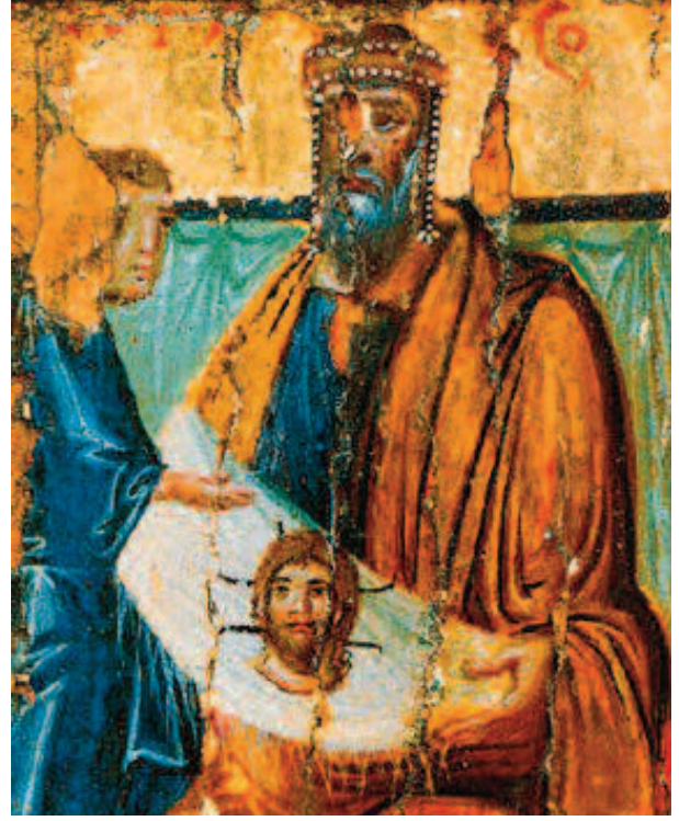
Azize Katerien Manastır'ında bulunan Osrohoene Kralı V. Abgar'a Hz. İsa'nın mendil göndermesini tasvir eden bir resim.

K uzeydoğu Suriye'den gelen yol üzerindeki Edessa (Urfa) şehri, tarih öncesi ve sonrasında jeopolitik konum açısından kayda değer bir yerleşimdir. Kentin hinterlandında; Neolitik yerleşim merkezlerinin yanında, Pagan kültürü, Sabîlik, Hristiyanlık, İslam kültür ve medeniyetine ait ilim adamlarının önemli etkileri söz konusudur. Bu nedenle kent, Yakındoğu medeniyet tarihinde müstesna bir öneme sahiptir. Şehir, antik dünya medeniyetinin mühim bir ocağı 1 olarak da kabul edilmektedir. Urfa kent merkezindeki Balıklıgöl civarındaki buluntular, Göbekli Tepe, Karahan Tepe gibi Neolitik merkezlerdeki buluntular, kentin prehistorik dönemine ait kültür dokusu hakkında önemli ipuçları vermektedir. Bu buluntular incelendiğinde, kentin 12 bin yıl öncesinde de hatırı sayılır bir kültür altyapısı olduğu anlaşılmaktadır. Bu nedenle, kentin kültürel yapısını Büyük İskender ve Hristiyanlaşmış kitlelerin oluşturmuş olduğu faaliyetlerle başlatmak bilimsellikten uzaktır.