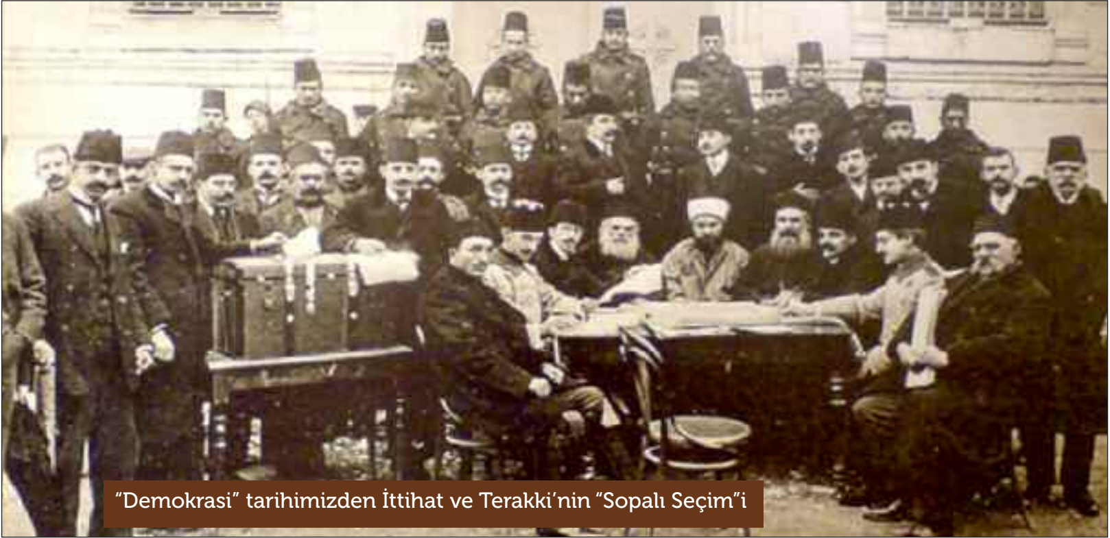
"Demokrasi" tarihimizden İttihat ve Terakki'nin "Sopalı Seçim"i

İstanbul meb'usu ve Hariciye Nazırı Rıfat Paşa Londra Büyükelçiliğine atanınca ortaya çıkan boş üyelik için Aralık 1911'de yapılan ara seçimi; Hürriyet ve İtilafın adayı Tunuslu Hayreddin'in tanınmamış genç bir gazeteci olan oğlu Tunuslu Tahir Hayreddin Bey, İttihat