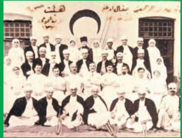
Çanakkale'de tamamı şehit düşen tıp öğrencileri. (1915)

Tıbbiyede eğitim dilinin Türkçe olması için büyük gayretler olmuş, eğitim dilinin Fransızca olması nedeniyle öğrencilerin zor mezun oldukları sıklıkla dile getirilmiştir. Eğitim dilinin Türkçe olmasıyla birlikte ülkedeki doktor sıkıntısının giderilebileceği düşüncesi güç kazanmaya başlamıştır.