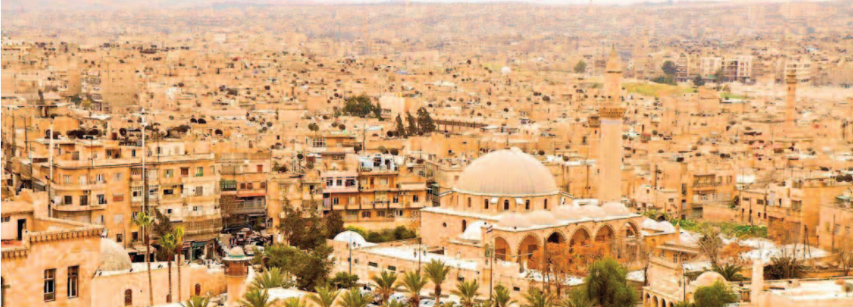
Halep’ten bir görünüm.

Sonuç olarak Urfa Belediye Tabipliği’nde ülkenin birçok yöresinde yaşanan maaşların ödenememesi, görevde gidilmemesi gibi sorunlar yaşanmamıştır. Bununla birlikte tabip maaşlarının yetersizliği konusu burada da sorun olmuştur. Bu sorunlar sadece Osmanlı Devleti’ne de ait değildir. Bu sorunlar o günlerden bugünlere kadar birçok kez yaşanmış, bu durum yazışmalarda dahi pek çok defa dile getirilmiştir.