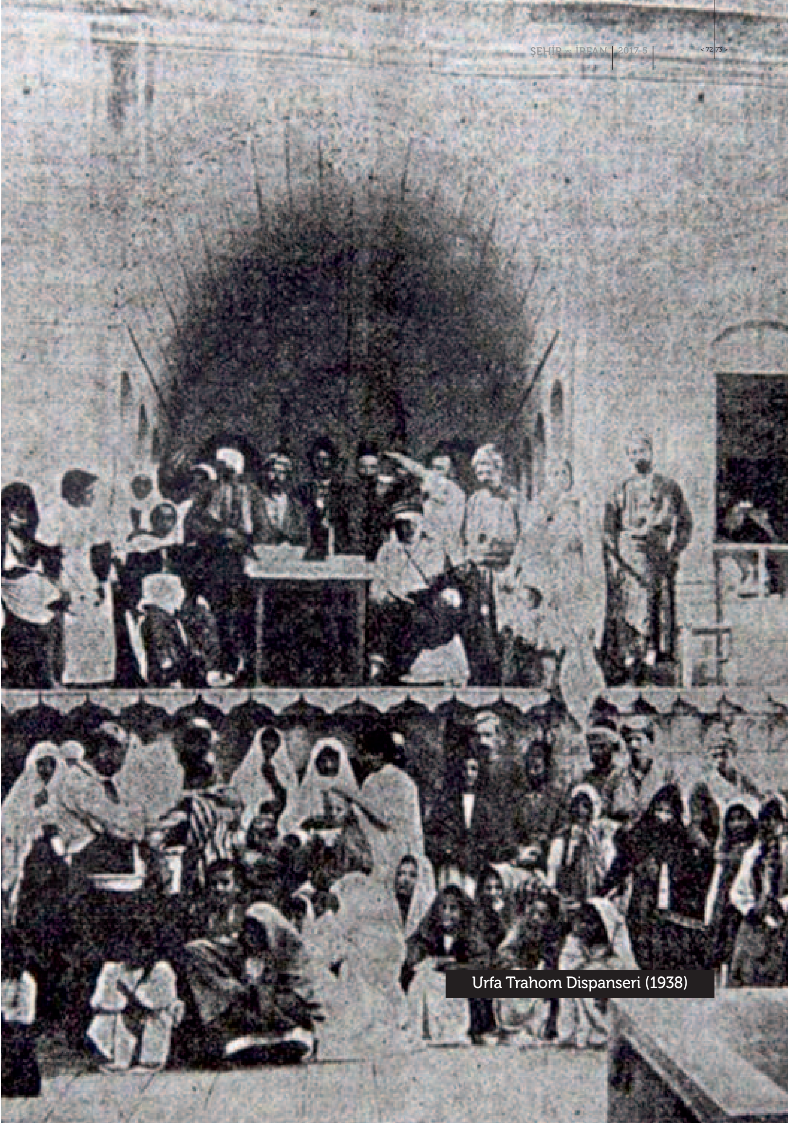
Urfa Trahom Dispanseri (1938)