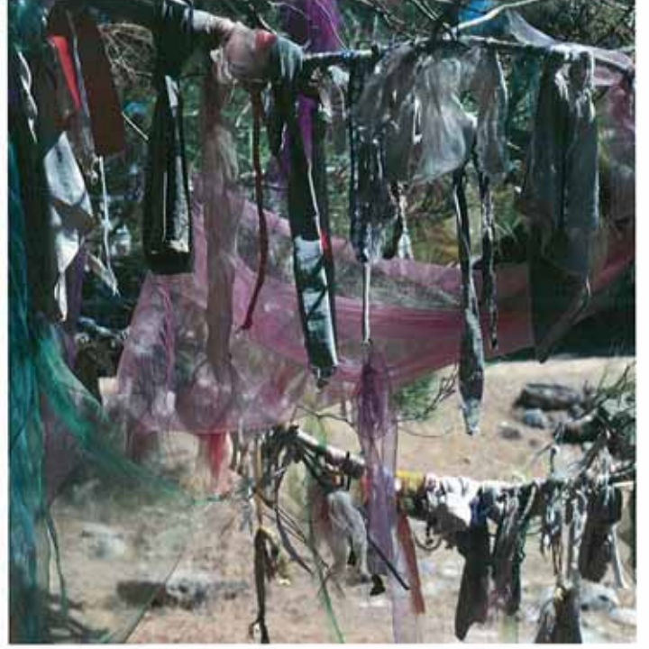
res. 10: Yörede Şamanist inanç izlerine sık rastlanır. Ayvacık'ta "Tekke Dedesi Koruluğu" günümüzde de kutsallığını ve önemini korumaktadır.