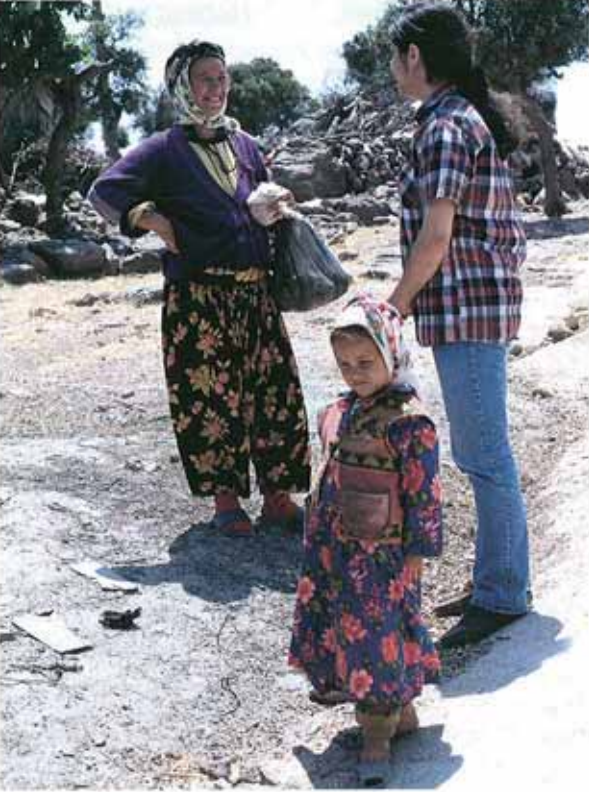
res. 11: 1982 yılından beri geleneksel sanatlara ve halı dokumacılığına yönelik, önlisans düzeyinde halı desinatörlüğü eğitimi veren Çanakkale Onsekiz Mart Üniversitesi, Ayvacık Meslek Yüksekokulu, el dokumacılığının gelişimi ve devamı için bilimsel veriler toplamakta ve belgelenmeler yapmaktadır. Resim Çanakkale İli, Ayvacık İlçesi, Çamkalabak Köyü, Merkez Mahallesi'ne yapılan ziyareti göstermektedir.