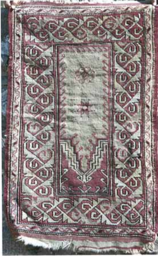
res. 1: Çanakkale Deniz Müzesi, Çimenlik Kalesi, Fatih Camisi halıları arasında bulunan Avunya tipi halı örneği. Boyutlar: 77x126 cm. (Bkz. Desen 1), Dia: Öğr. Gör. Eşref Bülent.