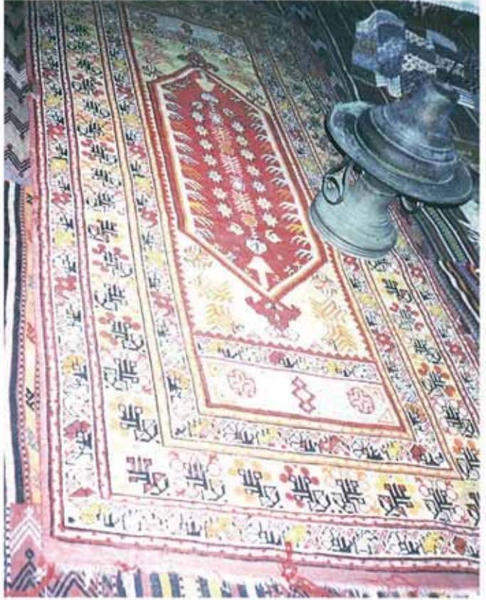
res. 6: Çanakkale İli, Bayramiç İlçesi, Hadımoğlu Konağı'nda sergilenen halı ve el dokumaları arasında; Avunya tipi halı örnekleri bulunmaktadır.