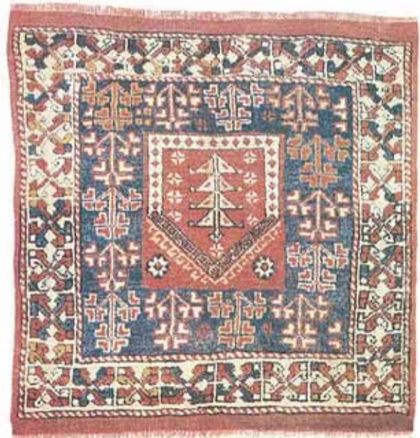
res. 4: Halı konusunda yurt dışı yayınlarda "Avunya" tipi halılardan bahsedilmektedir. Resim "Le Tapis Turc" adlı halı kitabında 1900 yılına tarihlendirilen Avunya halısını göstermektedir.