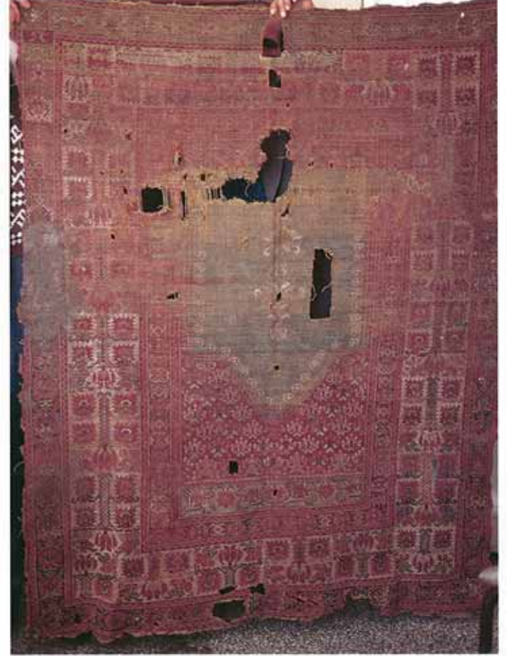
res. 12: Ayvacık İlçesi müftülüğünde bulunan halılardan biri. Ayvacık ilçesi müftülüğünde 1960 yılından beri korunan, Ayvacık İlçesi Adatepe köyünden getirildiği bilinen iki halı namazlık, araştırmamızı konu olan Avunya tipi örneklerdendir.