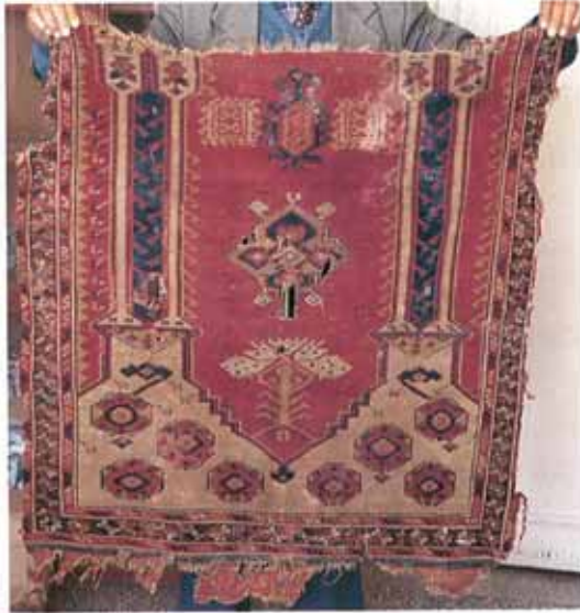
res. 3: Çanakkale İli, Ayvacık İlçesi Müftülüğü'nde 1960 yılından beri korunan, Ayvacık İlçesi, Adatepe Köyü'nden getirildiği bilinen iki halı namazla, araştırmamıza konu olan Avunya tipi halı örneklerindedir. Resim bu halılardan birini göstermektedir.