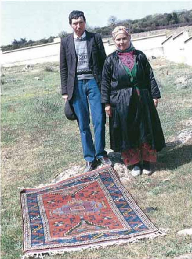
res. 7: Yöredeki köylerde dokunan halılar, Cuma günleri kurulan Ayvacık Pazarı'nda sergilenerek satılır.