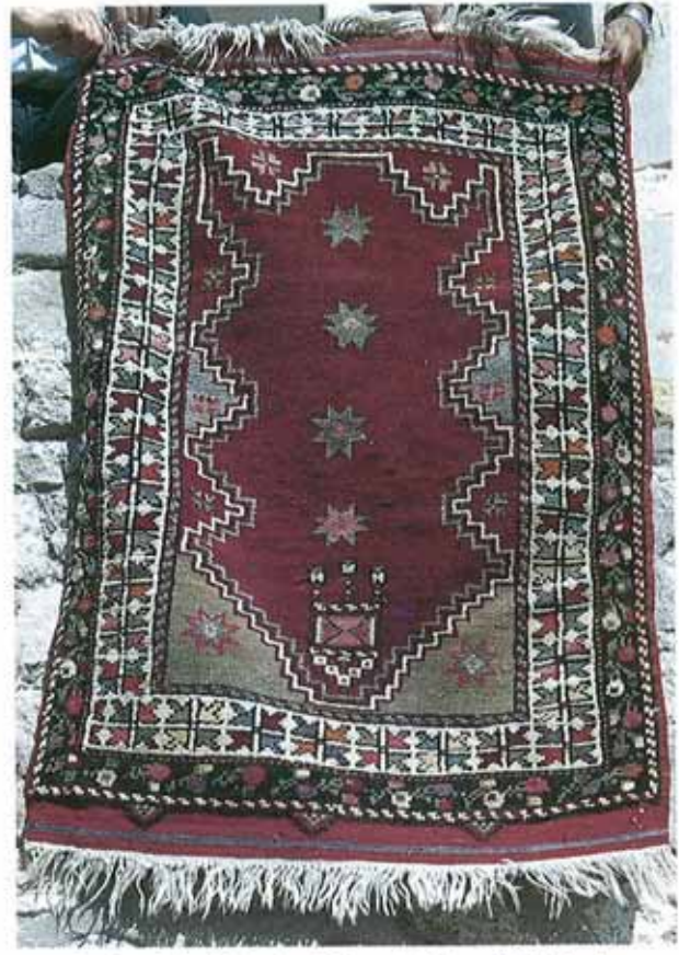
res. 2: Çanakkale Deniz Müzesi, Çimenlik Kalesi, Fatih Camisi halıları arasında bulunan Avunya tipi halı örneği. Boyutlar: 91x133 cm. Dia: Öğr. Gör. Eşref Bülent