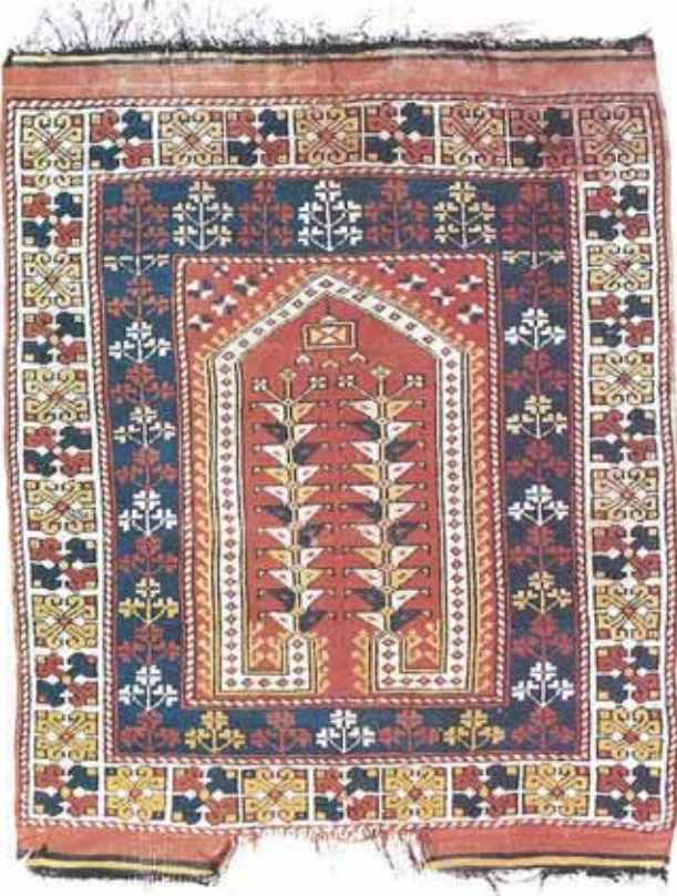
res. 5: Konya Müzesi'nde bulunan XIX. yy.'a tarihlendirilen Çanakkale halısı, Avunya Halı Grubu özelliklerindedir. Boyutlar: 110x120 cm.