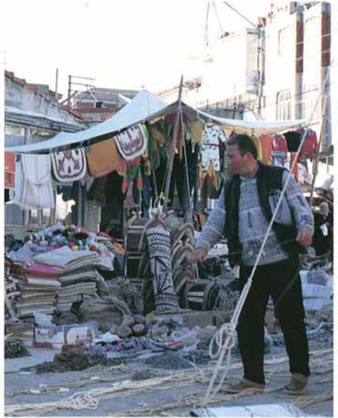
res. 8: Ayvacık Pazarı ve her yıl 26-31 Mayıs tarihlerinde kurulan Ayvacık Panayuru, çeşitli dokuma ürünlerinin sergilenmesine ve satılmasına neden olur.