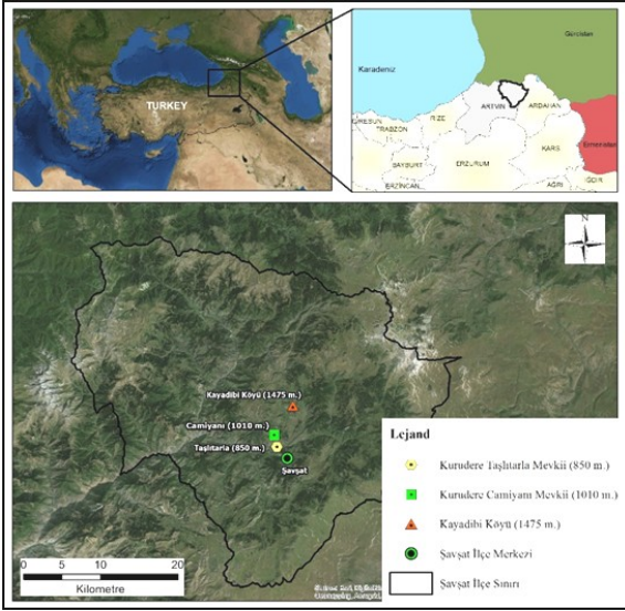
Şekil 1. Artvin ili Şavşat ilçesinde araştırmanın yürütüldüğü parsellere ait konum bilgileri

sahip olan ve aynı uygulamaların yapıldığı parseller seçilmiştir.