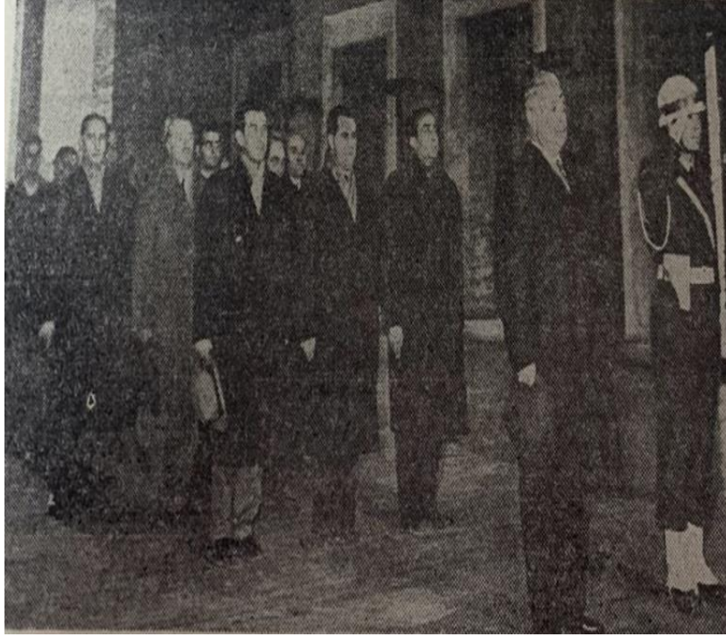
Yeni Türkiye Partisi Genel İdare Kurulu Üyeleri 20 Şubat 1961 tarihinde AnıtKabire Çelenk bırakırken