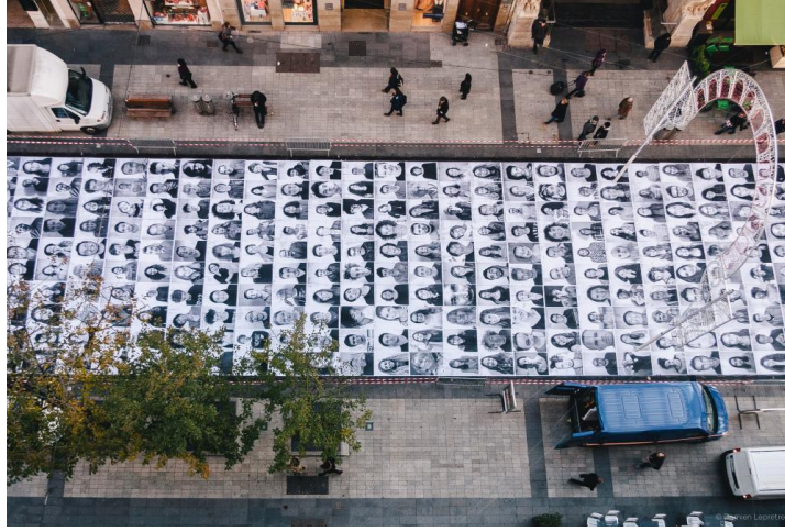
Görsel 9: JR, Inside-Out (Proje kapsamında çekilen portreler), 2013.

Selfie, günümüz sosyal iletişim ağları içerisinde kullanıcıların yoğunlukla kullandıkları ve çevrimiçi yaratılan kavramdır. Selfie kavramını Bent Fausing şu şekilde açıklamaktadır;