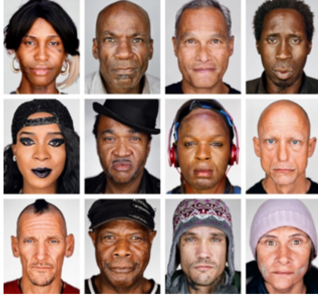
Görsel 10. Martin Schoeller, Sycamore and Romaine Campaign, 2016.

Aydınlatmanın sert yapısıyla tutarlı bir şekilde çekilen insan portreleri yüzdeki tüm kusurları açığa çıkartmakta ve karşılaştırılmaya davet edilmektedir.