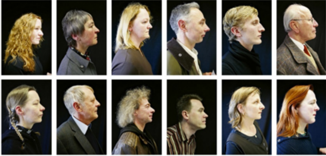
Görsel 7. Boris Mikhailov, German Portrait, 2008.

sanatçılar, sanatsal üretimdeki sınırları zorlamakta ve fotoğrafı salt çekme eyleminden farklı biçimlerde üretme eylemine dönüştürmeye çalışmaktadır. “Çağdaş sanatın, temsil krizinden sonra kültürel alana dâhil olması, sanatın sosyal bilim araştırması yöntemiyle ele alınması fotoğrafı da çekme pratiğinden çıkararak, ‘yapma’, ‘kullanma’, ‘çalışma’ ve ‘yazma’ sürecine sokmuştur” (Yavuz, 2020, s. 264-265). Bu kapsamda üretilen fotoğraflar birçok farklı konuyu içinde barındırmaktadır. İnsanın temel alındığı bu tipolojik portre çalışmaları kimlik, cinsellik, kültürel farklılık, etnisite ve farkındalık gibi konuları gündeme getirmekte ve fotoğraf içerisinde değerlendirirken yeni bağlamlar yaratabilmektedir. Çağdaş fotoğraf sanatı içerisinde portre üretimi sınır tanımaz bir şekilde değişime uğramıştır. Kendilerini ifade etme aracı olarak fotoğrafı kullanan birçok sanatçı özellikle August Sander’in tipolojik çalışmalarından esinlenerek yeni projeler üretmişlerdir. Güncel fotoğraf sanatı içerisindeki farklı eğilimlerin tipoloji fikriyle bir araya gelerek oluşturduğu fotoğrafik imgeler portre çalışmaları ile kesişmektedir. Bu çalışmanın konusu olan tipolojik portre üretimleri Boris Mikhailov, Taryn Simon, JR, Martin Schoeller ve Angelica Dass gibi sanatçıların sanatsal üretimlerinin merkezinde