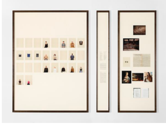
Görsel 8. Taryn Simon, A Living Man Declared Dead and Other Chapters I-XVIII (XI), 2011.

yöntemlerle paralellik göstermektedir. “Simon’un çektiği sistematik ve kategorize etmeye yönelik portre fotoğrafları hiyerarşik bir yapıdadır. Simon’un bu hassasiyeti, devlet ve devlet kurumlarınca sıklıkla kullanılan sistematik ve kategorize etmeye yönelik çalışma sistemlerinin doğurduğu hiyerarşik bilgi yapılanmasının bir çeşit taklidi” (Tatar, 2019, s. 234). Simon’un günümüzün, geçmişin ve geleceğin verilerine dair alıntılarını tipolojik portre aracılığıyla izleyiciye sunulmaktadır. Ölü İlan Edilmiş Yaşayan Adam ve Diğer Bölümler adlı proje düzen/düzensizlik, mevcudiyet/yokluk ve metin/imge arasındaki boşluklara dikkat çekmektedir.