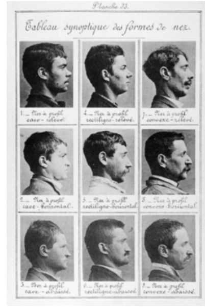
Görsel 4. Alphonse Bertillon, Synotic Table of the Forms of the Nose, 1890.

Bertillon'un sabikalıları belirlemek için bir yöntem olarak kullandığı bu çalışmanın