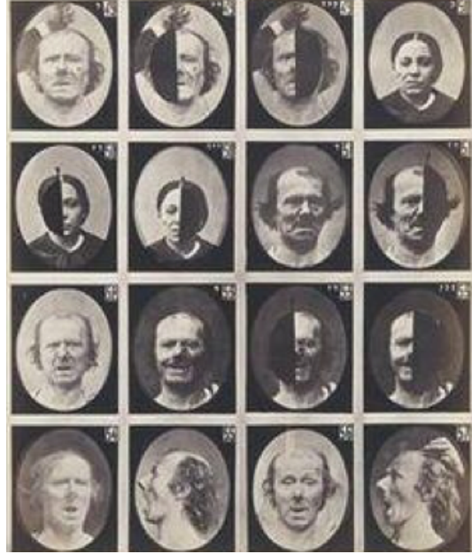
Görsel 2. Guillaume Duchenne de Boulogne, Expériences électro-physiologiques, 1865.

başladığımızda görsel tanımlamanın ne denli önemli bir konuma yerleştiği açıkça görülmektedir. Portre fotoğraflarının bireye ait kimliği yapılandırarak önemli temsiliyet aracı haline gelmesi beden üzerindeki kontrollerin sıklaşmasına neden olmuştur. “Yüz kaygısı aynı zamanda yurttaşları daha iyi denetleyebilme fırsatını kaçırmak istemeyen yetkilileri de yakından ilgilendirir” (Breton, 2018, s. 46). Nitekim fotoğrafın kimliği belirlemedeki önemli rolü Fransız polis memuru Alphonse Bertillon’un sabıkalılara ait cepheden ve profilden çekmiş olduğu vesika portreleriyle farklı alanda veri toplama ve görselleştirmenin çeşitliliğine örnek olmuştur. Bu yöntem fotoğrafı korkutucu bir denetim aracı yapmakta ve kimliğin hata yapmadan belirlenmesinde yardımcı olmaktadır. Bireyi başkalarından ayıran yüzün niteliğini temel alan bu yaklaşım sabıkalıların kimliklerini belirlemede öncü bir çalışma olmuştur. Bertillon’un isminden hareketle daha sonraları ‘bertillonage’ olarak adlandırılacak olan bu yöntem ile birlikte sabıkalının kimliği hakkında bilgiler de fotoğrafa eşlik etmiştir. Kimlik