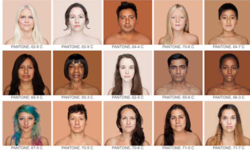
Görsel 11. Angélica Dass, Humanæ Project, 2016.

portresini Pantone 6 kodlarıyla eşleştirmekte ve ırksal olarak cilt rengini etiketlemektedir. Tarihsel açıdan bakıldığında on altıncı yüzyıldan günümüze cilt rengi kavramı kademeli olarak değişime uğramış ve aydınlanma sırasında ırksal antropolojinin gelişmesiyle birlikte ırkın önemli bir göstergesi haline gelmiştir. Dass, renk ve ırk arasındaki bu göstergeyi tüm insanlığı birleştirici bir şekilde kurgulayarak bir araya getirmiş ve küresel bir tipolojik portre projesini hayata geçirmiştir.