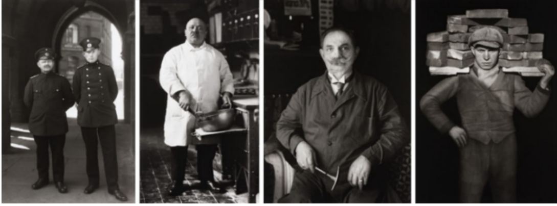
Görsel 5: August Sander, Antlitz der Zeit (Zamanın Yüzü), 1910-1929.