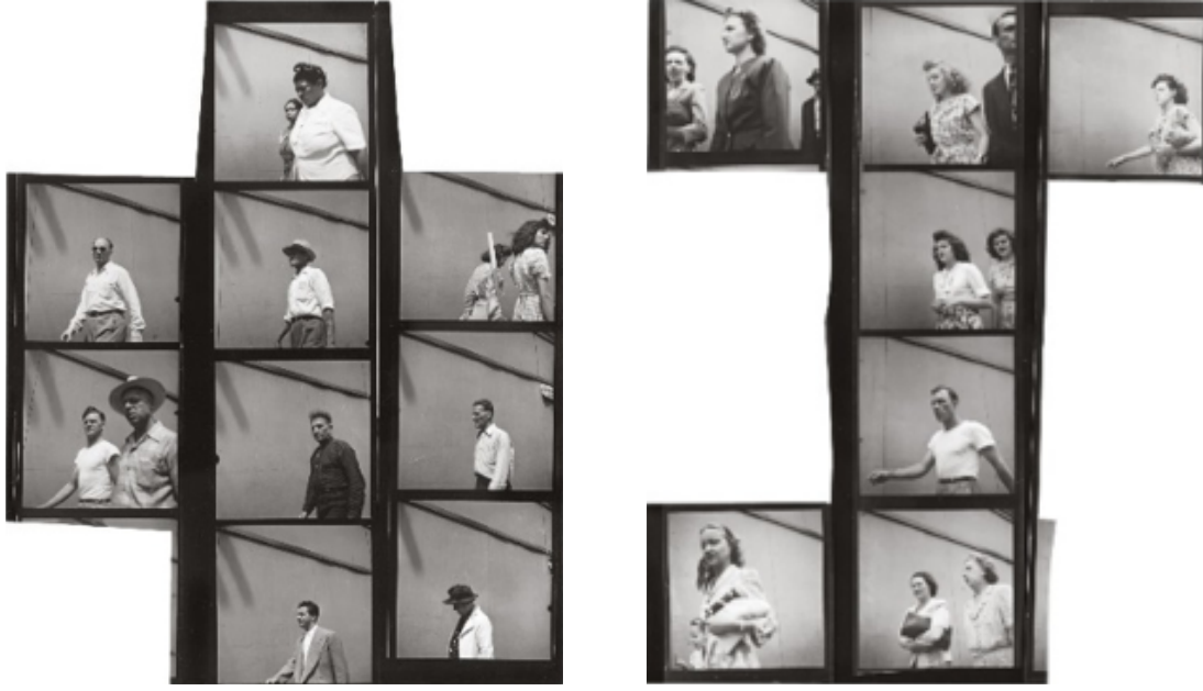
Görsel 6. Walker Evans, Untitled, Detroit, 1946.

fotoğrafçılığında belgesel fotoğraf geleneğinin öncüsü olan Evans'ın fotoğrafları eşsiz bir vizyonu yansıtmaktadır. Evans, bilgiyi tarihsel olarak sanata dönüştürme konusunda olağanüstü bir yeteneğe sahiptir. Evans 1920'li yılların sonlarından 1970'lere kadar genel anlamda yerel olarak çalışmış ve bu elli yıllık zaman dilimi içerisinde Amerika'nın görsel kataloğunu oluşturmuştur. Amerikan yaşamının özünü basit ve sıradan bir şekilde aktarmaya çalışan Evans'ın büyük buhran döneminde gerçekleştirdi çalışmaları ikonik görüntüler yaratmış ve Amerikan halkının kolektif bilincine yerleşmiştir. Evans, Amerika'nın o dönemine ait toplumsal depresyonu ve mali sıkıntılarının halk üzerindeki etkilerini görsel olarak belgelemiştir. Büyük buhran döneminde yaşanan tüm trajediyi etkili bir şekilde aydınlatan sanatçı belgesel estetikle oldukça bireysel ve samimi görüntüler üretmiştir. Evans'ın ilginç çalışmalarından birisi de hiç kuşkusuz 1938-1941 yılları arasında New York City metrosunda yolcuları gizlice çektiği portre fotoğraflarıdır ( http-6 ). Göğsüne bağladığı 35mm Contax kamera aracılığıyla yakın mesafeden