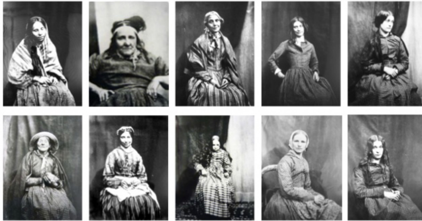
Görsel-1: Dr. Hugh Welch Diamond, Therapeutic Environments for Mental Illness, 1852.

İnsanoğluna ait görsel verilerin tipolojik örneklerinin ilk olarak psikoloji alanında görüldüğü söylenebilir. Psikiyatrist ve fotoğrafçı olan Dr. Hugh Welch Diamond (1809-1886), Surrey Country Akıl Hastanesindeki hastalarının fotoğrafik kayıtlarını tutmuş ve bu görselleri tipolojik olarak belgeleyerek ruhsal bozuklukların teşhis edilmesinde fotoğraftan yararlanmıştı. “On dokuzuncu yüzyılın ikinci yarısı, fotoğrafçılığın tıbbi amaçlarla insan bedeni araştırmalarına odaklandığı bir dönemdir” (Hacking, 2015, s. 141).