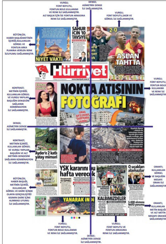
Tablo 1: Tasarım ilkelerinin kullanımı.

lendiğinde daha doğru bir anlam ve boyut edinir, çalışmada gerçekleşen karmaşıklık oluşmasını da engellemeye yardımcı olur. Aynı ve ortak dil ile kullanılan öğeler tasarımda bütünlük ilkesini de oluşturmaktadır. Bu sayede öğelerin bütünlüğü ile birlikte daha etkili bir aktarım aşaması gerçekleştirilmektedir. Bütünlüğün en başında ise gruplandırma yöntemi yer almaktadır. “Ritim ilkesi de bütünlük kavramıyla oldukça ilgilidir. Ritim oluşturulurken birbirine benzeyen tasarım öğeleri, bir bütünlük yaratmak için yinelenirler. Bu tasarım öğeleri kendi aralarında oluşturdukları düzenle devam ederken, meydana getirdikleri doku da bütünlüğü oluşturmaktadır (İncearık, 2011, s. 19-24). Tekrarlanan ve yinelenen ritimlerin katkısıyla tasarımda bütünlük oluşumundan da söz edilmektedir. Tasarım öğelerinin hem kompozisyon içindeki hemde diğer tüm öğeler ile arasındaki bütünlüğü önemli noktada ortaya çıkarmaya yardımcı olmaktadır. Tüm bu unsurları aşağıdaki gazete üzerinde vurgulamak anlatımların somuta dökülmesi açısından yararlı olacaktır.