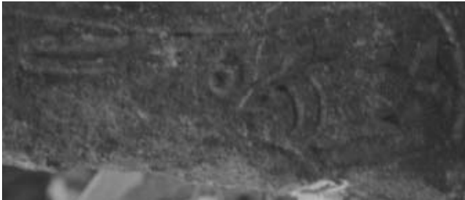
Resim 4: Balık figüründen detay.