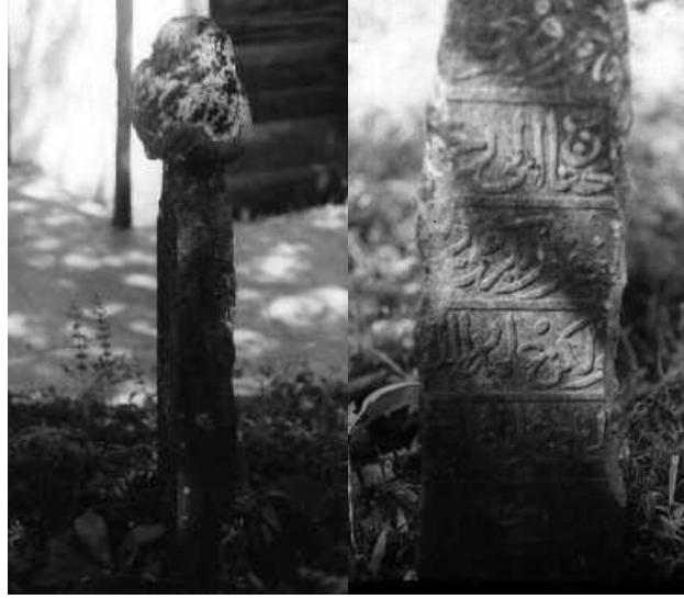
Resim 2,3: Mezar taşının görünümü.

Şahide yüzeyine 6 satırlık sülüs hatla işlenmiş kitabe, yatay ve biraz kalın çizgilerle birbirinden ayrılmıştır. Şahide kenarları kırık olduğu için bu kısımdaki yazıları tamamen okunamayan kitabe şöyledir: