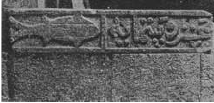
Resim 1: İnce Minareli Medrese Müzesi'ndeki balık figürü (Öney'den)

Anadolu'da Selçuklu eserlerinde balık figürüne az da olsa rastlanmaktadır. Konya İnce Minareli Medrese Müzesi'nde kayıtlı bir taşta balık figürleri kabartma olarak işlenmiştir. Bu taşların Konya Kalesi'nin Lârende Kapısı'ndan getirildikleri bilinmektedir. Buradaki figürler, kalın çizgilerle konturlanmış yüzeye Selçuklu tasvir karakterine uygun biçimde, oldukça stilize olarak işlenmiştir 11 .