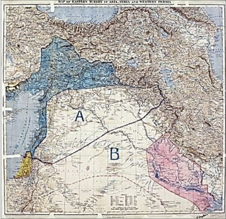
Ek. 1. Harita Üzerinde Sykes Picot Anlaşması 156