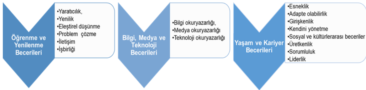
Şekil 1. P21-21. Yüzyıl Becerileri Çerçevesi

P21 Çerçevesinde, bu becerilerin belirlenmesinin yeterli olmadığı; öğrenme-öğretme sürecinin tüm bileşenleri ile harmanlanması gerektiği önemle vurgulanmaktadır. Bu doğrultuda 'Destek Sistemi' olarak çerçeveye Standartlar ve Değerlendirme, Program ve Öğretim, Mesleki Gelişim ve Öğrenme Ortamları dahil edilerek 21. yüzyıl becerilerinin bütüncül şekilde uygulamaya yansıtılmasını destekleyen 21. Yüzyıl Öğrenme Çerçevesi ortaya konulmuştur (P21, 2009). P21'in eğitim sisteminin tüm kademe ve süreçlerinde 21. yüzyıl becerilerinin entegrasyonu ve sürdürülebilirliğini destekleyen