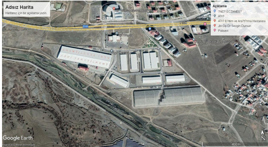
Görsel 11. Ağrı Tekstil Kent

kolunu oluşturan Taşlıçay yatağı ıslah edilmeyip akarsu yatağına yakın yerlere konutların inşa edilmesi sonucunda 5 Mayıs 2011 yılında Taşlıçay taşmış (URL 3) ve ekonomik zararlar doğurmuştur.