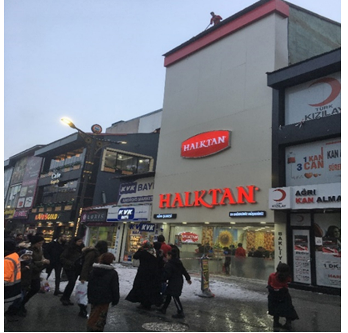
Görsel 7. Cumhuriyet Caddesi'nde yapılan çatı temizliği

Ancak nüfus yoğunluğunun yüksek olduğu kentte rekreatif faaliyetler ve sosyal ticaret alanlarının oluşturulmadığı ifade edilebilir. Ayrıca 11 bin 500 öğrenciye sahip Ağrı İbrahim Çeçen Üniversitesi'ne yönelik kütüphane, kırtasiye, konaklama için lojman vb. yapıların ihtiyacı karşılamayacak düzeyde, kent genelinde 1 halk kütüphanesi ve 6 kırtasiyeye karşılık tüketim merkezlerinden olan kafeterya sayısının 69, kahve-çay ocağının 166, oyun salonlarının 11 ve internet kafelerin sayısının ise 32 olduğu Çevre ve Şehircilik İl Müdürlüğü, Belediye, Esnaf ve Sanatkarlar Odası ile İl