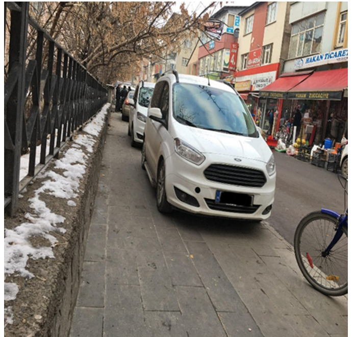
Görsel 8. Kent genelinde yoğun olarak görülen kaldırım işgalleri

Ancak nüfus yoğunluğunun yüksek olduğu kentte rekreatif faaliyetler ve sosyal ticaret alanlarının oluşturulmadığı ifade edilebilir. Ayrıca 11 bin 500 öğrenciye sahip Ağrı İbrahim Çeçen Üniversitesi'ne yönelik kütüphane, kırtasiye, konaklama için lojman vb. yapıların ihtiyacı karşılamayacak düzeyde, kent genelinde 1 halk kütüphanesi ve 6 kırtasiyeye karşılık tüketim merkezlerinden olan kafeterya sayısının 69, kahve-çay ocağının 166, oyun salonlarının 11 ve internet kafelerin sayısının ise 32 olduğu Çevre ve Şehircilik İl Müdürlüğü, Belediye, Esnaf ve Sanatkarlar Odası ile İl