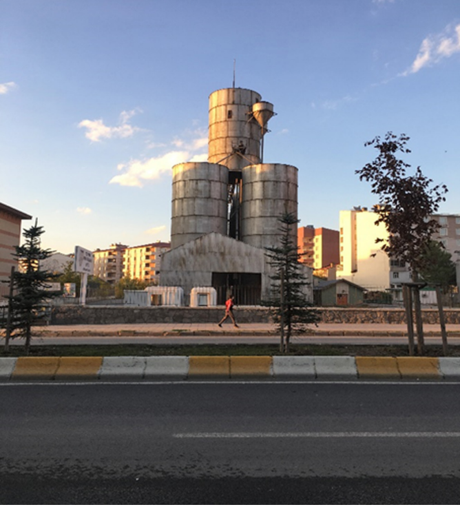
Görsel 5. TMO'ya ait kent içindeki ambarlar

Ovasına kurulan kentin iklim şartlarının uygun olduğu dönemlerde bisiklet ulaşımı için elverişli olduğu ancak kentte bisiklet yollarının olmadığı tespit edilmiştir. Ayrıca kent genelinde kaldırım işgallerin yoğun olduğu buna bağlı olarak cezai yaptırımların da uygulanmadığı gözlenmiştir (Görsel 8).