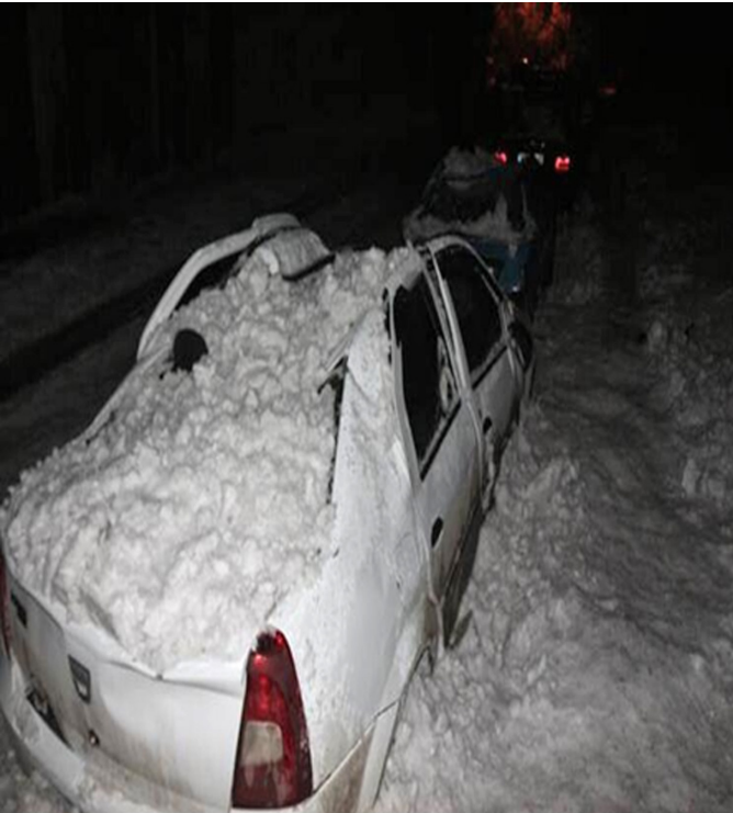
Görsel 6. Çatıdan düşen kârların neden olduğu kazalar (URL 2)

Ovasına kurulan kentin iklim şartlarının uygun olduğu dönemlerde bisiklet ulaşımı için elverişli olduğu ancak kentte bisiklet yollarının olmadığı tespit edilmiştir. Ayrıca kent genelinde kaldırım işgallerin yoğun olduğu buna bağlı olarak cezai yaptırımların da uygulanmadığı gözlenmiştir (Görsel 8).