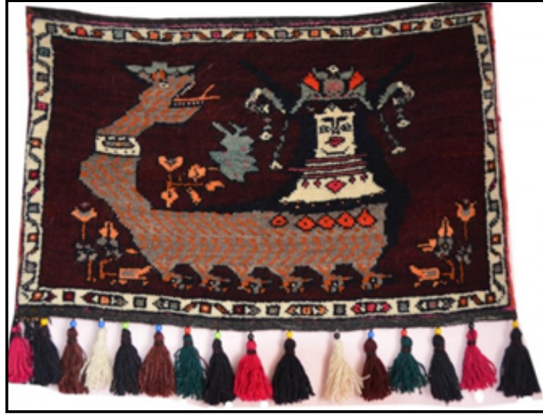
Resim 22. Şahmeran Figürlü Duvar Halısı, 50 x 85 cm., (Doğan Köy- Çemişgezek, Tunceli) (Güzel ve Kulaz, 2016:1329)

Resim 22’de Tunceli yöresine ait olan, 50x85 cm ebatlarındaki duvar halısında, bordo zemini üzerine Şahmeran figürü görülmektedir. Aralarda kalan boşluk alanlar ise koçboynuzu ve gül motifleri ile süslenmiştir (Güzel ve Kulaz, 2016:1328).