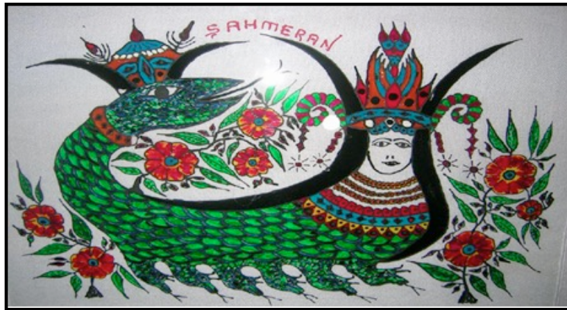
Resim 15. Cam Altı Şahmeran Resmi (Ortak, 2010: 56)

Şahmeran, cam altı resimlerinde süslü tacı, değişik aksesuarları, çiçek motifleri ve ejder kuyruğuyla çok renkli çizilebilmektedir (Ortak, 2010: 31). Bugün Türkiye'de neredeyse tamamen kaybolmuş olan cam altı sanatına değinmek gerekirse; cam altı resim, cam levhanın arka yüzüne toz boyalar, sulu boya, guaj boya, yağlı boya hatta akrilik boyalarla çalışılan soğuk resim tekniğidir. Camın hem resmin yapıldığı yüzey olma hem de vernik gibi boyaları, dış etkenlerden koruma ve aynı zamanda da renklere şeffaflık ve parlaklık verme gibi çeşitli fonksiyonları vardır. Cam altı resimleri genellikle 2-3 mm kalınlığındaki cam levhalara yapılmaktadır. Görünüşte kâğıt ya da tuval üzerine yapılmış resimlere benzese de çalışma yöntemi tam tersidir. Bir resimde detaylar, imza ve tarih son safhada oluşurken cam üzerine çalışmada, önce resmin deseni ve üstte görünen detaylarla imzadan başlamak gerekir. Daha sonra çizgiler arasındaki yüzeyler, en son olarak da fonda görülen renkler boyanır (Mant, 1998: 40).