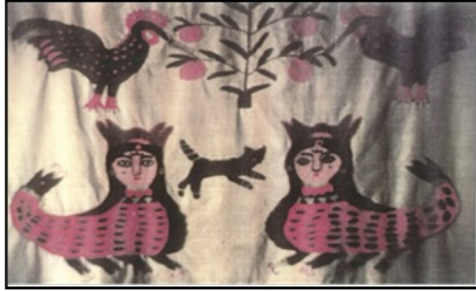
Resim 26. Şahmeran İşleme Örneği (Mant, 1998: 39)

kırmızı, turuncu ve yeşil renkli ipliklerle Şahmeran figürü uygulanmıştır. İşlemede Şahmeran'ın boynuzları, küpeleri, gerdanlığı, tacı, taçlı yılanbaşı kuyruğu ve altı adet yılanbaşından oluşan ayakları ile tasvir edildiği görülmektedir. Bu işleme örneğinde birçok örnekten farklı olarak Şahmeran'ın çevresine başka herhangi bir canlı veya nesnenin eklenmediği dikkat çekmektedir.