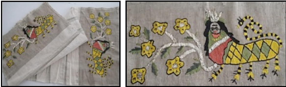
Resim 27-28. Peşkir "El Peşkiri/El Havlusu" Genel ve Detay Görüntü, Huriye Harputlu, Karatay/Konya (Çelebilik ve Afşar, 2016: 374)

Resim 26'da Gaziantep'in Oğuzeli ilçesi Kovanlı köyüne ait Şahmeran işleme örneği görülmektedir (Mant, 1998: 39). Beyaz kumaş üzerine çeşitli işleme teknikleriyle, siyah ve pembe ipliklerle iki adet Şahmeran figürü uygulanmıştır. Bu işleme örneğinde Şahmeran, boynuzları, dört adet ayağı ve balık kuyruğu şeklindeki kuyruğu ile tasvir edilmiştir. Bilinen Şahmeran figürünün aksine, örnekteki her iki Şahmeran figürünün de kuyruğunun balık kuyruğu şeklinde olduğu dikkat çekmektedir. Şahmeran figürlerinin ortasında bir adet kedi figürü, üst kısmında ise iki adet horoz figürü yer almaktadır. Horoz figürlerinin ortasına ise elma ağacı motifi yerleştirilmiştir.