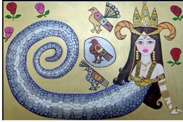
Resim 13. Ressam Zuhal Neccar'a Ait Tablo (Zuhal Neccar) (URL4)

Günümüz sanatçılarından ressam Zuhal Neccar tarafından 2014 yılında yapılan Şahmeran konulu tablo resim 11'de görülmektedir. Tablo, tual üzerine akrilik imzalı, 100x150cm. boyutlarındadır (URL4). Çok sayıda Şahmeran tablosu yapan Neccar, konuyu biçim ve teknik anlamında farklı bir boyutla ele almıştır. Eserin büyük bir bölümüne hâkim olan lokal renk hakimiyetine karşılık, Şahmeran figürüne yüklediği zengin renk ve bezeme ile başarılı bir uyum elde etmiştir. Sıcak ve soğuk renk uyumunun bu denli başarılı bir şekilde kullanımı eseri etkili kılan bir diğer unsurdur. Eserde oturur vaziyette kadın figürü olarak tasvir edilen Şahmeran, boynuzu, süslü tacı, yılan kuyruğu, küpeleri, kolyesi ve uzun siyah saçlarıyla dikkat çekici niteliktedir. Birçok Şahmeran eserinden farklı olarak Şahmeran'ın kuyruğunda yılanbaşının olmadığı görülmektedir. Ayrıca Şahmeran'ın çevresine yerleştirilen kuş ve gül resimleriyle eser zenginleştirilmiştir (Resim 13).