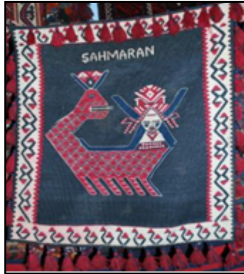
Resim 18. Şahmeran Motifli Kilim Örneği, Van- Merkez (81x81 cm.) (Güzel ve Oskay, 2013: 566)

Şahmeran'ın yaygın betimlemesi dışında etnografik malzeme olarak değerlendirilebilecek başka betimlemeleri de bulunmaktadır. Bunlar çoğunlukla kumaş üzerine işlenmiş, bohça ve perde süslemeleridir (Yıldıran, 2001: 19). Bunların dışında Şahmeran simgesinin, karyola eteği, yatak örtüleri, beşik örtüleri, kırlentlere ve bakır eşyalara işlendiği, halı ve kilimlere dokunduğu, kumaş üzerine boya ile çizildiği görülmektedir.