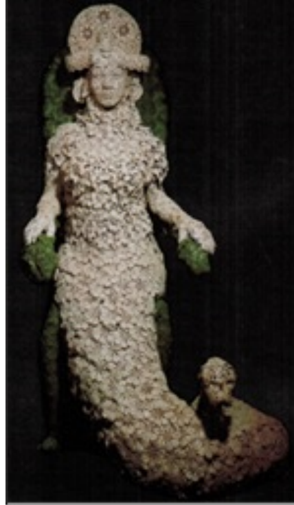
Resim 2. "Şahmaran" Adlı Heykel (Ozan Oganer) (Doğanay, 2012: 60)

Mersin'in Tarsus ilçesinin meydanlarından birini süsleyen Şahmeran heykeli 1986 yılında Emine Berika İpek Bayrak tarafından yapılmıştır (Varlık, 2014: 42). Birçok eserde kadın olarak karşımıza çıkan Şahmeran bu heykelle erkek olarak tasvir edilmiştir. Taçsız yapılan ve dalgalı saçlarıyla dikkat çeken heykelin çevresinde 12 adet yılanın yer aldığı görülmektedir (Resim 1).