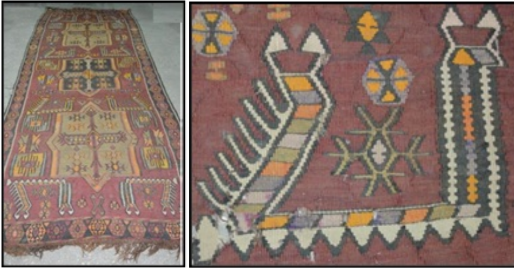
Resim 20-21. Şahmeran Figürlü Kilim (147x392 cm.) (Müzeye Geliş Tarihi: 1984)

Resim 19’da Van yöresine ait olan Şahmeran motifli kilim, 1,8x 59 cm. boyutlarında, duvara asılmak için kullanılmaktadır (Güzel ve Oskay, 2013: 566). Kilimin iç zemininde üst üste yerleştirilmiş 2 adet Şahmeran motifi yer almaktadır.