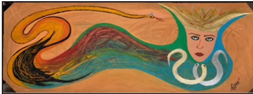
Resim 12. "İhanetin Ardından Şahmeran" Adlı Tablo

Çağdaş resim sanatının önemli ressamlarından Ahmet Güneştekinde eserlerinde Şahmeran'dan etkilenen sanatçılardandır. Sanatçı, "Şahmeran'ın Son Günü" adlı tablosunu 2012 yılında 150x150 cm boyutlarında tuval üzerine yağlı boya ile yapmıştır (Güneştekin, 2014: 33) (Resim 11). Bu çalışmada yüzeyi geometrik renk alanlarına bölerek konuya farklı bir bakış açısıyla yaklaşmıştır. Yüzeyde renk alanlarının oluşturduğu espas, esere farklı bir boyut katmıştır. Bu eserde Şahmeran, günümüz toplumunda halen yeri olan ve bir o kadarda arka planda kalan bir etki uyandırmaktadır.