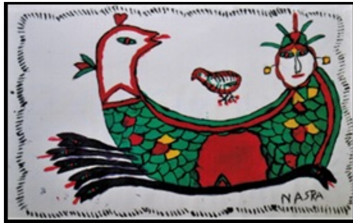
Resim 30. "Şah-ı Maran" Adlı Kumaş Üzerine Doğal Boya Çalışması (NasraŞimmes Hindi) (Doğanay, 2012: 84)

Akpınarlı ve Uluşık'ın (2016) Yerel Kalkınmada Halk Kültürü Projelerinin Önemi "Şanlıurfa Örneği" adlı bildirimlerinde yayınlamış oldukları Şanlıurfa'da bulunan Şahmeran figürlü elbise kılıfı örneği işlemlere farklı bir örnektir (Resim 29).