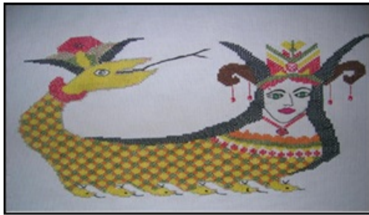
Resim 25. Şahmeran İşleme Örneği (Ortak, 2010: 32)

Şahmeran motifinin halk işlemlerinde de yoğun olarak kullanıldığı görülmektedir. Halk resminde ve işlemlerinde bitkisel bezemelerin çiçek, meyve, yaprak, ağaç çeşitlemeleriyle yenilediği XIX. yüzyılda; önceki yüzyıllarda görülen figürlü bezemenin ağırlık kazandığı Şahmeran, kuş, kelebek, at, deve gibi motiflerle zaman zaman insan figürünü de içeren düzenlemelerin süregeldiği gözlenmektedir (Mant, 1998: 38). İşlemleri yapan kişiler, motifin doğal kompozisyonuna her zaman uymamışlar, Şahmeran'ın çevresine ağaçlar, kırmızı güller, horoz ve deve gibi motifler ilave etmişlerdir.