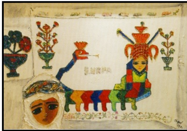
Resim 10. Ressam Fikret Otyam'a Ait Tablo (URL3)

Halk sanatını sağlam bir kaynak olarak gören Bedri Rahmi Eyüboğlu'na ait, 302x102 cm boyutlarında, tuvale marufle kâğıt üzerine suluboya ile yapılan "Şahmeran" adlı tablo Resim 9'da görülmektedir (URL2). Bedri Rahmi Eyüboğlu, çalışmalarında geleneksel süsleme ve halk sanatlarından seçtiği motifleri Batı resim teknikleriyle birleştirerek yapıtlarında kullanmıştır. "Şahmeran" adlı çalışmasında sanatçı, konuyu oldukça minimal bir üslupta ele almıştır. Renkleri olabildiğince arka plana atan sanatçı, motif ve kontur çizgilerinin ağırlık kazandığı bir yaklaşım sergilemiştir. Bu bağlamda resim gereksiz birçok ayrıntıdan da arındırılarak konunun özünü çarpıcı bir şekilde ortaya çıkarmıştır. Eserde Şahmeran, kadın figürü olarak, ayakta ve dik halde betimlenmiştir. Birçok eserde Şahmeran yarı insan yarı yılan olarak tasvir edilse de sanatçının bu çalışmasında, yılan figürünün yerini balık figürü almıştır.