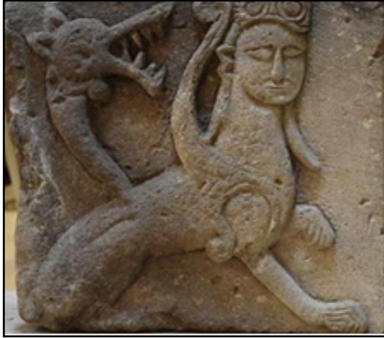
Resim 7. Şahmeran Figürü Taş Kabartma (Ani Kazısı-Mitolojik Eserler-61-1045), Kars Müze Müdürlüğü (Değirmenci, 2019: 17)

2016 yılında Kars Ani’de yapılan kazılarda ortaya çıkarılan taş üzerine kabartma yapılmış Şahmeran figürü Kars Müzesinde sergilenmektedir (Resim 7).