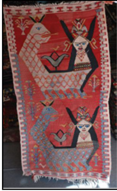
Resim 19. Şahmeran Motifli Kilim Örneği, Van- Merkez (1,8x59 cm.) (Güzel ve Oskay, 2013: 566)

Resim 19’da Van yöresine ait olan Şahmeran motifli kilim, 1,8x 59 cm. boyutlarında, duvara asılmak için kullanılmaktadır (Güzel ve Oskay, 2013: 566). Kilimin iç zemininde üst üste yerleştirilmiş 2 adet Şahmeran motifi yer almaktadır.