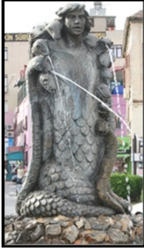
Resim 1. Tarsus Şahmeran Heykeli (Emine Berika İpek Bayrak) (URL1)

Mersin'in Tarsus ilçesinin meydanlarından birini süsleyen Şahmeran heykeli 1986 yılında Emine Berika İpek Bayrak tarafından yapılmıştır (Varlık, 2014: 42). Birçok eserde kadın olarak karşımıza çıkan Şahmeran bu heykelle erkek olarak tasvir edilmiştir. Taçsız yapılan ve dalgalı saçlarıyla dikkat çeken heykelin çevresinde 12 adet yılanın yer aldığı görülmektedir (Resim 1).