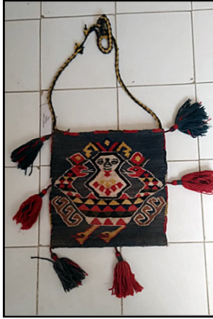
Resim 24. Balıkesir İli Edremit İlçesi Alibey Kudar Özel Etnografya Galerisi'nde Bulunan Şahmeran Motifli Dokuma Torba

Resim 24'de Balıkesir İli Edremit İlçesi Alibey Kudar Özel Etnografya Galerisi'nde bulunan Şahmeran figürlü el dokuması torba örneği görülmektedir. Torba kilim dokuma tekniği kullanılarak dokunmuştur. Dokumanın ana malzemesi yörede doğal boyalar ile boyanmış yündür. Dokumada Şahmeran figürünün iki ayağı ve iki kolu yılanbaşı şeklinde betimlenmiştir. Torbanın üç kenarı dokuma iplikleri ile yapılan püsküllerle süslenmiştir.