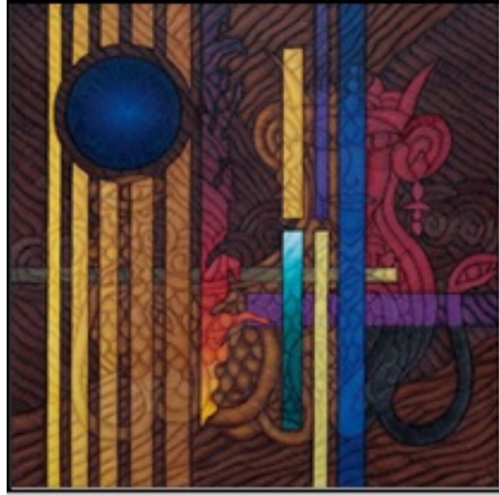
Resim 11. "Şahmeran'ın Son Günü" Adlı Tablo (Güneştekin, 2014: 33)

sağlamıştır. Eserde süsleme öğelerinin ve renklerin yoğun anlatımı dikkatleri dışı Şahmeran üzerinde toplamıştır. Tabloda Şahmeran, boynuzları, tacı, taçlı yılanbaşı kuyruğu ve sekiz adet yağı ile tasvir edilmiştir.