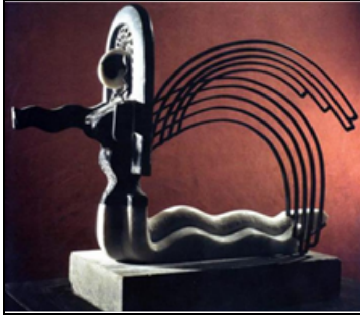
Resim 5. Mermer, Demir ve Kurşundan Yapılmış Şahmeran Heykeli (25x12x25 cm.) (Mehmet Aksoy- 1989) (Değirmenci, 2019: 40)

Heykel sanatçısı Mehmet Aksoy'un Şahmeran konulu pek çok eseri ve sergisi bulunmaktadır. Resim 5'te mermer, demir ve kurşundan yapmış olduğu Şahmeran heykeli görülmektedir.