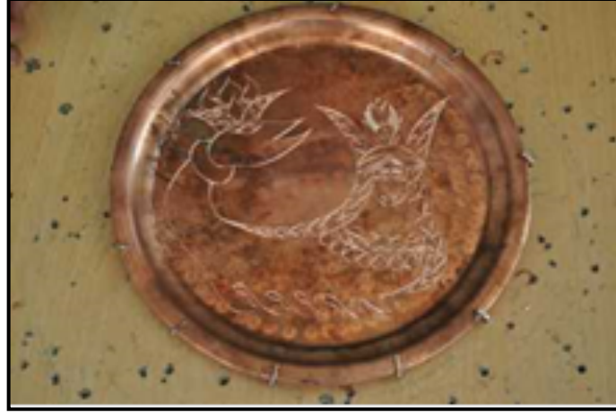
Resim 33. Şahmeran Figürlü Bakır Tepsi (Görsel Sahibi: Sercan Taşçı)(URL5)

Resim 33’de görülen bakır tepsi üzerine Şahmeran figürlü kazıma tekniği ile yapılmıştır.