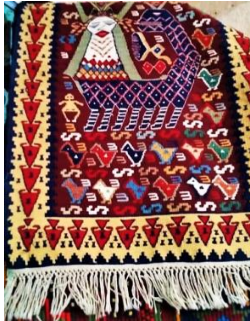
Resim 23. Şahmeran Figürlü Kilim, 106cmx160cm, Mardin (Küçük Kurt, 2019:189)

Resim 22’de Tunceli yöresine ait olan, 50x85 cm ebatlarındaki duvar halısında, bordo zemini üzerine Şahmeran figürü görülmektedir. Aralarda kalan boşluk alanlar ise koçboynuzu ve gül motifleri ile süslenmiştir (Güzel ve Kulaz, 2016:1328).