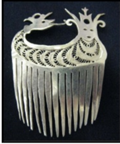
Resim 31. Şahmeran Figürlü Saç Tokası (Kamiloğlu, 2009: 176)

6x8 cm. boyutlarında, gümüş levha kullanılarak oluşturulmuş saç tokasında Şahmeran figürü ajur işi tekniğinde uygulanmıştır (Resim 31).