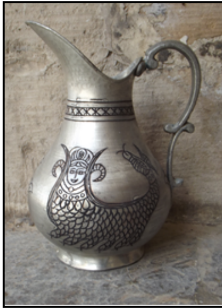
Resim 32. Şahmeran Figürlü Sürahi Örneği, Mardin-Merkez (Sultan Sökmen Arşivi, 2016)

6x8 cm. boyutlarında, gümüş levha kullanılarak oluşturulmuş saç tokasında Şahmeran figürü ajur işi tekniğinde uygulanmıştır (Resim 31).