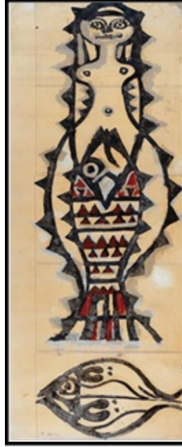
Resim 9. "Şahmeran" Adlı Tablo (Bedri Rahmi Eyüboğlu) (URL2)

figürü olarak, ayakta ve dik duran halini tasvir etmiştir. Sanatçının Şahmeran konulu üç adet tablosu bulunmaktadır (Yavuz Kılıçer, Sözlü Görüşme, 10 Mart 2015).