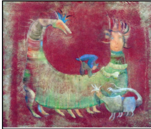
Resim 14. Kader Serisi (Can Göknil) (Yayan ve Sivri, 2017: 671)

Günümüz sanatçılarından ressam Zuhal Neccar tarafından 2014 yılında yapılan Şahmeran konulu tablo resim 11'de görülmektedir. Tablo, tual üzerine akrilik imzalı, 100x150cm. boyutlarındadır (URL4). Çok sayıda Şahmeran tablosu yapan Neccar, konuyu biçim ve teknik anlamında farklı bir boyutla ele almıştır. Eserin büyük bir bölümüne hâkim olan lokal renk hakimiyetine karşılık, Şahmeran figürüne yüklediği zengin renk ve bezeme ile başarılı bir uyum elde etmiştir. Sıcak ve soğuk renk uyumunun bu denli başarılı bir şekilde kullanımı eseri etkili kılan bir diğer unsurdur. Eserde oturur vaziyette kadın figürü olarak tasvir edilen Şahmeran, boynuzu, süslü tacı, yılan kuyruğu, küpeleri, kolyesi ve uzun siyah saçlarıyla dikkat çekici niteliktedir. Birçok Şahmeran eserinden farklı olarak Şahmeran'ın kuyruğunda yılanbaşının olmadığı görülmektedir. Ayrıca Şahmeran'ın çevresine yerleştirilen kuş ve gül resimleriyle eser zenginleştirilmiştir (Resim 13).