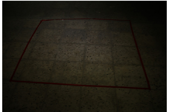
Resim 1 Fanustaki Yaşam Performans Alanı

Anket içinde yer alan diğer görüş ise “Performans sanatında cinsiyet rolleri normalleştirilmiştir” şeklinde olup yoğunlukta verilen cevap ise 138'inin (%41,3) kararsız olması şeklindedir. Bu sonuçtan yola çıkıldığında sanatçının cinsiyet rollerini sergileyip sergilemediği noktasında bir belirsizliğin olduğu ifade edilmektedir. Bunun temel sebeplerinden birisi bilinen cinsiyet davranış kalıplarının