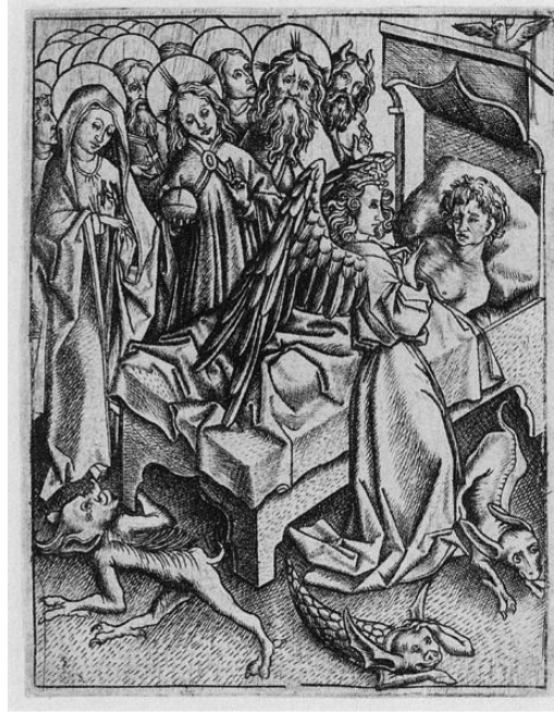
Görsel 4. Master E.S., Ermutigung im Glauben, Gravür, 92X70, 1450 dolayları (URL 12, 2020)

Memento Mori nesnelere yaklaşık bir asır sonra Hollandalı sanatçılara Vanitas adı verilen ve benzer tarzda eserler yaratma konusunda ilham vermiştir. Ölümlüğü hatırlatan objeler, umutla umutsuzluk arasındadır ve yaşamın geçici doğası hakkında güçlü bir şekilde mesaj içeren sanat eserleridir.