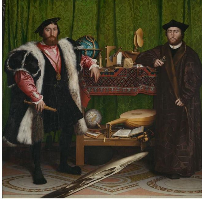
Görsel 2. Hans Holbein the Younger, Büyükelçiler, Tahta Üzerine Yağlıboya, 207*209.5, 1533, Ulusal Galeri, Londra (URL 6, 2020)

bir şekilde okumak gerekmektedir. Anamorfoz bir form olarak kullanılan kurukafa; 1500'lerde çok olağandışı bir konu değildir. Çünkü o döneme kadar zaten bolca kullanılmıştır. Resmin yapıldığı Londra'da nüfusun önemli bir bölümü çıkan veba salgınında ölmüştür. Tablodaki en önemli ölüm simgesi olan kuru kafaya karşıdan bakıldığında büyük ölçüde okunamaz. Burada bulunan anlamın gizli varlığı, basit bir imadan daha fazlasını içermektedir. Kafatası, sadece resimdeki bir sırrı ilan etmekle kalmaz aynı zamanda o sırrın nasıl çözüleceği ile ilgili bir talimat içerir. Bu da izleyicinin bakış açısının yapısal bir şekilde değiştirilmesi gerekmektedir. Resmin sırrını kavrayamama durumumuz, resim ile ilgili olarak alışkanlıklarımıza göre kendimizi konumlandırma şeklimizden kaynaklıdır. Kafatası, Memento Mori geleneği paralelinde insanın kaçınılmaz ölümünü hatırlatmakta, izleyiciyi dünyevi cazibeleri reddetmeye çağırmanın bir yolunu temsil etmektedir. Buradaki perspektif deneyi insanın vizyonunun sınırlamalarına dikkat çeker ve izleyiciyi dünyadaki yerlerini sorgulamaya zorlar. Yine de izleyici ölümden korkmamalıdır. Resmin üst köşesinde yer alan bir haç diriliş anlamına gelir. Tanrının kendisine sadık olanlara vadetmiş olduğu sonsuz yaşamı ve kurtuluşu temsil eder. Resmin kompozisyonu; sanatçının ünlü gravür serisi "the Dance of Death" in kapanış parçası olan "Ölüm Armasına Atıf" çalışmasına dikkat çekici bir şekilde benzemektedir (Kenaan, 2002; URL 5, 2018).