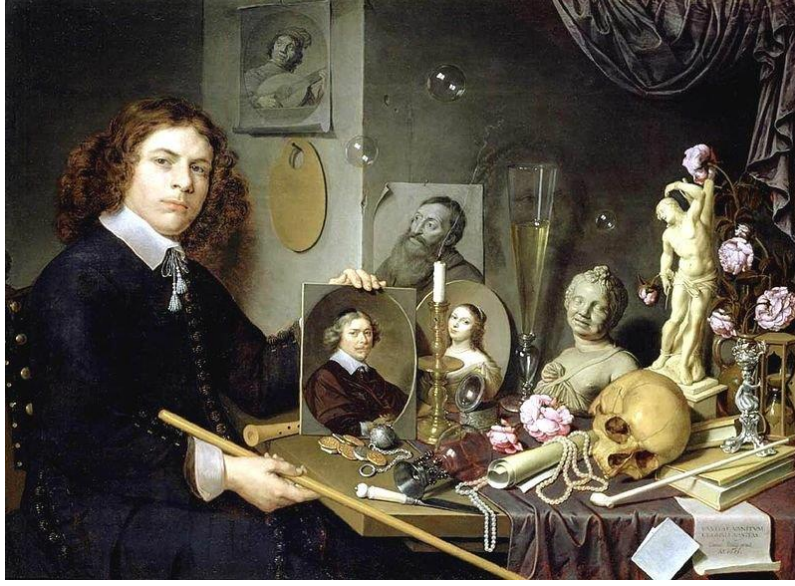
Görsel 5. David Bailly, Oto-portreli Vanitas, Ahşap Üzerine Yađlıboya, 90X122, 1651, Stedelijk Müzesi (URL 15, 2020)

aksine, Baily'nin resmindeki yanıltıcı zaman ölçeđi tüm konuya yeni bir boyut katmaktadır (URL 14, 2020).