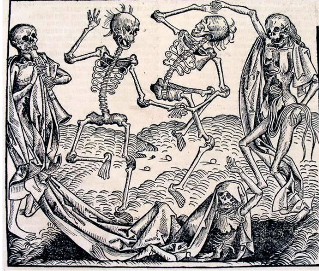
Görsel 3. Michael Wolgemut, Ölüm Dansı, Nurnberg Chronicle, 1493 (URL 8, 2020)

yařam üzerinde oynadıđı rolleri tasvir eden kırk parça gravürden oluşan bir seri yaratmıştır. Ölüm sembolleri; bu gravür serisinin üçüncüsü olan Adem ile Havva'nın cennetten kovulması sahnesinde ortaya çıkmaktadır. Beşinci gravürde ise insanların bir dizi enstrüman çalan iskeletler olarak canlandırılmıştır. Ölüm Dansı ise papa ile birlikte sonraki gravürden başlayarak 34 gravür boyunca 34 kurban ile devam etmektedir (Buchler, 2010).