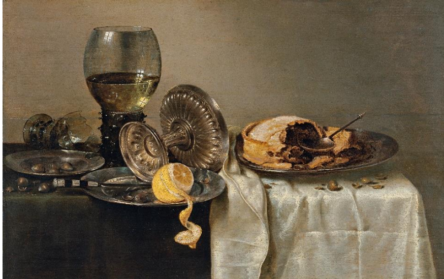
Görsel 6. Willem Claes Heda, Yiyecek ve İçecekli Natürmort, Panel Üzerine Yađlıboya, 1634, Ulusal Thyssen-Bornemisza Müzesi, Madrid (URL 17)

Willem Claes Heda'nın Yiyecek ve İçecekli Natürmort'u, (Görsel 6) hayatın kısırlığını simgeleyen, yakında çürüyecek ve kaybolacak olan yarım yenilmiş turtalar görülmektedir. Masada ayrıca bir bıçak, bir kadeh, bir cam römer kadehi ve bir saat görülmektedir. Soyulmuş limon aldatıcı bir görünüme işaret eder. Bakması güzel ancak tadı ekşidir. Limon aldatıcı görünüşlerden kaçınmayı ifade etmektedir.