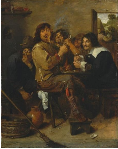
Görsel 7. Adrian Brauwer, Sigara İçen Adam, Ahşap Üzerine Yağlıboya, Metropolitan Müzesi (URL 18, 2020)