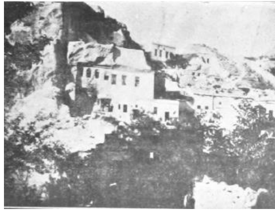
Resim 12: Ayios Yeorgios Kilisesinin Taş Örtülü Ön Cephesi (Anastasopoulos, 1914, s. 114)

1914 Nevşehir Salnamesinde kilise hakkında, yapılış tarihinin tam bilinmediği, bir kısmının kaya oyma şekilde yapıldığı, eski görünen yapının 1861 senesinde yapılan tamir sonrasında 1864 yılında Nazianzu Gervasios' a adanmıştır. Günümüzde Yeni Cami Mahallesi'nde yer alan ve halkın Hıdırellez Kilisesi olarak isimlendirdiği yapı, eski kayıtlarda geçen Ayios Yeorgios kilisesidir (Öger & Özdem, 2013, s. 99). Yapının günümüze yıkılan yığma taş cephesi Yunan kaynağındaki görselde yer almaktadır (Resim 12).