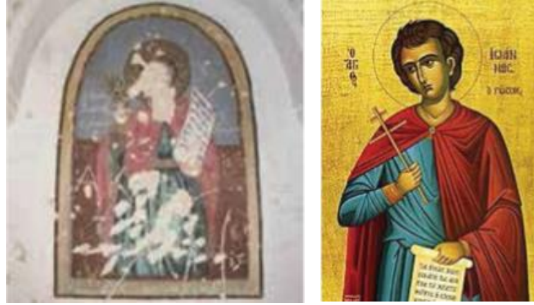
Resim 7: Mustafapaşa Aziz Basileios Kilisesi ve Osios Rus Ioannis, (Pekak, Ürgüp Kiliseleri, 2004)

Osios Ioannis'e adanan bu kilise, 1914 Nevşehir salnamesindeki kayıtlara göre, kilise inşası 1885-86 yılında çıkan bir fermanla başlamış, halkın maddi ve fiziksel yardımları ile, 3000 lira harcanarak, 1892 yılında tamamlanmıştır (Öger & Özdem, 2013, s. 98) (Resim 8).