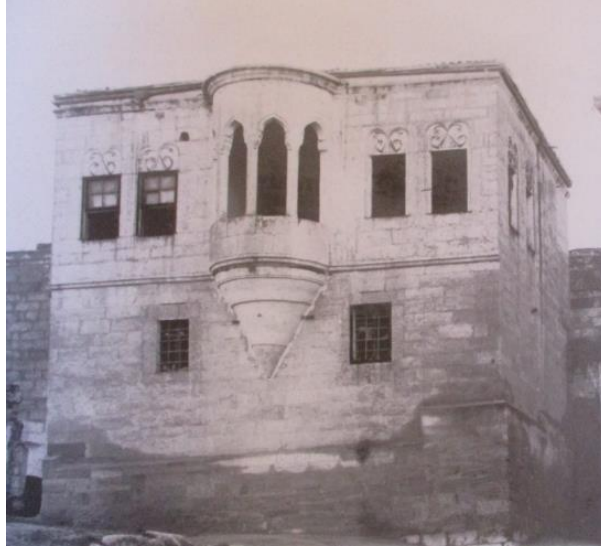
Resim 1: İhtiyar Heyeti Binası, Sinasos (Balta, 2007, s. 119)

19. yüzyılda Ürgüp yerleşiminde bulunan Mubayacı mahallesi bir Rum mahallesidir. Bu mahalleye adını veren İoakim Mubayaacıoğlu ise Ürgüp ihtiyar heyeti üyelerinden birisidir. Mubayacı mahallesinin girişinde büyük bir konağı olan İoakim'in ticaretle uğraştığı ve tefecilik yaptığı bilinmektedir (Balta, 2010, s. 82) (Resim 2).