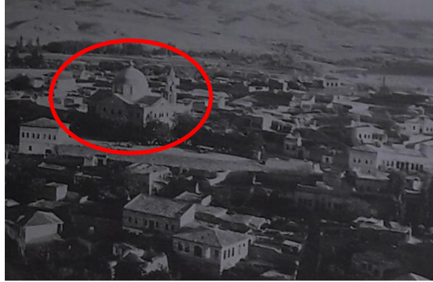
Resim 8: Duayeri Mahallesi Merkezinde, 1950'de Yıkılmadan Önce Osios Ioannis Rossos Kilisesi

Osios Ioannis'e adanan bu kilise, 1914 Nevşehir salnamesindeki kayıtlara göre, kilise inşası 1885-86 yılında çıkan bir fermanla başlamış, halkın maddi ve fiziksel yardımları ile, 3000 lira harcanarak, 1892 yılında tamamlanmıştır (Öger & Özdem, 2013, s. 98) (Resim 8).