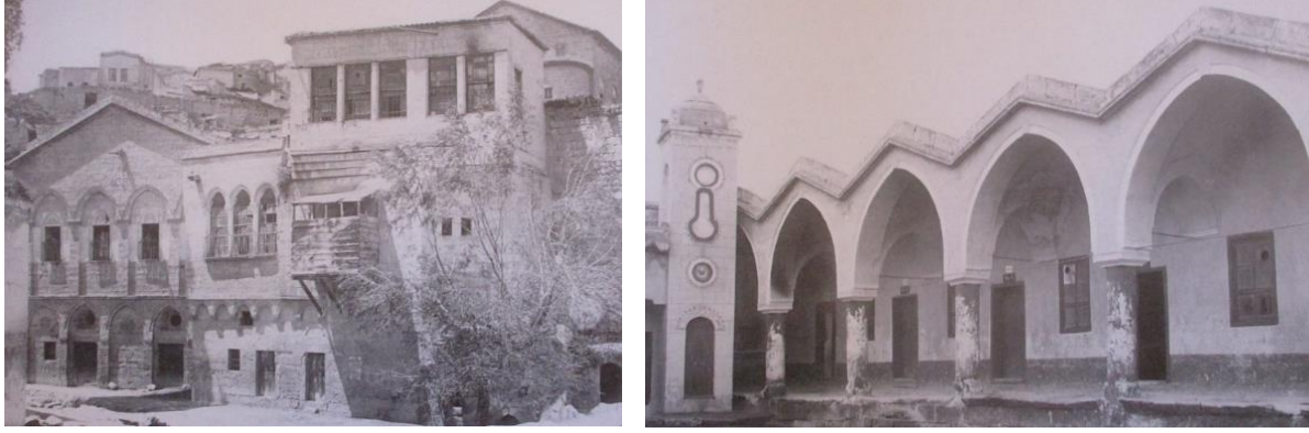
Resim 6: Sinanos'taki Kız ve Erkek Rum Okulu, (Balta, 2007, s. 105-111)

Yapıyı mimari üslubunu genel olarak incelediğimizde tamamen yerel özellikler gösterdiğini söyleyebiliriz. Bu anlamda cemaatin genellikle İstanbul yapılarında kullandığı üslupları 2 burada görmüyoruz. Bu anlamda cemaatin tüm okul yapılarında bu üslubun kullanıldığına dair bir genelleme yapmak mümkün değildir. Bu okul binasına en yakın örnek olarak Sinanos'ta yer alan cemaatin erkek ve kız okulu mimari olarak değerlendirildiğinde aynı şekilde yerel özellikler gösteren binaların inşa edildiği görülmektedir (Resim 6).