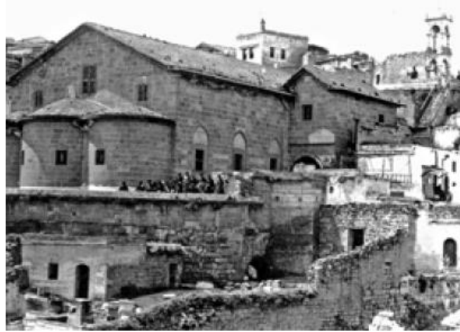
Resim 11: Taxiarchon Kilisesi, Sinasos (Balta, 2007, s. 83)

Salname kayıtlarında geçen bilgiye göre Aziz Vasilios Kilisesi'nin iç cephesinde İsus Hristo'nun çektiği cefalar resmedilmiş, fakat zamanla bu resimlerin bozulmaya uğradığı kaydedilmiştir (Öger & Özdem, 2013, s. 97).