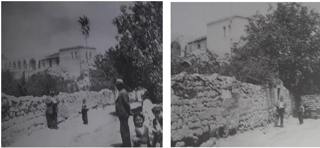
Resim 5: Aziz Vasilios Kilisesi Yıkıntıları Yanındaki Günümüze Ulaşmayan Okul Binası, (Balta, 2010, s. 103)

Ürgüp'te bulunan ve günümüzde yıkılmış olan okul binasının mimari özelliklerini incelemek gerekirse, yöresel malzeme olarak yapıda taş kullanılmıştır. Bölgenin genellikle iki katlı olan diğer yapılarına benzer yükseklikler kullanılmıştır. Üç hacimden oluşan yapıda, iki bina kapalı mekân, dikdörtgen planlı diğer hacim ise kapalı ve yarı açık mekân olarak düzenlenmiştir. Bölgede sık kullanılan sütunlu ve kemerli revak mekânı okul binasının ön cepesinde yer almaktadır (Resim 5).