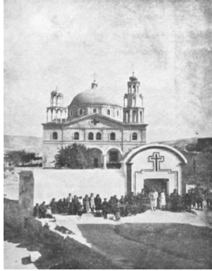
Resim 9: Ürgüp'te Osios Ioannis Kilisesi ve Ürgüp Ortodoksları, (Anastasopoulos, 1914, s. 117)

Kilise'nin kitabesinden ve anlatıcı tanıklıklarından edilen bilgilere göre kilisenin yapımı halkın maddi ve fiziksel desteği ile sağlanmıştır. İstanbul'da faaliyet gösteren cemiyetlerin adı geçmemektedir. Ürgüp yerleşiminde Hristiyanların birlik olarak inşa faaliyetlerine katılması aralarındaki bağın güçlülüğünü bize göstermektedir (Resim 9).