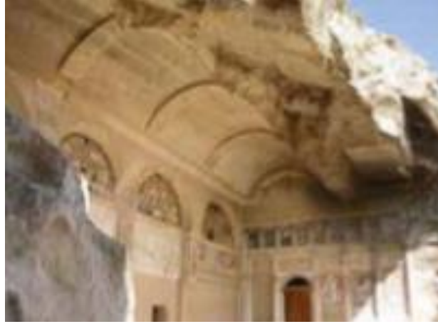
Resim 13: Kilisenin Günümüz Görseli