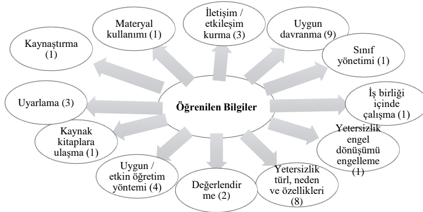
Şekil 1. Öğretmen Adaylarının Özel Eğitim Dersinde Öğrendikleri Bilgiler

17 Öğretmen adayı bu ders kapsamında pek çok yeni bilgi öğrendiklerini ifade etmişlerdir (Şekil 1). Bunlardan ilki özel eğitimin ne olduğunun öğrenilmesidir. Bu konuda Ö 45 “Bu dersten öğrendiğim özel eğitimin ne olduğudur.” şeklinde görüş belirtmiştir. Diğer görüşler kavramlar ve ders içeriği ile ilgilidir. Ö 32 “Dersin bana kattığı en önemli bilgi anlam ve kavram karmaşalarını ortadan kaldıramadım oldu.” şeklinde görüş beyan etmiştir. İkincisi ise pek çok yeni bilginin öğrenilmiş olduğu yönündedir. Ö 12 “Öğrencilerimizle nasıl iletişim kurabileceğimizi, nasıl davranabileceğimizi, işlenen dersin genel kontrolünü nasıl sağlayabileceğimizi öğrendik.” şeklinde görüşünü ifade etmiştir. Ö 40 “Bu ders sayesinde onlara nasıl yaklaşmam gerektiğini öğrendim.”; Ö 44 “Onlara karşı nasıl davranmam gerektiğini, derslerde nasıl onlara karşı etkin ve iyi bir yaklaşım içerisinde olabileceğimi bu ders sayesinde öğrenmiş oldum.” şeklinde açıklamada bulunmuştur. Diğer öğretmen adayları özel eğitim dersinden edindikleri bilgiler hakkında genel kanaatlerde bulunmuşlardır. Ö 39 ’un “Öğretmenlik yaşamımızda ihtiyaç olduğunda yararlanabileceğimiz çok değerli ve oldukça kapsamlı bilgiler edindik.”; Ö 45 ’in “Özel eğitim dersinde sunulan bilgiler farklılıkları tanımam açısından neler yapmam gerektiği hakkında ve bu bilgileri alanıma nasıl aktarmam gerektiği konusunda bana ufuk açıcı bir yol sağladı.” tarzındaki görüşleri bu genel kanaatlere örnek teşkil edebilir.