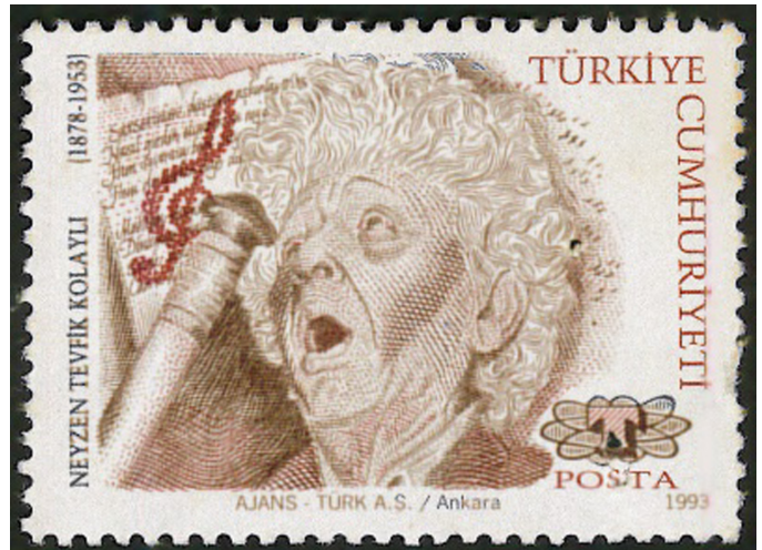
Görsel 16. Neyzen Tevfik Kolaylı ve Ney, 1993, 36 x 26 mm

Nefesli çalgılar sınıfına dâhil olan bu çalgı Türk Halk Müsikişi çalgıları arasında sesi tiz olan en küçük boyutlu çalgıdır. Sert su kamyşından üretilen bu çalgı yöresel tabirle gövde (gödlek) ve ağızlık (cukcuk) olarak isimlendirilen iki parçadan oluşmaktadır. Daha