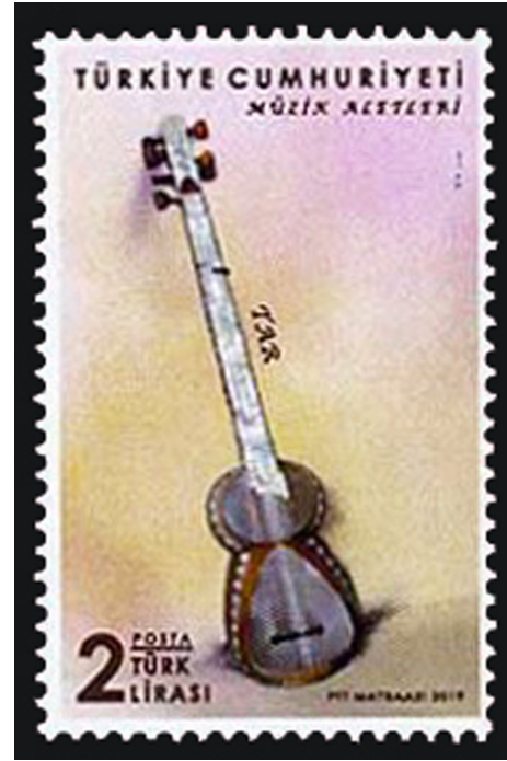
Görsel 5. Tar, 2019, 26 x 41 mm

Orta Asya ve Kafkas Bölgesine özgü olan bu çalgı Azerbaycan ve İran'da da yaygın olarak kullanılmaktadır. Yakın tarihte Türk Halk Müsikişinin önemli çalgıları arasında yerini almayı başaran Tar Azerbaycan müziğini icra eden çalışmalarda, hususi olarak kullanılan telli bir çalgıdır. Türkiye'de sınırlı bir kullanım sahasına sahip olan bu çalgı, daha çok Kars ve Iğdır dolaylarında yaşayan belirli