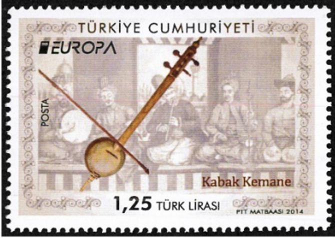
Görsel 6. Kabak Kemane, 2014, 52 x 36 mm

Arka planda ise serideki diğer pul tasarımının aksine kapalı alanda buldukları belli olan bir müzisyen grubu görülmektedir. Kabak Kemanenin konumlandırılmasıyla birlikte, arka plandaki figürler daha çok belirginleşmiştir.