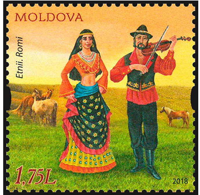
Görsel 17. Moldova Roman Kültürü, 2018, 33 x 33 mm

Kulaklarına ve kültürel birikimlerine güvenen Romanlar, genellikle müzik eğitimi almadan kendilerine özgü yöntemlerle müziklerini icra ederler. Bu Romanların her türlü çalgıyı kullanabilecek bir potansiyele sahip olduklarını göstermektedir. Lokal çalışanlar kendilerini çalgıcı olarak tanımlarken, nota bilgisine sahip olanlar