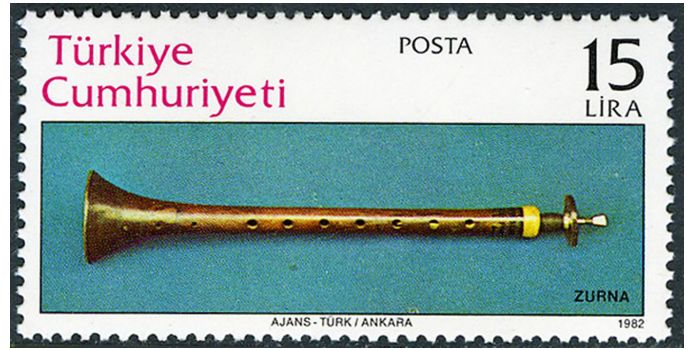
Görsel 15. Zurna, 1982, 52 x 26 mm

Farsça bir kelime olan Ney, kamyş manasına gelmektedir. Değişik boyutlarda olabilen Ney çalgısı, başın genellikle sola yatık pozisyonda çalınmasına olanak tanıyan bir çalgı türüdür. Batı dünyasının