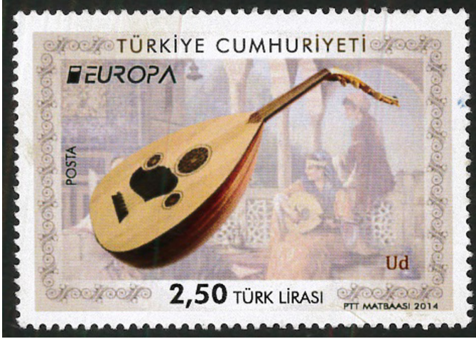
Görsel 1. Ud, 2014, 52 x 36 mm

125–127). Ud yapımında, hafif ve kurumuş ağaçlar tercih edilmektedir. Örneğin ses tablası kısmında; sitka, köknar veya ladin ağacı kullanılırken tekne kısmında ise daha çok; maun, pelesenk, gürgen, ardıç, abanoz, pommela, ceviz, akçaağaç (kelebek), venge ve paduk kullanılmaktadır (Oter, 2007: 26–27). Ayrıca geleneksel Ud sazında farklı türde ve kalınlıkta beş adet tel bulunmaktadır. Bunlar yukarıdan aşağıya doğru; bam teli, misles, mesnâ, zîr ve hâd telleridir. Diğerlerinden daha kalın olan bam teli ise bağır-saktan yapılmaktadır (Tüfekçioğlu, 2015: 65–69). Görsel 1'de 2014 yılında emisyon edilen ve Avrupa 2014 Ulusal Müzik Enstrümanları konulu çalışmayı oluşturan 2'li pul serisinden birine yer verilmiştir. 100.000 tirajı olan bu pulların grafik tasarımcısı Nuray Çalı'dır (Avrupa 2014 Ulusal Müzik Enstrümanları Ud, Erişim Tarihi: 07.06.2021). Pul tasarımında kullanılan Ud çalgısı diya-gonal olarak pulun merkezine konumlandırılmıştır. Arka planda