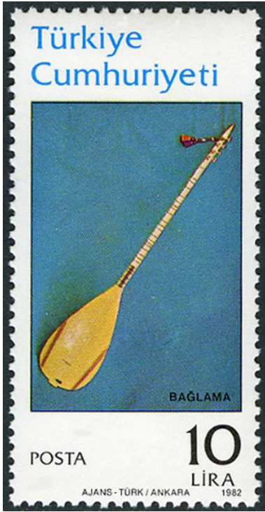
Görsel 4. Bağlama, 1982, 26 x 52 mm