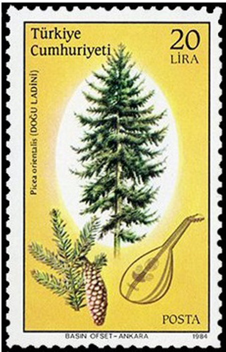
Görsel 2. Ud yapı malzemesi, 1984, 36 x 52 mm

125–127). Ud yapımında, hafif ve kurumuş ağaçlar tercih edilmektedir. Örneğin ses tablası kısmında; sitka, köknar veya ladin ağacı kullanılırken tekne kısmında ise daha çok; maun, pelesenk, gürgen, ardıç, abanoz, pommela, ceviz, akçaağaç (kelebek), venge ve paduk kullanılmaktadır (Oter, 2007: 26–27). Ayrıca geleneksel Ud sazında farklı türde ve kalınlıkta beş adet tel bulunmaktadır. Bunlar yukarıdan aşağıya doğru; bam teli, misles, mesnâ, zîr ve hâd telleridir. Diğerlerinden daha kalın olan bam teli ise bağır-saktan yapılmaktadır (Tüfekçioğlu, 2015: 65–69). Görsel 1'de 2014 yılında emisyon edilen ve Avrupa 2014 Ulusal Müzik Enstrümanları konulu çalışmayı oluşturan 2'li pul serisinden birine yer verilmiştir. 100.000 tirajı olan bu pulların grafik tasarımcısı Nuray Çalı'dır (Avrupa 2014 Ulusal Müzik Enstrümanları Ud, Erişim Tarihi: 07.06.2021). Pul tasarımında kullanılan Ud çalgısı diya-gonal olarak pulun merkezine konumlandırılmıştır. Arka planda