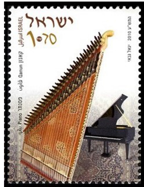
Görsel 3. İsrail Kanun, 2010, 31,7 x 20,1 mm

Geleneksel Türk Sanat Müziği çalgıları arasında yer alan Kanun 3,5 oktavlık ses genişliğine sahip yatay çalınan bir çalgıdır. İki elle çalınan bu çalgıda kaplumbağa kabuğundan yapılmış başa mızraplar kullanılmaktadır. Toplam 78 telden oluşan bu çalgıda 26 perde bulunmaktadır. Her bir perde ise 3 telden oluşmaktadır (Bayrakçı, 2020: 17–19). Altılı mandal sistemine göre belirlenen düzende perdeler, harf notasyonuna göre sıralanmıştır. Bu perdeler tiz muhayyer ile kaba yegâh aralığında akort edilmektedir (Günalçin, 2013: 77–83). Ayrıca Kanunun ses tablası; ladin, çınar, maun, ceviz ve köknar ağacından. Yanları; gürgen, köknar ve ladinden. Alt tablası; ihlamur ve kızılağaçtan. Akort burguları ise erik, akgürgen, limon ve abanoz türü ağaçlardan yapılmaktadır (Bayrakçı, 2020: 11; Tetik ve Uslu, 2012: 30). Görsel 3'de 2010 yılında İsrail'de tedavüle giren 5'li pul serisinden birine yer verilmiştir (İsrail Kanun, Erişim Tarihi: 07.06.2021). Tasarımın arka planına bakıldığında zeminde bir halı motifi göze çarpmaktadır. Bu motif dikey düzlemde aşağıdan yukarıya doğru gidildikçe degradeli bir şekilde yerini beyaz renge bırakmaktadır. Böylece oluşturulan zemin üzerinde, pul ile ilgili İbranice bilgilere yer açılmıştır. Aynı zamanda pulun sağ alt köşesinde bir Piyano görülmektedir. Pulda en büyük alanı (neredeyse 2/3 oranında) ise Kanun kaplamaktadır. Tasarıma genel olarak bakıldığında klasikliğin iki çeşidine yer verdiği söylenebilir.