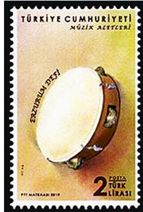
Görsel 10. Def, 2019, 26 x 41 mm

Türk toplumları arasında eskiden beri yaygın olarak kullanılan Def Türk Müsikiğinde usul vurma çalgısı olarak kullanılmaktadır. Yuvarlak bir kasnağın bir yüzüne deri gerdirilmesi, diğer yüzünün açık bırakılması ve etrafının gevşek zillerle donatılmasıyla oluşturulmuş bir Davul çeşididir. Avrupa toplumlarının da yakından tanıdığı bu çalgı tambour de basque olarak isimlendirilmektedir (Göktaş, 2010: 75). Bu çalgı, parmak vuruşlarıyla usul tutturma veya elle serbest sallama prensibiyle çalışmaktadır. Görsel 10'da 2019 yılında emisyon edilen ve Müzik Aletleri konulu çalışmayı oluşturan 3'lü pul serisinden bir diğerine yer verilmiştir (Müzik Aletleri Def, Erişim Tarihi: 16.03.2021). Tasarımda serinin aynı ölçülendirme, forma ve yerleşim düzeninin devam ettirildiği görülmektedir. Sadece pulun değerini belirtilen düzenleme soldan sağa alınmıştır. Arka plandaki renk iki parçalı bir yapıdan tek parçaya