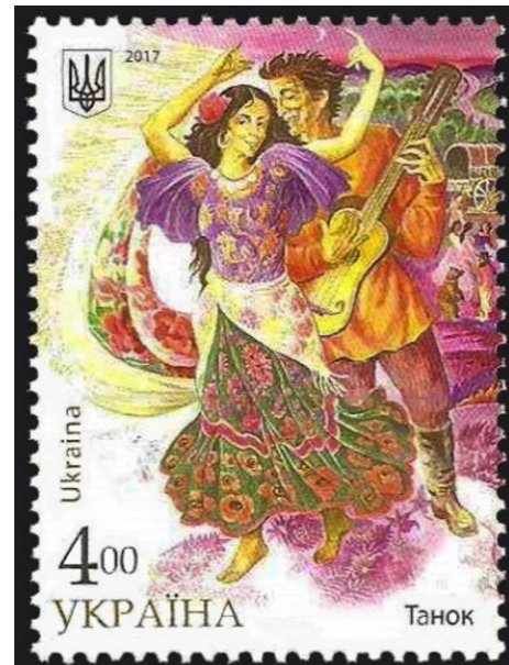
Görsel 18. Ukraynalı Romanlar, 2017, 21 x 41 mm

ve profesyonel müzik icracıları kendilerini müzisyen olarak tanımlamaktadır. Yaşadıkları toplum içerisinde kendilerini farklı bir zümre olarak gören bazı müzik icracıları ise kendilerini tanıtırken Roman tabirini kullanırlar. Özellikle, batıda yaşayanların kullandığı bu tabir, ilgilinin müzik icracısı olduğuna işaret etmektedir. Yaşam kültürüyle müziği birleştiren Romanlar, yaşadıkları sıkıntıların dışavurumunu da böylelikle sosyal hayata uyarlamış olurlar. Buradan hareketle Romanların mutlu olabilmek için kendilerini müzikle ifade ettiklerini söyleyebiliriz. Kültürel birikimin taşıyıcısı konumunda olan Romanlar, bir yönüyle sözlü geleneğin hem temsilcisi hem de aktarıcısı konumundadır.