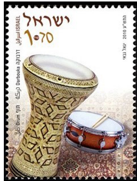
Görsel 11. Darbuka, 2010, 31,7 x 20,1 mm

Daha çok köy eğlencelerinde kadınların çalgı olarak kullandığı Dümbelek, bilinen Darbukanın atası konumundadır. Anadolu'da yaşayan ustalar bu çalgıyı, genellikle kil malzemeden üretmekteydi. Günümüzde bu üretim tekniğinin yerini alüminyum, bakır ve pirinç gibi alaşımlar almıştır. Türk Darbukası olarak bilinen çalgı ise bakır malzemeden üretilmektedir (Karaol ve Doğrusöz,