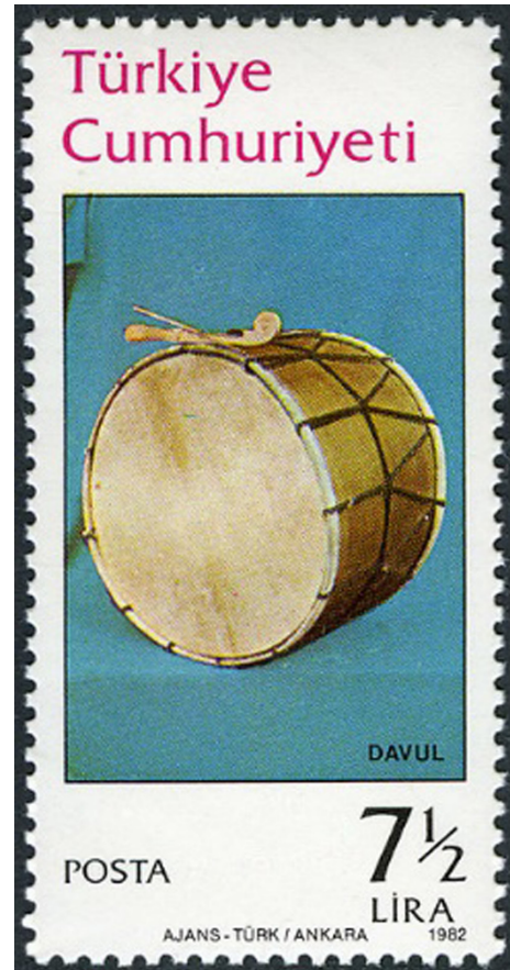
Görsel 8. Davul, 1982, 26 x 52 mm

yapımında genellikle ceviz ağacı tercih edilmektedir. Deri yüzey ise daha çok dana, keçi veya koyundan elde edilir (Tüfekçioğlu, 2015: 179). Vurmalı çalgılar arasında yer alan ve bilhassa askeri amaçlı kullanılan Nakkare, Kös ve Tabl gibi unutulmaya yüz tutmuş bazı çalgı türleri ise artık tarihi müzik çalgıları olarak anılmaktadır (Aydın, 2020: 264). Türkler arasında çok yaygın olan bu çalgı türü yöresel kullanıma ve yaşanan coğrafyaya göre farklı formlarda şekil almıştır. Bu nedenle bu çalgının çok değişik türlerine rastlamak mümkündür. Davullar tarih boyunca dini törenlerde, askeri seferlerde, düğünlerde ve önemli merasimlerde yaygın olarak kullanılmıştır. Resmi olarak da devam ettirilen bu geleneği Selçuklular tâblhânelerde, Osmanlılar ise mehterhanelerde yaşatmıştır (Kaya, 2012: 97–98). Zurnanın ayrılmaz bir parçası olan Davul Türk