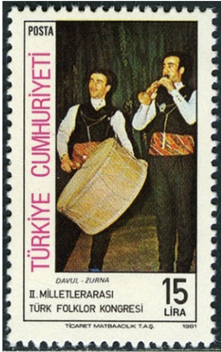
Görsel 9. Davul ve Zurna, 1981, 26 x 41 mm

kültürünün bilindik en temel çalgıları arasında yer almaktadır. Görsel 8'de emisyonu 1982 olan ve Türk Müzik Aletleri konulu çalışmayı oluşturan 5'li pul serisinden bir diğerine yer verilmiştir (Türk Müzik Aletleri Davul, Erişim Tarihi: 07.06.2021). Tasarımda, serinin aynı ölçülendirme zemin rengi, marj ve yerleşim düzeninin devam ettirildiği görülmektedir. Görselde Anadolu'da yaygın olarak kullanılan Davulun hacminin ve yapısının anlaşılır biçimde gösterildiği bir açı tercih edilmiştir. Görsel 9'da 1981'de emisyon edilen ve II. Milletlerarası Türk Folklor Kongresi anısına bastırılan 5'li pul serinden birine yer verilmiştir. 600.000 tirajı olan bu pullar ofset baskı tekniğiyle oluşturulmuştur (II. Milletlerarası Türk Folklor Kongresi Davul ve Zurna, Erişim Tarihi: 07.06.2021). Tasarımda dikey bir kompozisyon tercih edilmiştir. Bununla birlikte aynı marj içerisinde hem görsel hem de metinsel ifadeler yer almaktadır. Hiyerarşik yapıda ise ilk anda Türkiye Cumhuriyeti yazısı ve pulun değeri göze çarpmaktadır. Ayrıca görselde yer alan fotoğrafta, geleneksel kıyafetleriyle sanatsal faaliyetlerini sürdürmeye çalışan Davul ve Zurna icracısına yer verilmiştir.