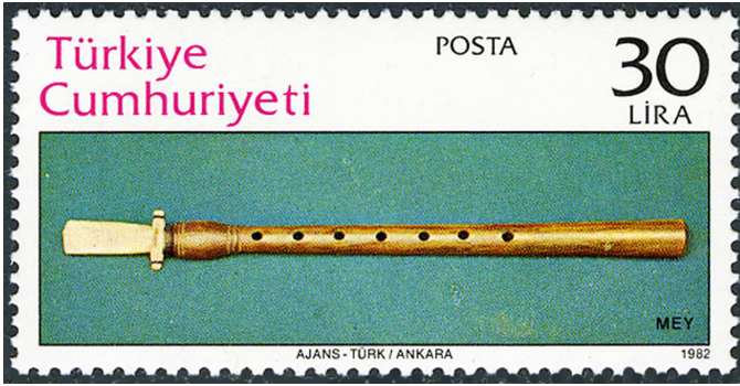
Görsel 14. Mey, 1982, 52 x 26 mm

ortalamış, diğeri ise kesişim yapmayacak şekilde sağına konumlanmıştır. Pulun değeri ise üst solda belirtilmiştir.