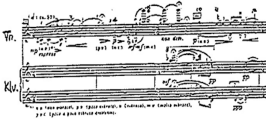
Tablo4: GASA'da 12 ton ve Çeřitlemeleri ( Twelve-Tone in No 1-4 )

GARAK: Flüt ve Pişano için bestelenen Garak, kelime anlamıyla Kore melodisidir. Besteci bu parçada serbest 12 ton tekniğini kullanır ancak esere doğu uygulamaları ve etkileri egemendir; içinde parlak formüllerle gösterilen zor süslemeler ve teknik etkileri ( dil titremeleri gibi ) kullanmıştır.