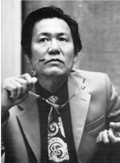
Resim 2: Isang Yun

15 Ağustos 1948'de Güney Kore Cumhuriyeti kuruldu. Yun, Kore kültürel yaşamının yeniden yapılandırılmasıyla da yakından ilgilenmiştir. Chi-HwanYoo adlı bir şair tarafından örgütlen-