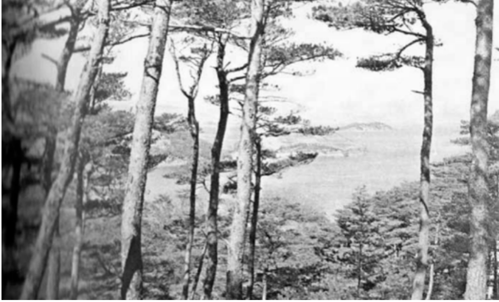
Resim 1: Çocukluk yıllarındaki şehirden bir manzara

Çincedir. Çin yazını ve tarih konularında tanınmış bilim adamı ve şair Ki-Hyon Yun'un ilk oğludur. Yun ailesinin bu kolunun Çin'den Kore'ye 37. kuşaktan önce göç ettiği ve kültürel işlevi olan bir sorumlulukla Kore'ye yerleştikleri düşünülmektedir. Yun'un babası oğluna, Çin'in Yin