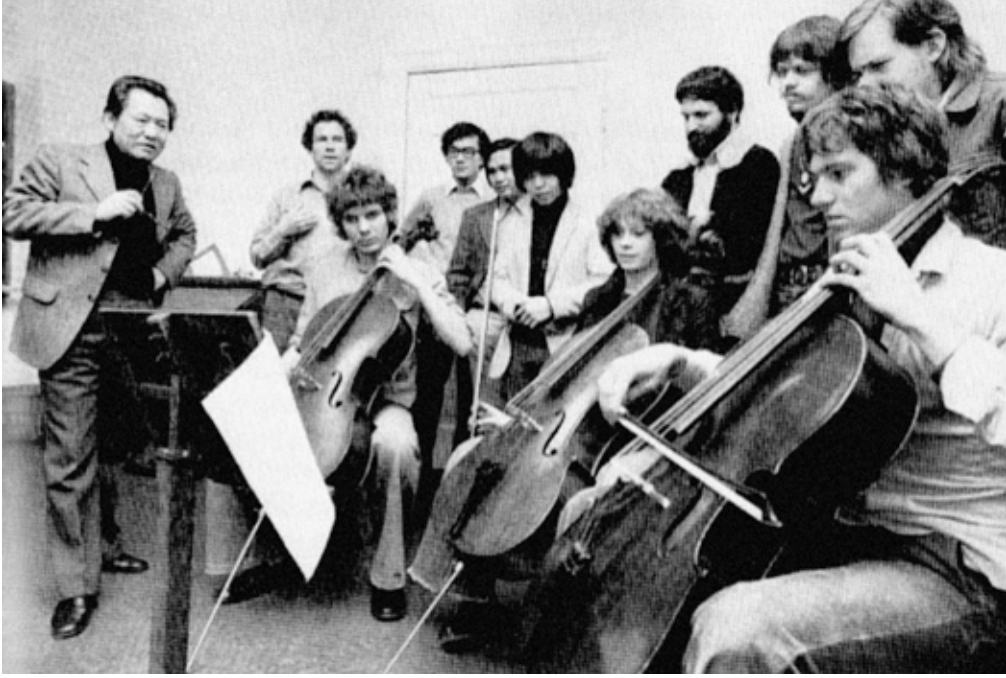
Resim 3: Berlin Yüksek Sanat Okulu, öğrencilerle prova