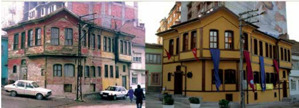
Figure 1 Museum of Educational Cartoons Before and After The Restoration

The building now houses the Museum of Educational Cartoons is located in the protected area in Odunpazarı, where the city was first founded. The building was fettered by the Protection of Cultural and Natural Heritage Committee in 1980 and later on restored in order to utilize as museum. During the restoration, special attention paid in order to protect the unique identity of the building ( Figure 1 ).