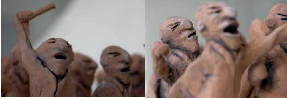
Figure 10 "Meeting", Detail, 2006

Mutual ceramic sculpture work of S. AYGÜN and A. ÖZER, "Medals", has won the sculpture prize in the 19. International Biental of Humour and Satire in the Arts, 2009 (Figure 11,12).