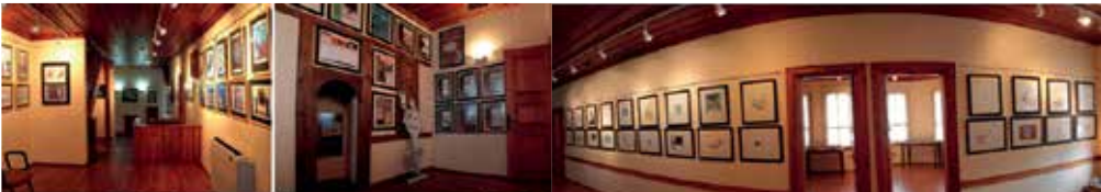
Resim 2 Eğitim Karikatürleri Müzesi

Eğitim Karikatürleri Müzesi, Türk ve yabancı karikatüristlerin çalışmalarının ve müze koleksiyonundaki eserlerin sergilendiği daimi sergi salonları ve periyodik olarak kişisel-karma sergilere ev sahipliği yapan sergi salonları ile yaşayan, çağdaş bir müze atmosferi yaratmaktadır( Resim2 ).