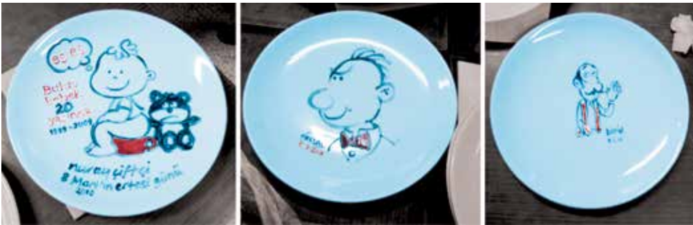
Figure 14 The Cartoons of Nuray ÇİFTÇİ, Köksal ÇİFTÇİ and Mustafa BİLGİN on the Plate

The Japan Cartoonists Yoshiaki YOKOTA and Norio YAMANOİ, who have contributed to the “Modern Japan Cartoons” exhibition which was performed in Museum of Educational Cartoons, within the scope of “2010 the Japan Year in Türkiye”, have also made cartoon drawing onto the porcelain plates with paintings.