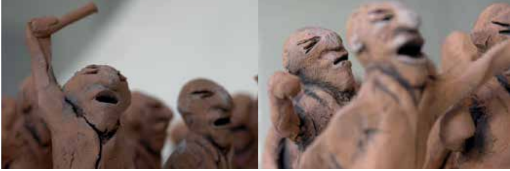
Resim 10 "Karşılaşma", Detay, 2006

Bu çok figürlü seramik heykelle, geçmişte bizim de yaşamak zorunda kaldığımız ve benzerlerine dünyanın hemen her yerinde şahit olduğumuz bir gerçek, şiddetin toplumları nasıl etkilediği, dönüştürdüğü ve bir kaos ortamı oluşturduğu en vurucu formuyla tasvir edilmiştir (Resim 10).