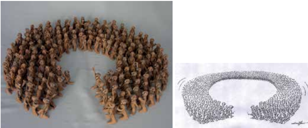
Figure 8 “Meeting”, Sadettin AYGÜN, 2006

In this work; a fact, which we had previously experienced in the past and witnessed all over the world, how violence affect, mutate the people and result a chaos atmosphere