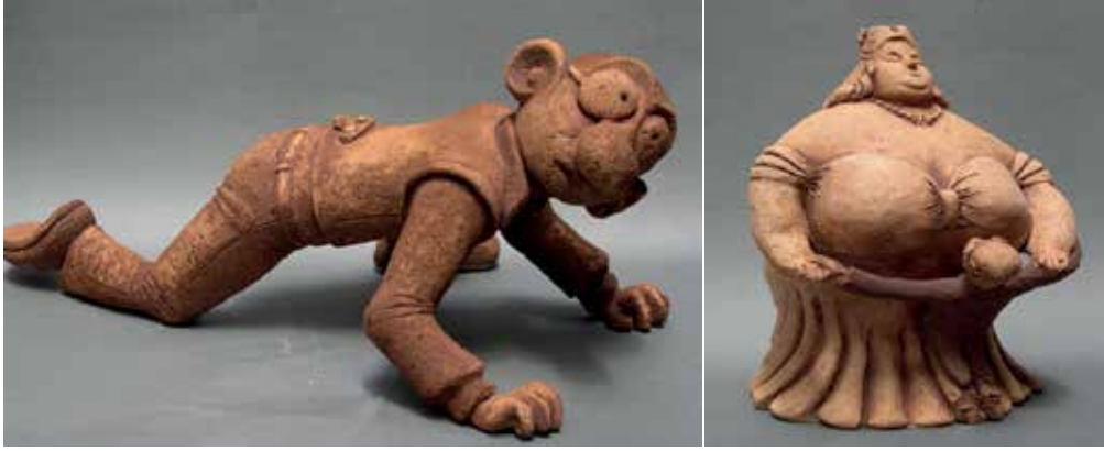
Figure 6 Kamuran AK, “En Kahraman Rıdvan” (Bülent ARABACIOĞLU), 2006

En Kahraman Rıdvan ( Figure 6 ), Abdülcanbaz and Tombul Teyze ( Figure 7 ) have also taken into consideration. Selected ceramics have been utilized by exhibiting them in the museum after the exhibition and hence a visual wealth have been provided in exhibition.