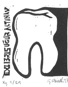
Resim6: Diş hekimi Uğur Altınay için yapılmış ekslibris (Gökhan Okur X3, 1997, 48x50 mm).

lerdir. Bunlar gerçekte birbirlerine bağlıdır. Örnek olarak Görüntü 6'daki ekslibris, adına yapılan kişinin mesleği ile doğrudan bağlantılıdır. Diş imgesi, Uğur Altınay'ın diş doktoru olduğuna dair belirtisel, bazı yönleriyle nesnesiyle benzerlikler taşıdığı için de görüntüsel göstergedir. Başka bir örnek olarak Görüntü 7'de L.V. Beethoven'in portresi kendisiyle benzerlikler taşıması bakımından görüntüsel, ekslibris sahibinin müzik sevdiğine ya da müzisyenliğine bir gönderme yaptığından dolayı belirtisel bir göstergedir (Görüntü 7).