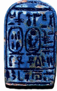
Resim1: M.Ö. 1400 yıllarında açık mavi renk fayans üzerine yapılan ve III. Amenophis'in kitaplığına ait olan ekslibrisin görüntüsü.

Ekslibris , kitabın kime ait olduğunu bildiren, sembol ve işaretlerden oluşan, sanat ve tasarım ilkeleri doğrultusunda sanatsal öğelerin buluştuğu, belirli sayıda, farklı teknikler ile çoğaltılan, kitapların iç kapağına yapıştırılacak kadar küçük boyutlara sahip, daha çok batı ülkelerinde yaygın, geleneksel bir sanatsal çalışmadır. ...'nın kitabı, ...'nın kitaplığına ait veya... 'nın kütüphanesinden anlamına gelen ekslibris İngilizce'de 'bookplate' olarak adlandırılır. Köklü bir geleneğe sahip olan ekslibrisin bilinen en eski örneği (Görüntü 1), M.Ö. 1400 yıllarında yapılmış olan III. Amenophis'in kitaplığına ait açık mavi fayans bir objedir "Lamb, (2012)". Kültür ve sanata verdiği büyük önemle tanınan ve M.Ö. 600 yıllarında yaşamış olan Asur Kralı Asurbanipal zamanından kalma ekslibris örneklerinin bulunduğu da belirtilmektedir "Koşay (1977)". Almanya'da 1450 yılında 'kirpici' lakaplı bir papazın adına yapılan çalışma ilginç bir örnektir (Görüntü 2). Ancak M.S. 15. yüzyılın üçüncü çeyreğinde Almanya'da; ağaç üzerine elle boyanmış basit bir arma ile sahibinin eliyle yazılmış bir sözden oluşan ekslibris , gerçek anlamdaki ilk örneklerdir.