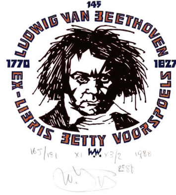
Resim7: L.V. Beethoven konulu bir ekslibris (Walter Wuyts X1/X3, 1988, 100x100 mm).

İletişimin gerçekleşmesine yardımcı olan kavramlardan birisi de geri beslemedir (feedback). Geri besleme göndericinin etkin bir iletişim kurmasında başvurduğu önemli bir aşamadır. Ancak geri besleme her tür iletişimde aynı etkide değildir. Kitle iletişim araçlarının bazılarında bu durum gerçekleşemez. Örnek olarak bir derslikte verilen ders sırasında, eğitmen ve öğrenci arasındaki iletişimle, uzaktan eğitim araçlarıyla verilen ders sırasında gerçekleşen iletişim arasında geri besleme açısından pek çok farklılık vardır. Derslikte verilen ders sırasında eğitmen öğrencilerden gelen tepkiler (geri besleme) aracılığıyla dersi daha anlaşılır kılabilir. Uzaktan eğitim anında geri besleme çok sınırlıdır. Fakat geri beslemenin olmaması, iletişimin gerçekleşmemesi anlamına gelmez.