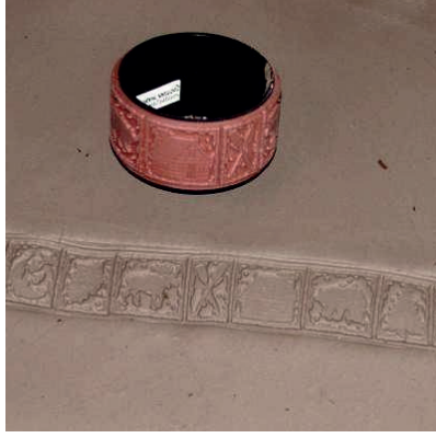
Resim5: Kauçuk mühür örneği