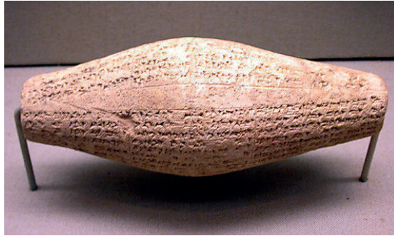
Resim1: Lale şeklinde silindir mühür, Babil İmparatorluğu, Mezapotamya M. Ö. 604-562

Kültepe dışında yapılan kazılarda yazılı belgeler bulunmuştur. Bu belgeler ticaret ve alışveriş merkezleriyle ilgili olmakla birlikte kil tabletler üzerine Asur diliyle, özel yontulmuş kalemlerle çiviye benzer işaretler kullanılarak, mühür şeklinde uygulanmıştır.