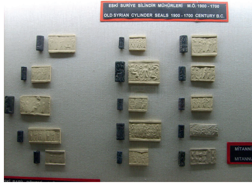
Picture 2: Old Syrian Cylinder Stamps , B.C.1900-1700

Hittites of Anatolia, which is a feature of domestic and separates civilization from other countries in the region to stamp the art of the Near East , have developed to an extent not seen in any era of specimens belonging to this branch of art with cuneiform inscription of hieroglyphic signs , the presence of this article has been helpful to read. 9