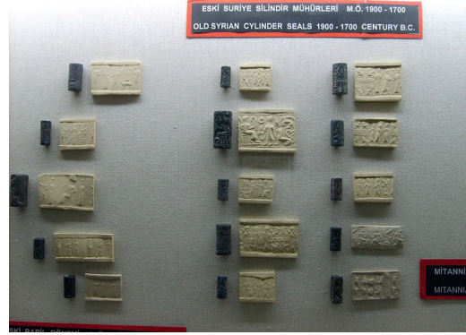
Resim2: Eski Suriye'de çıkan silindir mühür örnekleri, M.Ö.1900-1700

Koloni Çağında çömlekçi çarkı yaygınlaşmış, yazılı tarih başlamış ve Hititler tarih sahnesine çıkmışlardır. Anadolu'da Hititlerin tarih sahnesine çıkışıyla birlikte eski Hitit Sanatının doğuşu görülmektedir. Genelde dönemin sanatı Eski Tunç Çağı'ndan, Hattili sanat üslubu ile Mezopotamya etkisi ve Hititler'in kendi görüşlerinin karışmasından doğmuştur. Bu özellik Kültepe, Acemhöyük, Alışar ve Boğazköy'de bulunmuş Koloni Çağı'nın çeşitli mühür üsluplarından izlenebilir. Anadolu Grubu olarak adlandırılan mühürler ve baskıları üzerinde görülen figürler, onların Anadolu kökenli olduklarını göstermektedir.