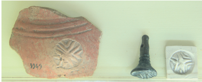
Resim3: Hitit dönemi mühür örnekleri M.Ö. 1350, İstanbul Arkeoloji Müzesi

Hititler, Anadolu'nun yerli bir özelliği olan ve bu uygarlık bölgesini Yakın Doğu'nun diğer ülkelerinden ayıran mühür sanatını, hiçbir çağda görülmeyen bir ölçüde geliştirmişlerdir. Bu sanat dalına ait örneklerin üzerinde çivi yazısıyla birlikte hiyeroglif işaretlerinin de varlığı bu yazının okunmasına yardımcı olmuştur. 6