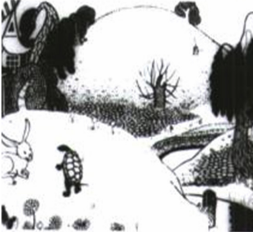
Görsel 5: Kaplumbağa ile Tavşan