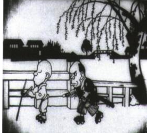
Görsel 6: Kapıcı Mukuzo Imokawa

Noburō Ōfuji 1927 yılında ilk sesli anime olan “Balina” (The Whale) ve 1929 yılında ilk renkli anime olan “Altın Çiçek” (The Golden Flower) adlı eserlere imza atmıştır. 1930 ve 1945 yıllarında animeler, gazete ve dergilerde yayınlanan popüler manga serilerini hayata geçirmiştir. Bu dönemde II. Dünya Savaşı’ nın da etkisiyle Japonya’ nın içinde bulunduğu askeri ve siyasi koşullar animelere konu olmuştur (Richmond, 2009: 1-6).