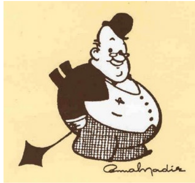
Görsel 7: Amcabey

Türkiye’ de Batı’ dan gelen çizgi filmlerin sinemalarda gösterime girmesinin ve basında yer almasının ardından 1930-1940’ lı yıllarda Batılı anlamda çizgi film yapma arayışları başlamıştır. Çizgi film yapımının sorumluluğunu, ilk üstlenen karikatüristler arasında ise Cemal Nadir Güler yer almaktadır. Cemal Nadir Güler 1930’ larda popüler karikatür tiplmesi Amca Bey’ i canlandırmak istemiştir. (Türk Canlandırma Tarihi Belgeseli, 07:46-08:46). Fakat ne yazık ki bu çalışma yarım kalmıştır. Toplamda 47 saniye sürecek olan “Amca Bey Plajda” filmi tüm özverili ve uzun çalışmalara rağmen imkânsızlıklar yüzünden tamamlanamamıştır. Fakat şişman, gözlüklü, fötr şapkalı Amca Bey tiplmesi çok sevilmiş ve takip edilmiştir. Orhan Selim 1935 yılında Akşam gazetesinde yayınlanan bir yazısında Amca Bey’ in başarısını Nasrettin Hoca gibi günlük yaşamamızın içine girmesiyle açıklamış ve onu Şarlo’ ya benzetmiştir. ( aktaran: Nazım Hikmet, “Sanat, Edebiyat, Kültür, Dil”, 1993, s. 120-121).