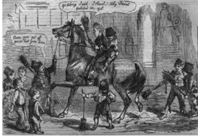
Görsel 3: Japan Punch Dergisinin Kapağı ve İçeriği

Japon çizimler, 1900'lerin başında Amerikan gazetelerinde yaygınlaşmaya başlayan çizgi bantların ve çizgi roman dizilerinin etkisinde kalmışlardır. Bu çizimlerden biri olan Kitazawa, ilk sürekli karakterli Japon çizgi roman dizisini yaratmıştır. "Togosaku to Mokube no Tokyo Kem-butshi" adındaki çizgi roman dizileri, Birleşik Devletlerdeki benzerlerini örnek alan renkli pazar eki "Jiji Manga" dergisinde yayınlanmıştır. 1920'lerde Japonya'ya da siyasi ve toplumsal düşünce tarzlarında özgürleşmenin günlük yaşama taşındığı görülmektedir. Amerikan etkisi, müzikten moda ve dekorasyona kadar güncel olan her şeyde kendisini göstermeye başlamış; bu dönemde çizgi roman sanatçıları, yozlaşma eğiliminde olan Japon toplumunu resmetmişlerdir ( http://www.anime.gen.tr/yazi.php?id=160 , Erişim tarihi: 15.02.2011).