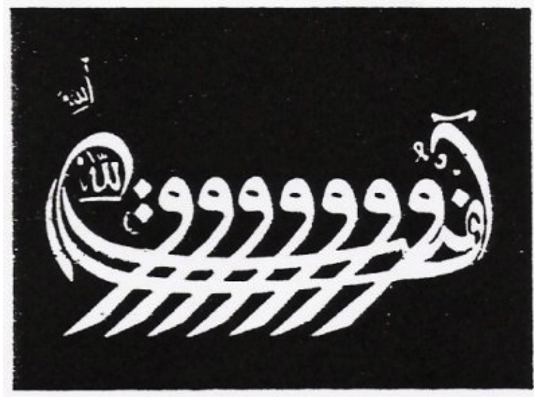
Görsel 8: "Amentü Gemisi Nasıl Yürüdü?" Filminden Bir Kare