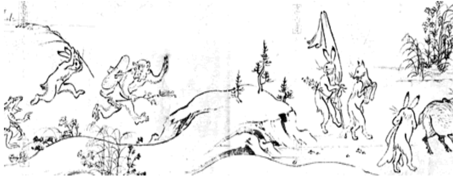
Görsel 1: Choju Giga

En basit tanımıyla Japon çizgi romanı olan manganın tanınması kendinden sonra ortaya çıkan animelerin tüm dünyada yaygınlaşmasıyla olmuştur. Manganın tanımı Oxford sözlüğüne göre; bilim kurgu, fantastik öğeler ve zaman zaman şiddet ya da cinsel içerikli temalardan oluşan Japon çizgi roman türüdür. Kelimenin kökeni Japonca “gelişigüzel” anlamına gelen “man” ve “resim” anlamına gelen “ga” sözcüklerine dayanmaktadır ( http://oxforddictionaries.com/ , Erişim tarihi: 20.10.2010)Manganın ortaya çıkış tarihi kesin olarak bilinmemektedir. Ancak bugüne dek elde edilen bulgular manganın tarihçesini, Japon sanatının en önemli örneklerinden biri olan Choju giga ya da Hayvan Çizimlerine (Animal Scrolls) dayandırmaktadır. Choju giga, hayvanların gündelik yaşantısını kullanarak dini hiyerarşiye eleştirel bir bakış açısı getirmiştir. Bu bakımdan özellikle 12. yüzyılda Toba adlı bir Budist rahip tarafından din adamları ve asalet üzerine hazırlanmış bir yergidir (Brenner, 2007:1-2). Bu çizimleri günümüz mangasından ayıran en önemli farklılık kitle tüketimi için değil, elit bir okuyucu grubu için üretilmiş, tek kopyası olan sanat eserleri olmasıdır (“Manganın Tarihçesi”, 2007: 21)