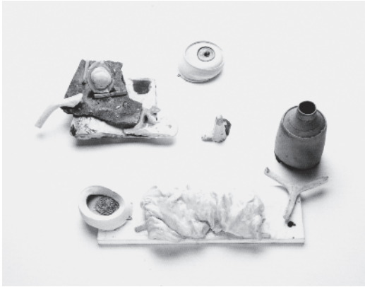
Resim 6: Neil Brownsword, Kurtarılan Eşya /Salvage Series, 2000.

Malzeme konusundaki bu yeni kavrayış maddi kültür çalışmaları ile de ilişkilendirilmektedir. Objeyi kültür araştırmalarında öncelikli bir veri kaynağı olarak görmek maddi kültür alanının temel bakış açısıdır. Bu yeni disiplin objeyi sözlü ve yazılı kaynakların yerine önermektedir. "Objeler kelimelere göre, nüfusun çok daha geniş bir kesimi tarafından kullanılmakta ve bu nedenle daha geniş kapsamlı, daha temsili bir bilgi kaynağı olma potansiyelini taşımaktadır (Prown, 2000: 83)". Bu görüşün üstünde durduğu konu, genel bir yaklaşım olarak zihinsel ve sözel olanın, tarih içinde madde üzerindeki hâkimiyetini yeniden düşünmeyi önermektedir.