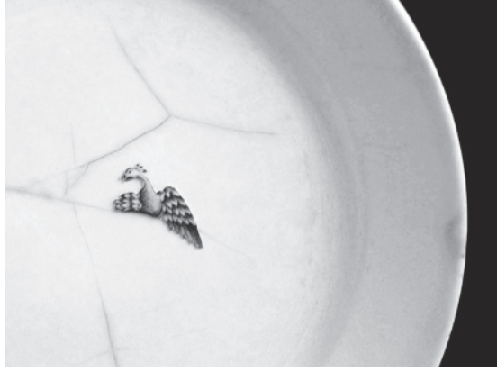
Resim 4: Caroline Slotte, Kışı Geçiren Sülün/Pheasant Spending the Winter, 2009.

çalışmalarında, gözden kaçan detayları görünür hale getirmekte ve nesnenin taşıdığı alt anlamları açığa çıkarmayı hedeflemektedir. Bu açığa çıkarma işlemi arkeolojik bir yaklaşım taşır, porselen tabakların desenlerinin bulunduğu sırlı yüzeyi kazıyarak, hikâyeyi tekrar okunur hale getirir ve o nesnenin yeniden tanımlanmasına olanak sağlar.