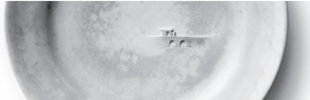
Resim 5: Caroline Slotte, Tanımlanamayan Manzara/Unidentified View, 2009 İşlenmiş Seramik Tabak, 21 cm.

Bir şeyi silerek onu daha görünür hale getirmek, gündelik algının varsaydığı bilgiyi mercek altına almaktır. Sanatçı hiçbir şeyin tamamen silinemeyeceği bilgisini vurgular. Tabağın sırsız yüzeyinin taşıdığı izler objenin hafızasını öne çıkarmaktadır (Resim 4). Sanatçı yaptığı araştırmada, baskı transfer tekniği ile yapılmış olan bu tabakların 19.yy seramik endüstrisinde bir devrim niteliğinde olduğunu belirtir. El boyaması değerli nesnelere yerine, seri üretim ucuz ürünlerin dekorlanabilmesi ve ihraç edilebilmesi anlamına gelmektedir. Bu hareketlilik, çoğunlukla üretildiği coğrafyadan bağımsız olarak, tabağın üzerindeki imajın baskı kalıbını hazırlayan, bu resmi ince bir işçilikle bakır levhaya kazıyan kişinin hayal ürünü manzaralarda okunaklıdır (Slotte, 2011: 34). Slotte'nin yaptığı kazıma işlemi, seri üretim olanın içine gizlenmiş, bireye ait bir detayı görünür kılmaktadır. Sanatçı izleyicinin bakışını daha dikkatli bir bakışa çevirme gayretini, hem kendi üretimi hem de diğer sanat alanlarına karşı duyarlı bir algıyı kovaladığını ifade etmektedir (Slotte, 2010: 60) (Resim 5).