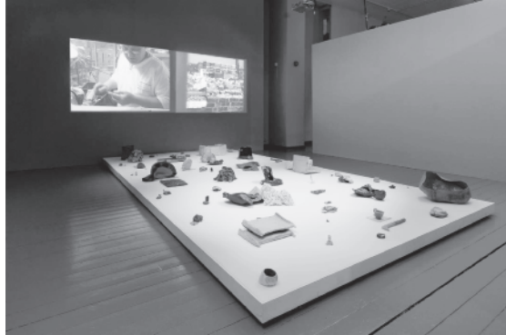
Resim 8: Neil Brownsword, Zaman Alan/Taking Time Sergi Düzenlemesi, 2009.

Üretimin farklı aşamalarında atıl hale gelmiş alet ve kalıntıları tekrar pişirir ve üst üste yığıldığı malzemelerin tepkisini görünür kılar (Resim 7). Brownsword düzenlemelerinde malzemenin hafızasını sürecin belgesi olarak kullanır. Bir sahne gibi kurguladığı düzenlemeleri, bize tanıdık olmayan bir sürecin ara kesiti olarak göstermektedir. Öncelikle titizlikle kurgulanmış soyut bir kolaj olarak algılanabilecek düzenleme, malzeme çeşitliliği ve bir sürece tanıklık etmiş kalıntıların inandırıcılığı arkasındaki hikayeyi çekici kılmaktadır. Son dönem çalışmalarında, beraberinde yaptığı arkeolojik araştırma bir belgesel niteliğinde düzenlemenin parçası olarak yer almaktadır (Resim 8).