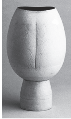
Resim 1: Hans Coper, 1975, Seramik, 14.3x24

Modernizmin soyut ideal sanat anlayışını ifade etme arayışında, el sanatları ve zanaat ile eşleşen seramik malzeme, modern sanat tarihinin dışında kalmıştır. Buna rağmen 50'lerde modernist ilkelerin okunur olduğu, soyut formel arayışların gözlendiği bir seramik üretimi şekillenmiştir. İngiltere'de Hans Coper ve Ruth Duckworth; Amerika'da John Mason'ın seramikleri modern sanat tarihinin bir parçası olarak yer almasa da bugünden geriye doğru bakıldığında modernist seramik geleneğinin öncüleri olarak değerlendirilmektedir (Del Vecchio, 2001: 9).