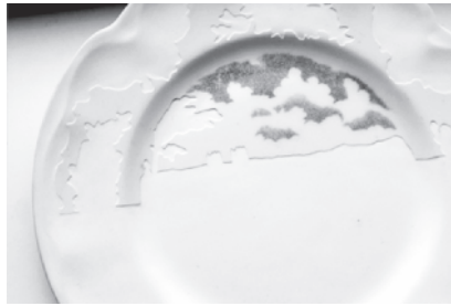
Resim 3: Caroline Slotte, Mavi Gökyüzünün Altında/Under Blue Skies, 2009 İşlenmiş Seramik Tabak, 22cm.

Post-Modern sanat kökünde dışlayıcı ya da indirgeyici değil, sentetiktir. Nesnenin ötesindeki bütün koşulları, deneyimleri ve bilgileri özgürce kendisine katabilir. Post-Modern nesne, tek ve tam bir deneyimin peşine düşmek şöyle dursun, sayısız yaklaşım açısına ve çeşitli tepkilere izin veren ansiklopedik bir durumu hedefler (Connor, 2001: 134).