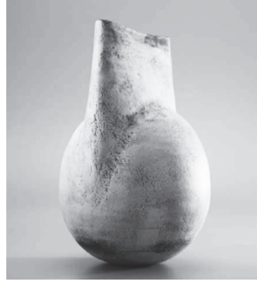
Resim 2: Hans Coper, 1975, Seramik, 14.3x24