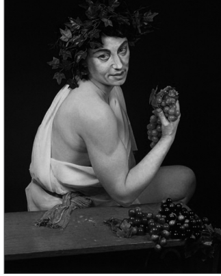
Resim 4. Cindy Sherman, İsimlessiz, No: 224, 1990, Kromojenik Renkli Fotoğraf, 121,9x96,5 cm. Linda ve Jerry Janger'ın Koleksiyonu, Los Angeles.

... Sherman, erken çalışmalarındaki yüzyıl ortasının göreceli natüralist kalıplarından, romantik masallar ve düşük bütçeli korku sinemalarının daha yeni fantastik abartılı klişelerine doğru ilerlemiştir. Açıkçası, Sherman'ın yetenekli ellerinde "giydirmek-süslemek" ve "oyuncakla oynamak" hem çok riskli ciddi yetişkin işi, hem de bizde olduğu gibi toplumsal gelenekler ve psikolojik eğilimleri keşfetmenin saldırgan ya da ince bir aracı olabilmektedir" ( http://www.moma.org/interactives/exhibitions/1997/danneisser/commentary.html#sherman ).