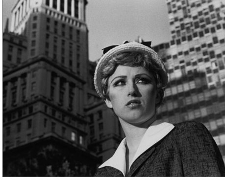
Resim 3. Cindy Sherman, İsimsiz Film, No: 21, 1978, Jelatin Gümüş Baskı, 19,1x24,1 cm. Robert B. Menschel tarafından Horace W. Goldsmit'e bağışlanmıştır.

kavramları temelli oluşumlarla sergilenmekte, gerçeklik yeniden üretilmektedir. "... postmodernist sanatın büyük kısmı çoğu zaman dünyadan olduğu haliyle zevk almış ve bir estetik üsluplar ve oyunlar çoğulculuğu içerisinde mutlu bir şekilde bir arada var olmuştur" (Best ve Kellner, 1998: 26). Sanatçının eklektik yapıyı kurgularken, geçekten de bir oyun oynar gibi, o dönemin kostümleri, mekanlarıyla farklı çıkışlar yakaladığı görülmektedir.