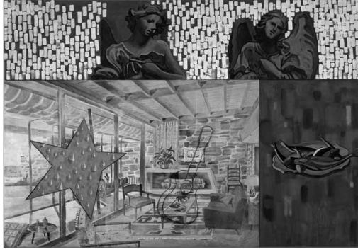
Resim 5. David Salle, Bay Şanslı, 1998, Tuval Üzerine Yağlıboya ve Akrilik, 244 x 335 cm, Saatchi Galerisi Koleksiyonu.

Hasan Bülent Kahraman'a göre (2002), postmodernist yapıt sıradan, gündelik olan etrafında oluşmaktadır ve bu nedenle eklectisizm yapıtın kurucu öğesi durumundadır. Kaynak ve üslup olarak yaratılan çeşitlilik, çok katmanlılık, toplumda yaşanan teknolojik gelişmelerin büyük oranda etkisinde ve bu eğilimlerin dolayımında oluşmaktadır. Yaşanan değişim ve gelişimler yüksek kültür ve alt kültür olarak bilinen yapılar arasındaki mesafeyi oldukça birbirine yaklaştırmış ve sanatta bunları birbirine karıştırmış, melezleştirmiş, estetik sınırlar yok edilmiş görünmektedir. Sanatın çalışma alanı, reklam, televizyon imgeleri, günlük yaşam parçaları, cinsellik, soykırım gibi oldukça değişken ve genişlemiş durumdadır. Her şey sanatın konusu olabildiği gibi, her türlü malzeme de klasik anlayışın aksine yüzey üzerinde aynı anda var olabilir, farklı anlamlarla izleyicinin karşına çıkabilir. "Parçalanma, belirlenemezlik ve bütün evrensel (ya da sevilen deyimle) "bütüncül" (totalizing) söylemlere karşın derin bir güvensizlik postmodernist düşüncenin temel özellikleri olmuştur (Harvey 2003: 21).