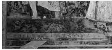
Resim VII: Piero Della Francesca, Aziz Burgundlu Sigismund, 1451, duvar resmi. http://www.michaelarnoldart.com/Piero%20della%20Francesca%20Artist.htm