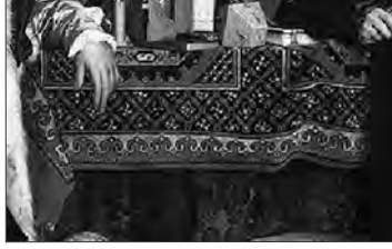
Resim V: Fransız Elçiler Jean de Dinteville and Georges de Selve , 1533,tuval tempera ve yağlıboya, 207.209 cm. , http://www.visual-arts-cork.com/old-masters/hans-holbein-the-younger.htm

Genç Hans Holbein'in Londra National Gallery' de bulunan 1533 tarihli "Fransız Elçiler" tablosunda kendi adını alan bu halıların karakteristik bir örneğini, masa üzerine serilmiş olarak gerçekçi bir biçimde resmetmiştir (Resim V). Resmin arka planında ayakta duran iki elçi, ortada kollarını yerleştirdikleri masanın üzerindeki halı ile birbirleri arasında ilişki kurmaktadır. Holbein görsel dili bir dizi sembollerin üzerinden kullanmıştır. Resmin ön planında deformasyona uğramış bir kafatası, resme fizikötesi bir anlam kazandırmıştır. "Kafatası da resmin geri kalanı gibi resimlenseydi, fizikötesi bir anlamı kalmazdı, o da öbürleri gibi nesne, ölü iskeletin bir parçası olurdu" (Berger,1995:91). Ölümlülük teması, yapının geneline ve hakim olan gerçekçi yaklaşımla çelişen şaşırtıcı bir yolla ortaya konulmuştur. Resmin ön planı ve arka planı arasına yerleştirilen deforme edilmiş bir kafatası, izleyici ve figürler arasına somut ve soyut bir mesafe koymaktadır. İki figür birbirleriyle, kafatası ise izleyici ile ilişki kurar.