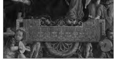
Resim VIII: Andrea Mantegna, San Zeno altar resmi, merkez panel, 1459, ahşapüzerine yağlıboya, 212.125 cm., http://en.wikipedia.org/wiki/Andrea_Mantegna

Daha sonra İspanya ve Kuzey Avrupa resimlerinde de bu tip halıların betimlenmesi etkileri görülmektedir. Giotto ve Donatello gibi Mantegna'da resimlediği dinsel sahnenin gerçekte nasıl olduğunu imgeleminde tam bir açıklıkla canlandırmaya çalışmış olmalıdır. Antik biçimleri ayrıntılarıyla betimleyen Mantegna, 15. yüzyıl ortalarında antik sanatı canlandırma hareketine büyük ivme kazandıran sanatçıların başında gelir. Verona'da San Zeno kilisesine yapmış olduğu altar resminde eski Roma yapılarındaki mimari öğeleri ayrıntılı ve doğru olarak betimlemiştir. Perspektifte bakış noktasını kompozisyonun alt kenarının