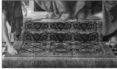
Resim IX: Verrocchio, Meryem Vaftizci Yahya ve Donatus'la, 1483, ahşap üzerine yağlıboya, 189.191 cm., http://en.wikipedia.org/wiki/Oriental_carpets_in_Renaissance_painting

I.Tipe giren Küçük Örnekli Holbein halıları, konturları belirsiz düğümlü sekizgenlerle, kaydırılmış eksenlerde alternatif sıralanmış ve rûmi palmetlerden meydana gelen baklavalardan ibaret zeminlerden oluşur. Bunlar adına en uygun ve karakteristik halı olup aynı zamanda türünün en eskisidir. Zemini koyu renkli, çok defa kırmızı olan bu halılar on beşinci yüzyıl ortasından on altıncı yüzyıla kadar tablolarda görülmektedir.