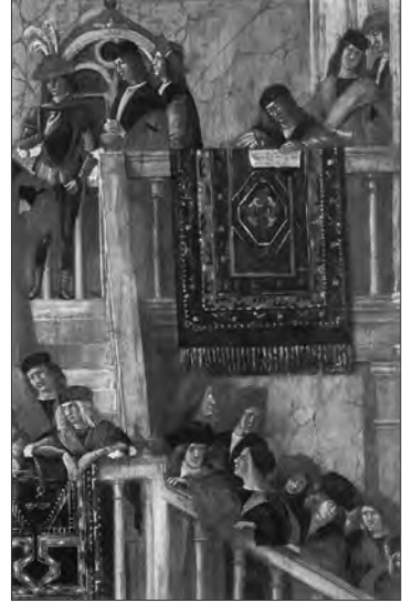
Resim X-XI: Vittore Carpaccio, Nişanlıların buluşması (ayrıntı), Pilgrims'den ayrılış (ayrıntı), 1495, tuv. tempera, http://www.wga.hu/frames-e.html?/html/h/holbein/hans_y/1531/index.html .

Venedik Akademide, Carpaccio'nun 1495 tarihli Azize Ursula serisi'nde büyük örnekli Holbein halıları sanatçı tarafından dönemin yükselen değerlerinden biri olarak kompozisyonun ön planında resimlenmiştir (Resim X-XI).