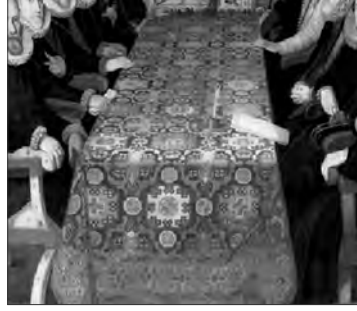
Resim XII: Juan Pantoja de la Cruz, Somerset Malikânesinde Konferans, 1604, tuvale yağ.boya 244,5. 307,5 cm., http://wapedia.mobi/en/Oriental_carpets_in_Renaissance_painting?p=1