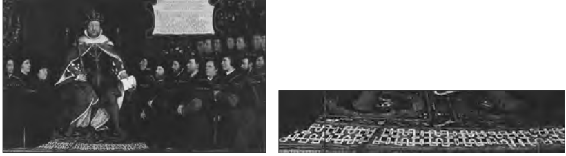
Resim VI: VIII. Henry, berberler ve cerrahlar, 1540, meře zerine yađlıboya., 180.3 × 312.4 cm, http://www.lib-art.com/artgallery/12392-henry-viii-and-the-barber-surgeons-hans-the-younger-holbein.html

Saray portrelerinde kullanmış olduđu kompozisyonlarında grkemliliđin, debdebenin sınırsızlıđında o dnem İngiltere'sinin gçllđn vurgular. Kralın giysileri, bulunduđu mekan en ince ayrıntılarına varıncaya kadar resmedilmiřtir. 1540 tarihli VIII. Henry portresinde (Resim VI) n hazırlık alıřmalarından oluřan birok desen, bu zenli arayıřın bir gstergesidir.