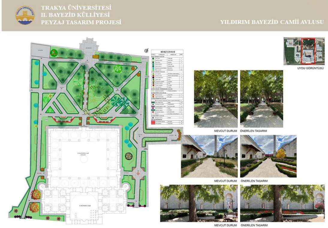
Şekil 8. Bayezid Camii Avlusu İçin Öneri Peyzaj Tasarım Projesi (Orijinal, 2021)

kullanılmıştır. Cami ve cami önünde yer alan tüm bahçelerde mevcutta yer alan çalılardan kurumuş olanlar çıkarılarak, eksik kalan yerlere süreklilik etkisini sağlamak için aynı bitki türleri ile tamamlamalar yapılmıştır. Caminin ön bahçesinde genellikle tesadüfi şekilde yerleştirilmiş olan güller iki parselde toplanarak görsel bütünlük sağlanmıştır. Şekil 8'de Bayezid Camii avlusu için öneri peyzaj tasarım projesi ve üç boyutlu görseller yer almaktadır.