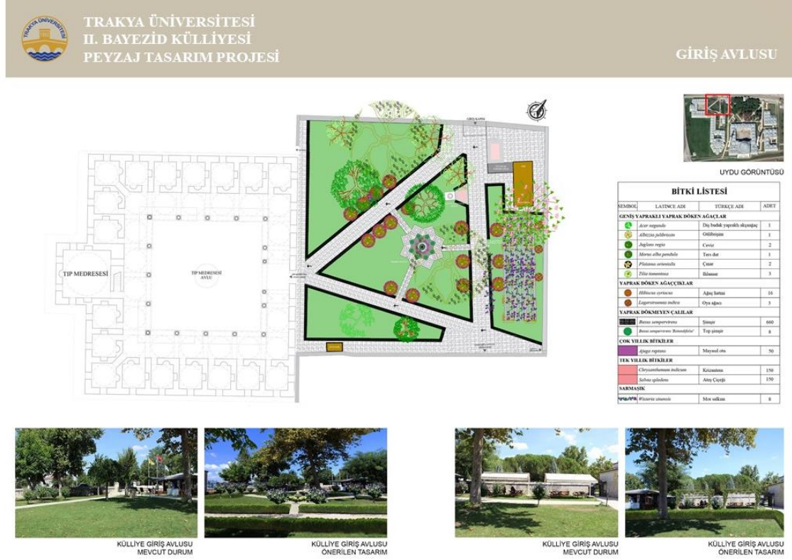
Şekil 6. Külliye Giriş Avlusu İçin Öneri Peyzaj Tasarım Projesi (Orijinal, 2021)

padişaha ait tavuklar olarak bilinen sultan tavukları, geçmişten bugüne taşınan bir gelenek olarak, öneri peyzaj tasarımında da korunması ve yaşatılması gereken bir öğe olarak değerlendirilmiştir. Şekil 6'da külliye giriş avlusu için öneri peyzaj tasarım projesi ve üç boyutlu görseller yer almaktadır.