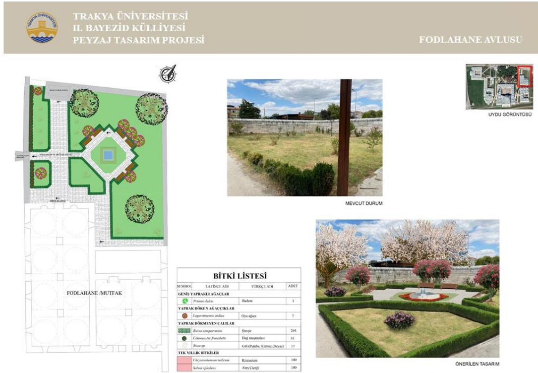
Şekil 10. Fodlahane Avlusu İçin Öneri Peyzaj Tasarım Projesi (Orijinal, 2021)