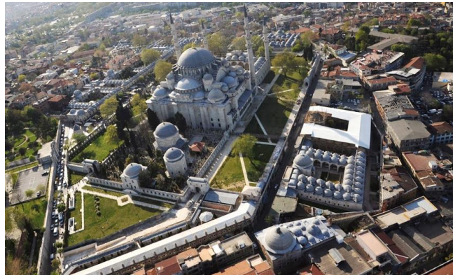
Şekil 1. Fatih Cami ve Külliyesi (URL-1)

Külliye'lerin bir mimari kompleks olarak şehircilik anlamında yapılar topluluğu olarak ele alınmaları, Osmanlı Devleti'nin Edirne'ye ve İstanbul'a yerleşmesiyle başlamıştır. 15. yüzyılın sonlarından başlayarak, 18. yüzyılın ortasına kadar, bu mimari kompleksler, İstanbul ve Edirne' de ve İmparatorluğun daha birçok yerinde meydana getirilmiştir (Akozan, 1969, s.303-308). Bu komplekslere bir örnek, İstanbul'un fethinden sonra Fatih Sultan Mehmet'in yaptırdığı Fatih Camii ve Külliyesi'dir. Fatih Camii'nde, cami etrafında düzenlenen on altı medrese, tabhane, kervansaray, darüşşifa ve türbe yapılarının düzgün bir mimari kompozisyon içinde bir araya getirilerek "anıtsal külliye" fikri uygulanmıştır (Şekil 1) (URL-1). Bu anıtsal külliye fikri, Edirne'de II. Bayezid Külliyesi'nde de yansıtılmıştır (Kuban, 1973, s.182).