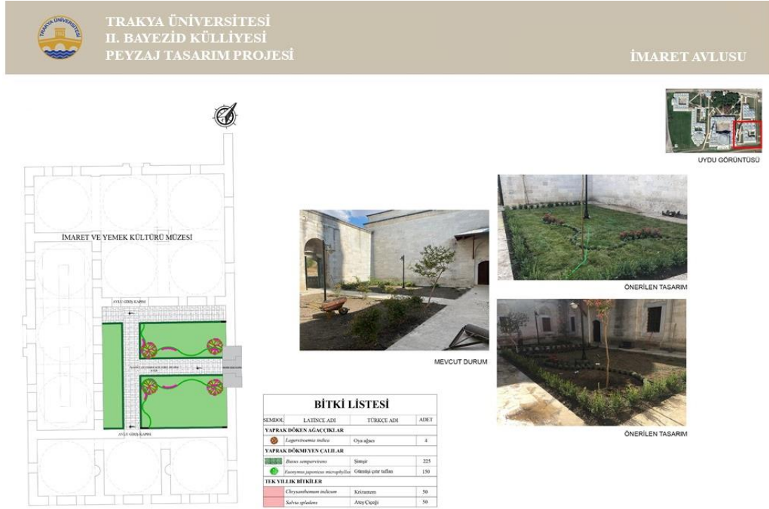
Şekil 9. İmaret Avlusu İçin Öneri Peyzaj Tasarım Projesi (Orijinal, 2021)

Lagerstroemia indica kullanılmıştır. Şekil 9'da imaret avlusu için uygulanan peyzaj tasarım projesi ve görselleri yer almaktadır.