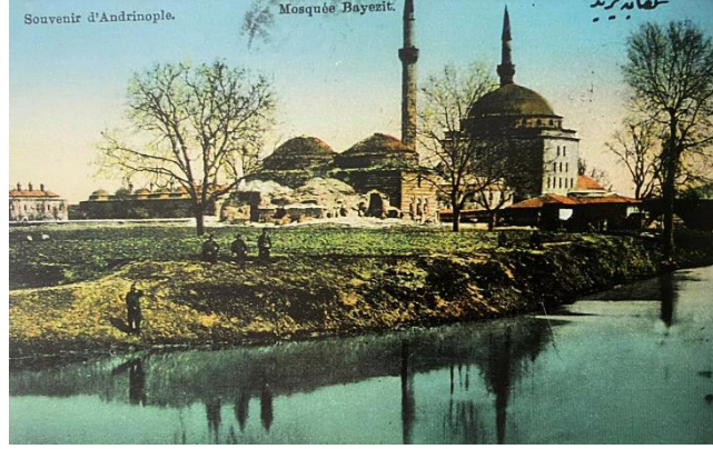
Şekil 3. 1800'lerin Sonunda II. Bayezid Külliyesi (Şengül ve Bilal, 2007, s.24)

ve külliye Tunca Nehri üzerinden birbirine bağlayan işlevini sürdürmeye devam etmektedir.