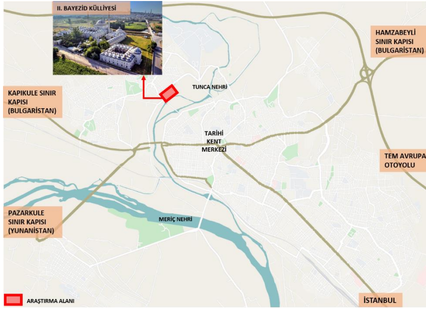
Şekil 2. II. Bayezid Külliyesi, Edirne Kentiçi Konum (Google Earth, 2021 verisinden uyarlanmıştır)

Araştırmanın yöntemi veri toplama, mevcut durum analizi ve projelendirme olmak üzere 3 aşamadan oluşmaktadır. Birinci aşama olan veri toplamada öncelikle külliye kavramı, Osmanlı bahçelerinin bahçe düzeni ve özellikleri incelenmiş ve araştırma alanını oluşturan II. Bayezid Külliyesi hakkında literatür taramaları gerçekleştirilmiştir. İkinci aşamada külliye bahçesinin yapısal ve bitkisel peyzaj öğelerine ilişkin mevcut durum analizleri yapılmıştır. Trakya Üniversitesi Yapı İşleri ve Teknik Daire Başkanlığı'ndan elde edilen yapısal ve bitkisel materyale ait konum bilgileri içeren vaziyet planı temin edilmiştir. Alanda yerinde yapılan incelemeler ile mevcut ağaç ve çalıların tür ve alt tür bilgileri ile mevcut yapısal öğeler (döşeme malzemesi, donatı vb.) vaziyet planına aktarılmıştır. Üçüncü aşamada literatür bilgileri doğrultusunda alanın tarihsel kimliğine uygun peyzaj tasarımı gerçekleştirilerek alana özgü yapısal ve bitkisel öneriler geliştirilmiştir. Proje çiziminin ardından yapılan tasarım üç boyutlu görsellerle desteklenmiştir.