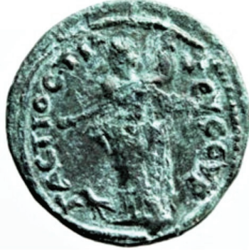
Figür 19: MS 3. yüzyıla tarihlendirilen, arka yüzünde Zeus Syrgastios betimlemesi bulunan Tieion darbı bronz sikke.