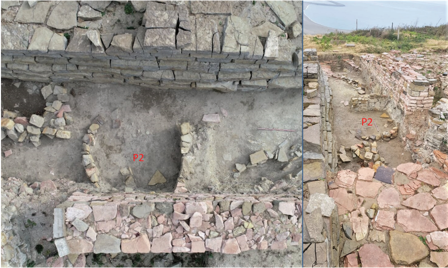
Figür 4: Yuvarlak planlı konutlardan P2 yapısı.