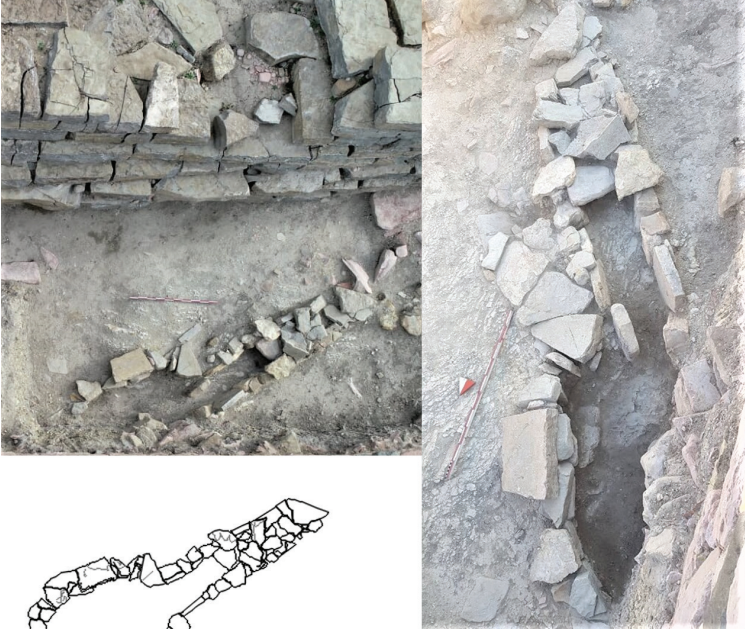
Figür 6: Arkaik Dönem'e tarihlendirilen demir ocağı.