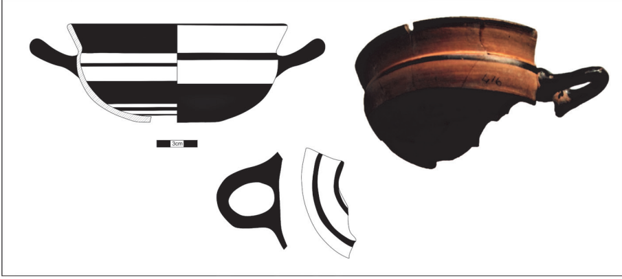
Figür 9: Arkaik Dönem konutlarında bulunan bir İonia kylixi.