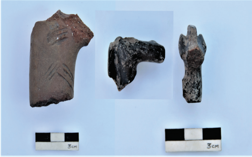
Figür 14: P1 yapısında bulunan pişmiş toprak at figürünü parçaları.