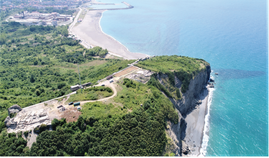
Figür 1: Tieion Akropolisinin doğudan görünümü.