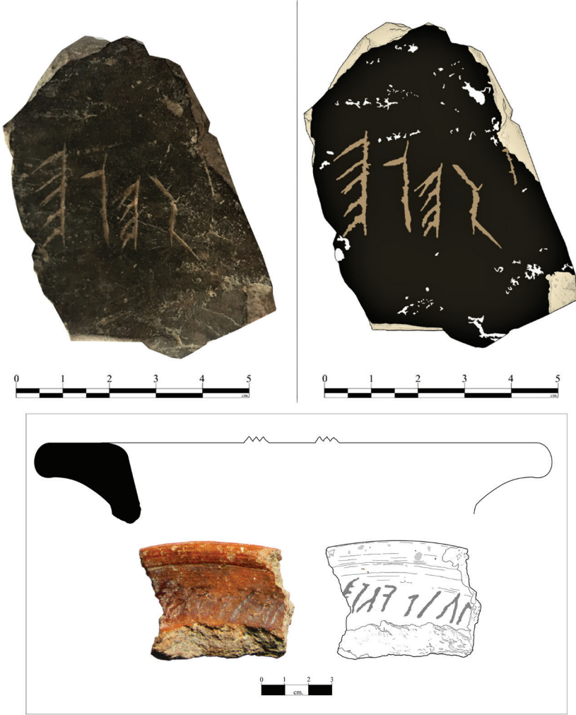
Figür 13: Üzerinde Phrygce yazıtlar bulunan pişmiş toprak kap örnekleri.