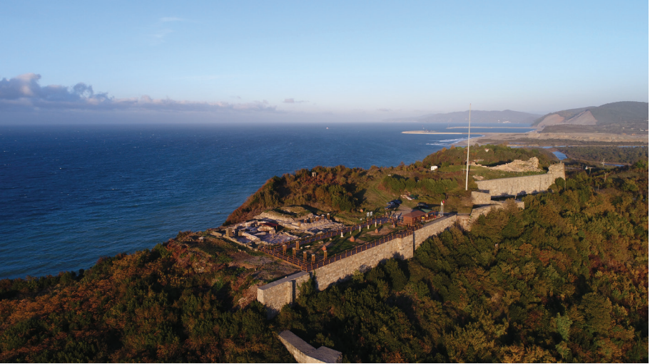
Figür 2: Tieion Akropolisi ve Billaios Nehri'nin batıdan görünümü.