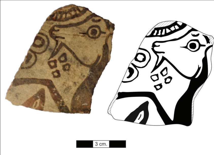
Figür 8: Miletos Orta Yaban Keçisi 2 evresi'ne tarihlendirilen seramik parçası.