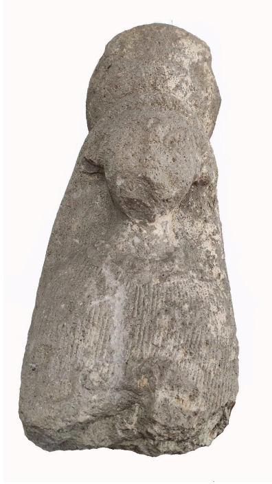
Figür 18: Alaplı'da bulunan Kybele heykeli.