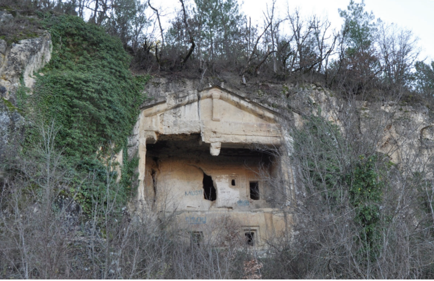
Figür 17: Karakoyunlu Köyü Gerdekboğazı kaya mezarı.