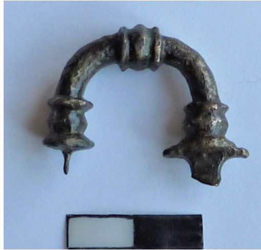
Figür 15: Gökçebey, Üçburgu'da nehir limanı kazıları sırasında bulunan bronz Phryg fibulası.