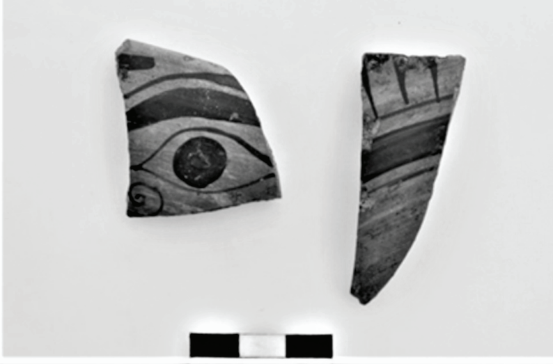
Figür 10: P1 yapısının 2. evresinde bulunan gözlü kylix örneği.