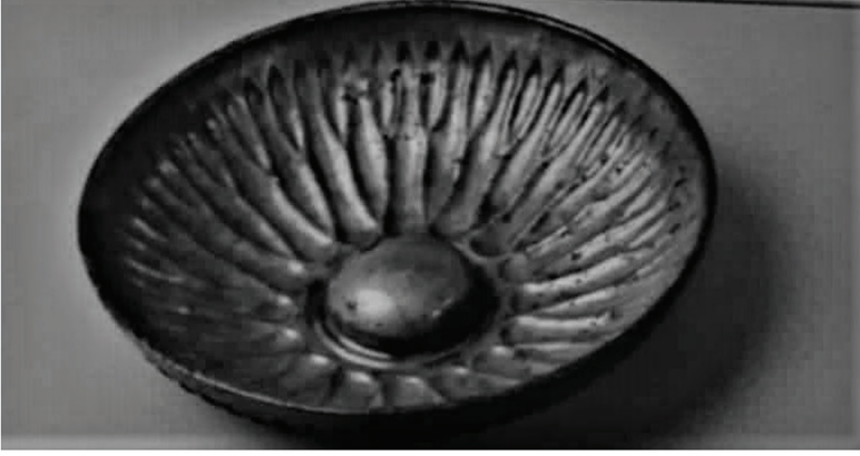
Figür 16: Gökçebey’de bir tümülüsde bulunmuş omphaloslu bronz kase.