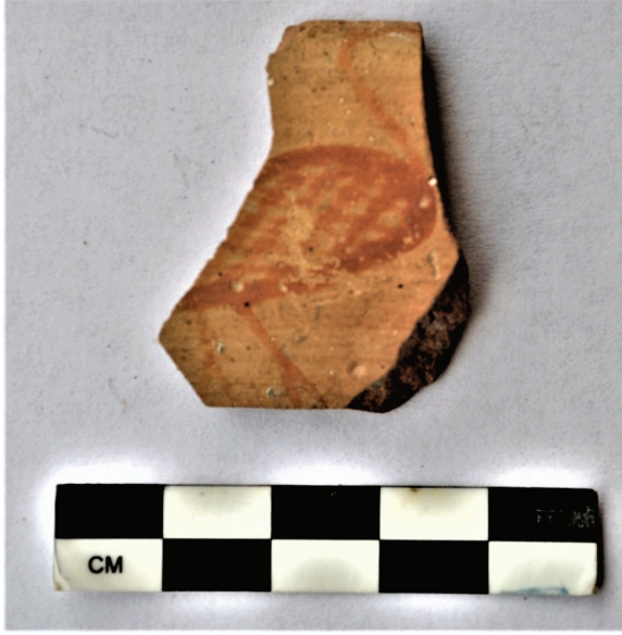
Figür 11: Akropolde bulunan Arkaik Dönem kuşlu kase parçası.