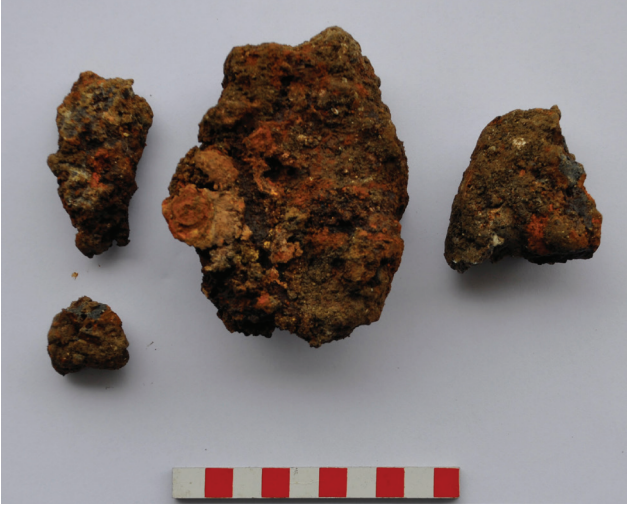
Figür 7: Arkaik Dönem ocağında bulunan demir curufları.