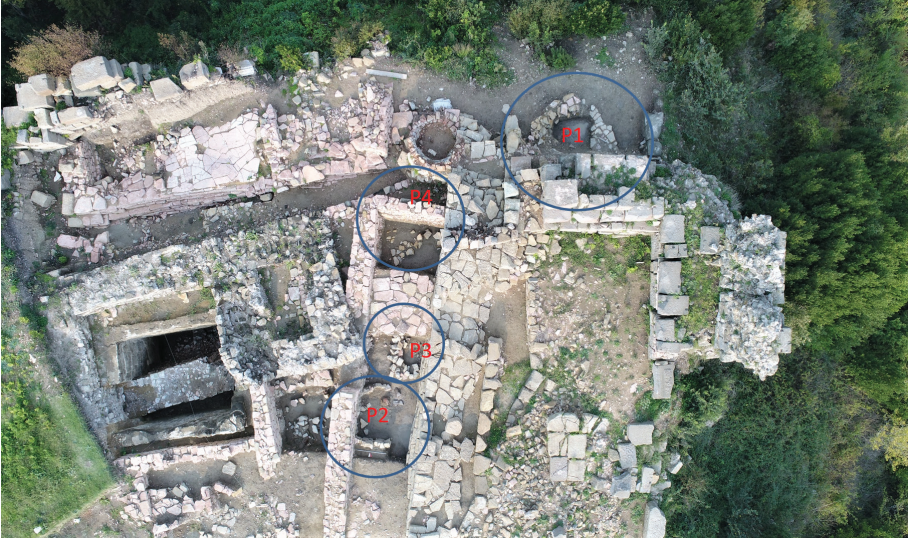
Figür 3: Akropolde bulunan Arkaik Dönem konutlarının konumları.