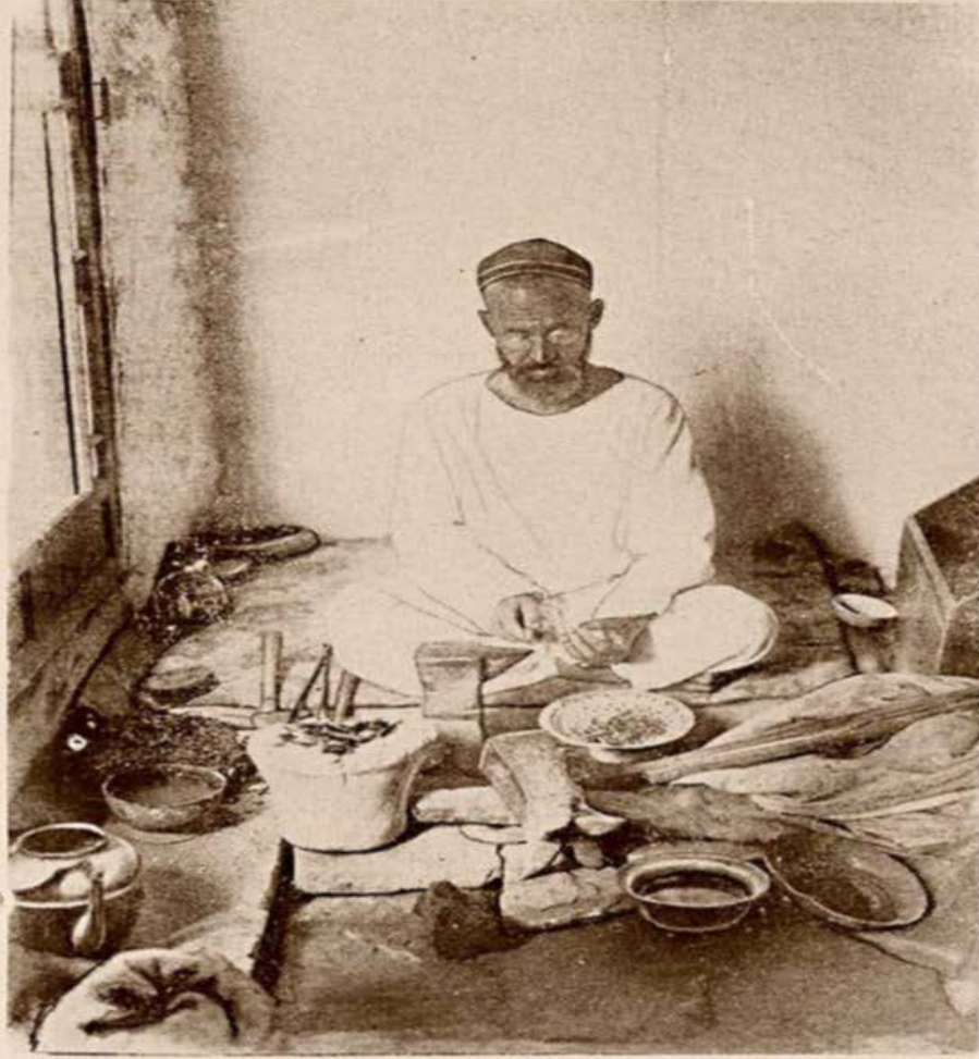
Рис. 21. Бухара. Ювелир в своей мастерской