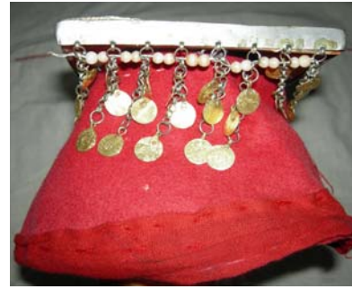
Şekil 11. Takka ve tepelik

Çeki: Kırmızı renkli olan al çekinin kullanım amacı fesi tutmaktır ve yörede çekiye "al çeki" de denmektedir. Genellikle ipekli kumaştan yapılmaktadır. Geçmişte yanlardan kâkül çıkarıldığı, arkada ise çok örgülü saçlar olduğu söylenmektedir. Çeki, ipekli veya pamuklu el dokuması kumaştan yapılmaktadır. Çeki fes'in üzerine gelinler tarafından bağlanmaktadır. Fes'in ön kısmını kapatacak biçimde katlanarak iki ucu takkanın arkasından bağlanmaktadır ve böylece takkanın baştan düşmesi engellenmektedir. Kıbrısçık'da kızlar "dallı çeki" adında etrafında çiçek olan çekileri takmaktadırlar ama çeki katlandığı için çiçekleri görülmemektedir. Yörede gelinler kırmızı çeki kullanırken kızlar bordo renkli dallı çeki adında etrafında çiçek olan fakat katlandıklarında çiçekleri görülmeyen çekileri kullanmaktadırlar. Geçmişte gelinlerin düğünlerinde başlarına örtülen ipekli saten kumaştan hazırlanan kırmızı tütekleri düğünden sonra üçgen olarak ikiye bölerek, çeki olarak kullandıkları belirtilmektedir. Günümüzde üçgen formundaki çekiler kendi etrafında katlandıktan sonra önde alından,