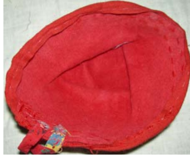
Şekil 8. Fes