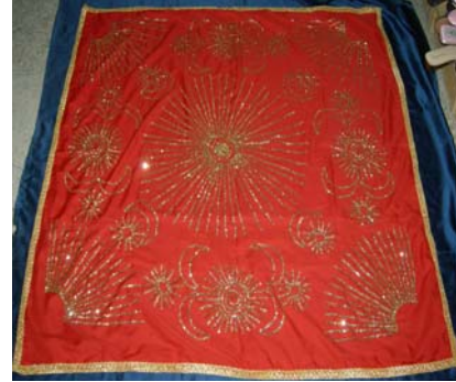
Şekil 20. Al (çatki)