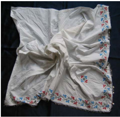
Şekil 15. Nakışlı yazmanın genel Görünümü