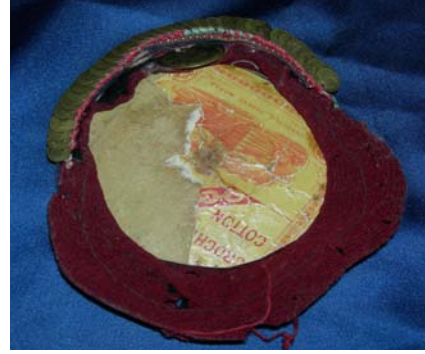
Şekil 18. Mudurnu İlçesinde kullanılan fes'in önden görünümü (a), fesin içi (b)