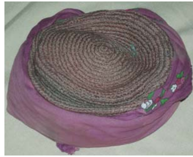
Şekil 3. Çeki'nin fes'e bağlanması

Çeki; Genellikle kırmızı rengin tercih edildiği çeki tülbent, yazma türünde kumaştan yapılmış başörtüsünün fes'in alın kısmına bağlanması ve uçlarının fesin içine saklanması ile kullanılan bir örtüdür. Çekinin üzerine sayısı maddi duruma bağlı olarak altın paralar takılmaktadır (Şekil 2,3).