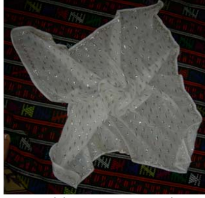
Şekil 17. Tel kırmanın genel görüntüsü