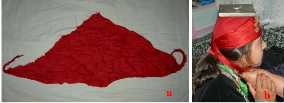
Şekil 12. Çeki'nin genel görünümü (a), çeki'nin kullanımı (b).

arka enseye kadar fesin etrafından dolandırılarak, arkadan çapraz olarak geçirilmekte ve önde çene altında bağlanmaktadır (Şekil12).