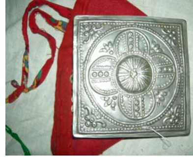
Şekil 9. Tepelik