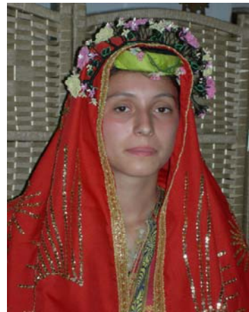
Şekil 22. Mudurnu İlçesi Gelin başı