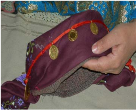
Şekil 4. Baş altınlarının fes'e yerleştirilmesi

Örtme; Pamuk dokuma düz beyaz renkli başörtüsüdür. Kına gecesini gelinin başına örtülerek kınası yapılmaktadır. Örtme üzerine ise al konmaktadır. Ayrıca dışarı çıkarken de örtme bağlanmaktadır. Çarşıya ya da köyden köye giden kadınlar başlarına örtme örtmektedirler.