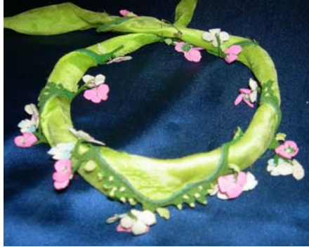
Şekil 19. Çeki