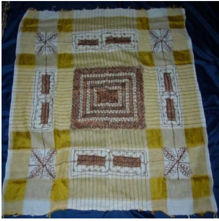
Şekil 13. Çemberin genel görünümü

Tel Kırma: Tel kırma işlemeli çemberler kullanılmaktadır. Çemberler açık biçimde takkanın üzerine oturtulmaktadır. Yanlara sarkan iki ucu ensede iğne ile tutturulmaktadır. Bunun yanı sıra açık bırakarak da kullanılmaktadır (Şekil 17).