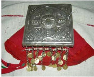
Şekil 10. Tepelik ve fes