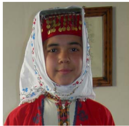
Şekil 16. Kıbrısçık İlçesi Geleneksel Kadın Başlığı