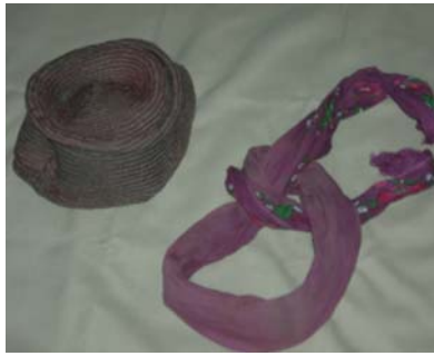
Şekil 2. Fes ve çeki