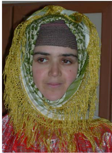
Şekil 6. Dörtdivan İlçesi kına gecesini başlığı