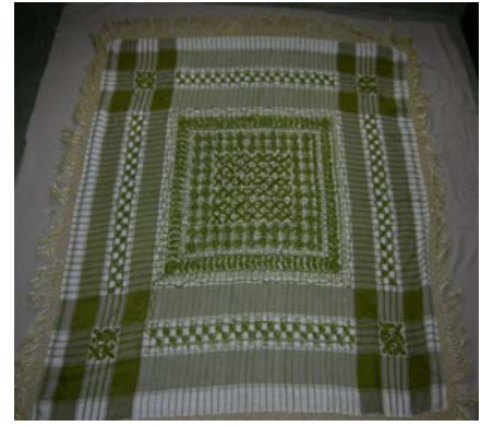
Şekil 5. Çember (başörtüsü)