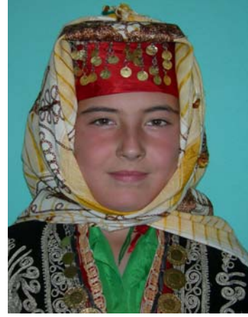
Şekil 14. Kıbrısçık İlçesi Gelinbaşı