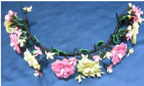
Şekil 21. Gelin tacı