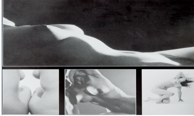
FOT.2 MUSTAFA KAPKIN