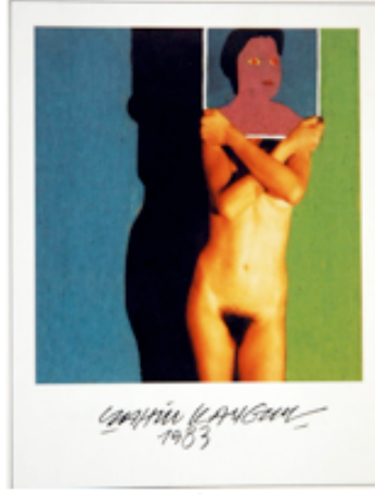
FOT.4 ŞAHİN KAYGUN