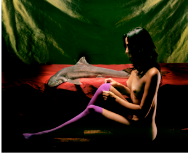
FOT.16 SAYGUN DURA