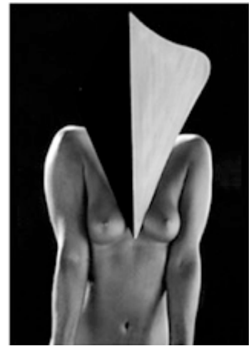
FOT.8 İBRAHİM GÖĞER