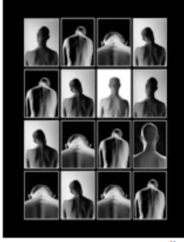
FOT.10 MEHMET KOŞTUMOĞLU