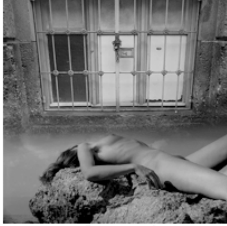
FOT.3 AHMET ÖNER GEZGİN