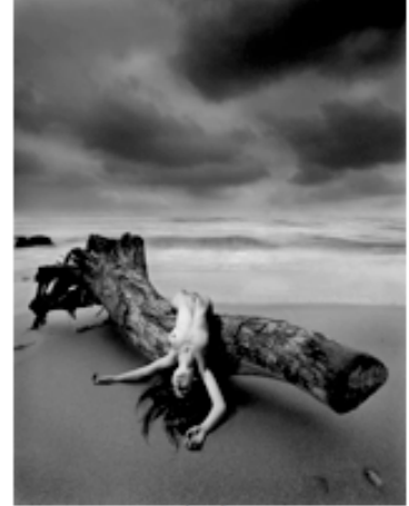
FOT.5 NURİ BİLGE CEYLAN