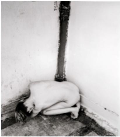
FOT.6 ÇERKES KARADAĞ