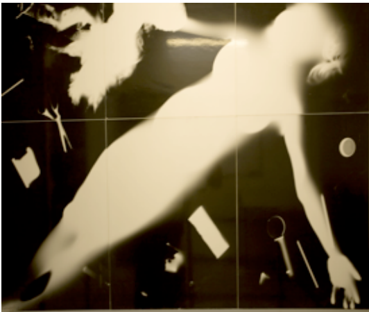
FOT.14 MEHMET KOŞTUMOĞLU