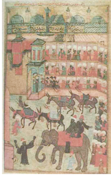
Şekil 16. 1582 Şenliğinde hayvanların gösterisi TSM B.200 (Ergenekon, 1999:34)

yeri olan ve Orta Asya'dan gelen, Osmanlı dönemi minyatürlerinde de görülen bu örtülerde, büyük olasılıkla tepme keçe tekniği kullanılmıştır (Ergenekon, 1999:34).