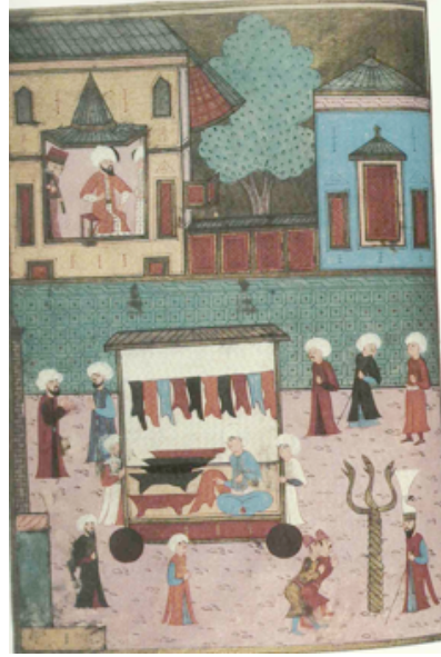
Şekil 15. Sûrnâme-i Hümayun 1582 tarihli minyatür, padişahın önünden tirşecilerin geçişi (Özdemir ve Kayabaşı, 2007:45)

Minyatürlerin değişik sahnelerinde, çizmeciler, saraçlar ve çeşitli meslek grupları görülmektedir (Özdemir ve Kayabaşı, 2007:44).