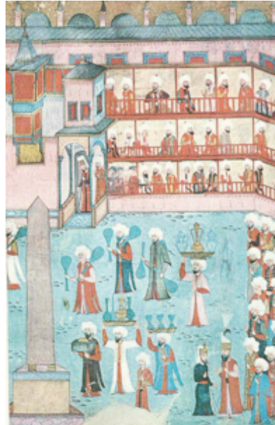
Şekil 8. Câmgerân Loncası elemanlarının geçiş töreni, Sûrnâme-i Hümayun 33b, Topkapı Sarayı Müzesi, (Bayramoğlu, 1974:2)

Şekil 8'de Sûrnâme-i Hümayun 33b sayfasında, Câmgerân Loncası elemanlarının geçiş töreni görülmektedir. Bir önceki minyatürdeki gibi şişeler düz ve eğik kaburgalıdır. Ayrıca ortalarından boğumlu cam kaplar yer almaktadır (Özgümüş, 2000:72).