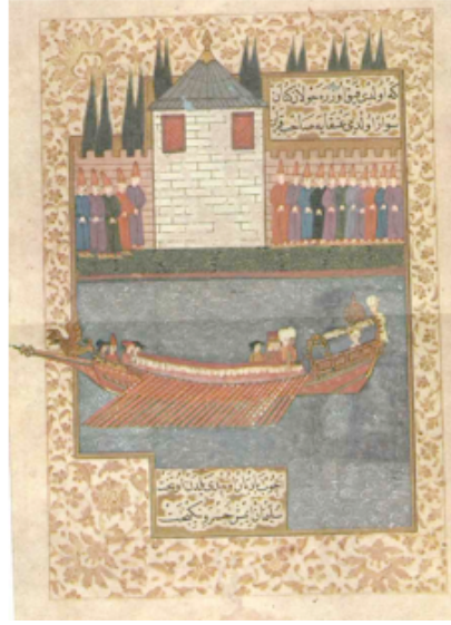
Şekil 4. Sultan II. Osman yeni yapılan kasırda ve saltanat kayığında, Nâdîr, Şehnâme, 1620 civ. TSM,H. 1124, y. 73b-74a, (Anonymous, 1965 23)

Türklerin Orta Asya'dan getirdikleri altın taht geleneğinin Osmanlı İmparatorluğu döneminde de sürdüğü bilinmektedir. Günümüze gelebilen bir altın taht örneği Topkapı Sarayı Müzesi'nde Hazine Dairesinde sergilenen altın kaplama zebercetlerle süslemeli tahttır. Ayrıca minyatürlerde ve padişah portrelerinde de farklı altın tahtlar görülmektedir (Pınarbaşı, 2004:77). Ahşap el sanatı ürünlerinden olan taht, hükümdarın oturduğu özel sandalye, koltuk, makam anlamı taşımaktadır. Taht yapımı 16. yüzyılda altın çağını yaşamıştır (Barışta, 1998:78).