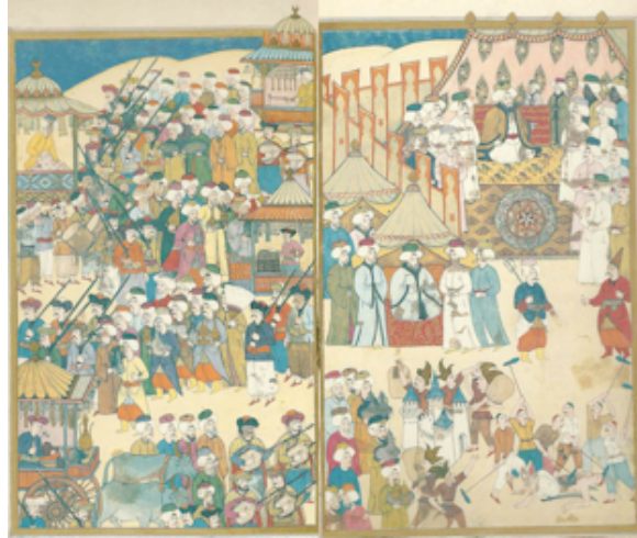
Şekil 13. Sünnâme, Esnaf alayının geçişi, y. 120b-121a (Atıl, 1999:154-155)