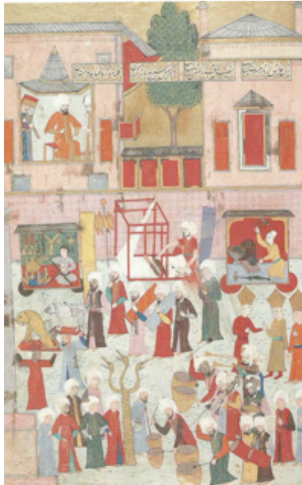
Şekil 1. Bir kısım esnafın III. Murad’ın şehzadesinin sünnet düğünü şenliklerinde At Meydanı’ndan geçişi ve mehterin çalması, "Şehinşehnâme", [TSM, B200], (And, 2004:66)

Sanatları ” adlı eserinde yer alan, Şekil 1’de görülen minyatürde bir kısım esnafın III. Murad’ın şehzadesinin sünnet düğünü şenliklerinde At Meydanı’ndan geçişi ve mehterin çalması tasvir edilmektedir. Minyatürde padişah, kumaş dokuyan, demir döven, eğer kayışı yapan esnafı seyrederken betimlenmiştir. Kumaş dokuyan ustanın tezgâhı dikey, tek gücülü, basit bir tezgâh olup, o dönemde kullanılan kumaş tezgâhlarına örnek teşkil etmesi açısından ilginçtir. Tezgâhta çözgünün bağlandığı yer, mekik, tarak ve gücü sistemi, dokunmuş kumaşın sarıldığı kumaş levendi belirgin bir şekilde resmedilmiştir. Demir döven ustanın çekici, örsü, körüğü, ocağı, demiri soğutmakta kullandığı su kabı, sıcak demiri dövdüğü zemin ayrıntılı olarak anlatılmış olup, sıcak demirciliğin yapıldığı görülmektedir. Kayışlar, at koşum takımlarının en önemli parçasıdır. Eğer kayışı yapan ustanın duvarında yaptığı kayış çeşitlerinden örnekler asılıdır. Bu tasvirler, uğraşılan el sanatlarının o dönemdeki özelliklerinin ana hatlarıyla anlaşılmasını sağlamaktadır.