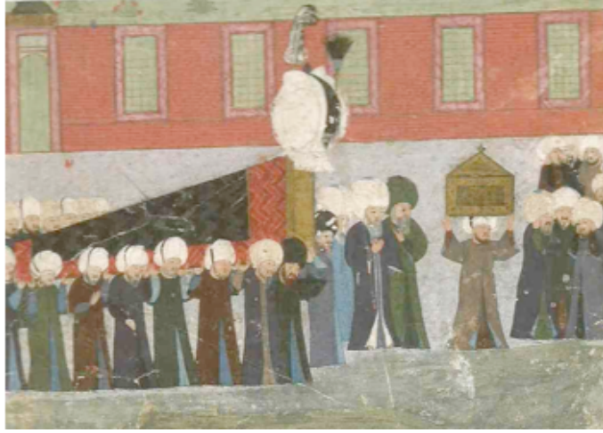
Şekil 9. Süleymannâme, 1579-89, Kanuni Sultan Süleyman'ın cenazesi (ayrıntı) Seyit Lokman, Chester Beatty Kütüphanesi Dublin, T.413, Y. 115 b, (Anonim, 2001:24)

Şekil 10'da Şehzade Mehmed At Meydanı'ndaki İbrahim Paşa Sarayına giderken betimlenmektedir. Şehzade, giyilmesi en uğurlu sayılan beyaz renkli bir kaftan giymiştir. Burada yerlere, atının nallarının altına, gümüş ve altın tellerle dokunmuş seraserler serilmiştir. Bu tür sahneler hem Sûrnâme' de hem de Şehinşehname' de görülmektedir (Anonim, 2001:28-29).