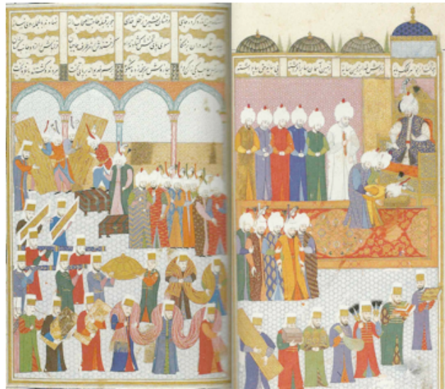
Şekil 2. Safevî Elçisi Tokmak Han III. Murad'ın huzurunda, "Şehinşehname", cilt I, Seyyid Lokman. İÜK F.1404, y.41b-42 a, (Uluç, 2006:484-485)

Uluç (2006:484-485)'un, "Türkmen Valiler, Şirazlı Ustalar, Osmanlı Okurlar" eserinde yer alan minyatür Seyyid Lokman tarafından yapılmıştır. Minyatürde (Şekil'2); Safevî Elçisi, III. Murad'ın huzurunda, getirdiği hediyeleri takdim ederken betimlenmektedir. Takdim edilen hediyeler arasında, kıymetli kitaplar, sorguçlar, sandukalar, kumaşlar ve çadır parçaları görülmektedir. Bu tarz işlerin dönem padişahına hediye ediliyor olmasından, 16. yüzyılda el sanatlarına ne kadar önem verildiği anlaşılmaktadır. Minyatürde başta padişahın kaftanı olmak üzere çeşitli tekstil ürünleri (halı, kumaş dokumlar), ahşap ürünler (taht, sandık, ahşap kutu) yer almaktadır. Hünkârın önünde serili olan halı, kırmızı zeminli bir madalyonlu Uşak halısı olup, tüm Türk halılarına temel olan sonsuzluk ilkesine göre yerleştirilen yarım madalyonlar dikkat çekicidir. Padişahı çevreleyen duvarların ve tahtın desenleri, 16. yy süslemelerinde sıkça kullanılmış desenlerdir. Padişahın kaftanındaki ayrıntılar şaşırtıcı olup, o dönem kaftan desenlerini yansıtmaktadır. Burada betimlenen halı, kaftan, taht ve duvar desenleri minyatürde konuyu tamamlayıcı dekoratif elemanlar olarak kullanılmıştır.