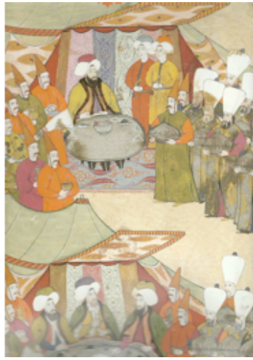
Şekil 12. İlk gösteriler ve yeniçerilere verilen pilav ve zerde ziyafeti, Sûrnâme-i Vehbi , Levni, Kültür Bakanlığı Topkapı Müzesi Kütüphanesi, Env.No 3593, (Anonim, 2000:18)

şenliğin birinci gününde yeniçerilere verilen pilav ve zerde ziyafeti konu edilmektedir. Saray mutfaklarının aşçıbaşları ve çaşnigirler, kapalı gümüş sahanlar içinde yemek servisi yapmakta; kahve, şerbet, gülsuyu ve buhur servisi yapan zülüflü baltacılar da çaşnigirlere yardım etmektedir. Sinilerin hepsinin gümüş olduğu bilinmektedir. Sahanlar dışında porselen, gümüş ve altın sürahi, gümüş sini ve mavi beyaz porselen kâseler ve tabaklar da bulunmaktadır. Porselen olmayan kaseler altın rengi ile tasvir edilmektedir (Choi, 2008:18-19).