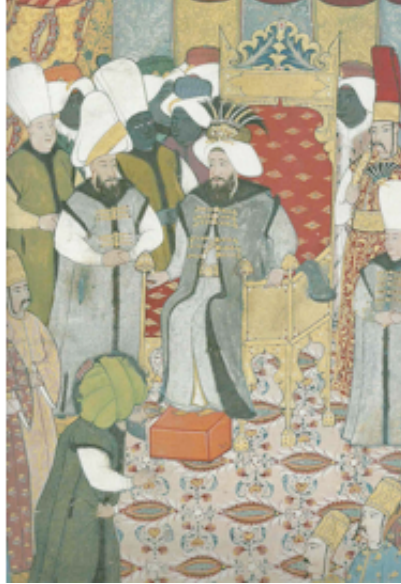
Şekil 6. Sûrnâme-i Vehbî, Levnî, (İrepoğlu, 1999:127)

Şekil 6'da Levni tarafından yapılan minyatürde tahtta oturan Sultan III. Ahmed, seyidleri ve devlet adamlarını kabul sahnesi görülmektedir. Padişah, yüksek arkalı altın tahtta, ayaklarını bir basamağa dayamış otururken betimlenmiştir (İrepoğlu, 1999:126).