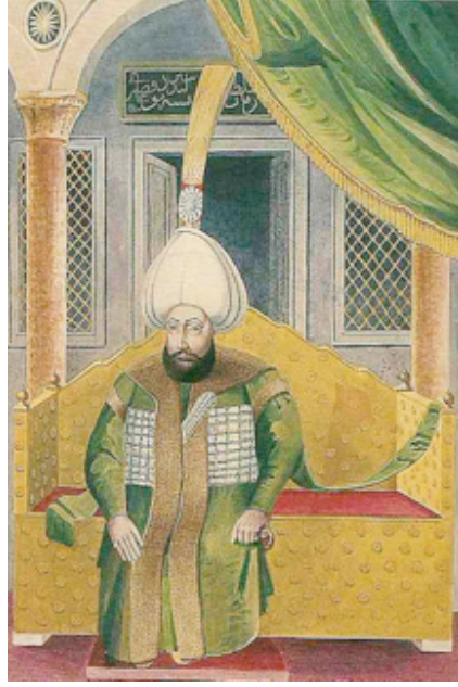
Şekil 5. Tahtında betimlenen Sultan IV. Mustafa, (Bağcı, 2003:150)

Şekil 6'da Levni tarafından yapılan minyatürde tahtta oturan Sultan III. Ahmed, seyidleri ve devlet adamlarını kabul sahnesi görülmektedir. Padişah, yüksek arkalı altın tahtta, ayaklarını bir basamağa dayamış otururken betimlenmiştir (İrepoğlu, 1999:126).