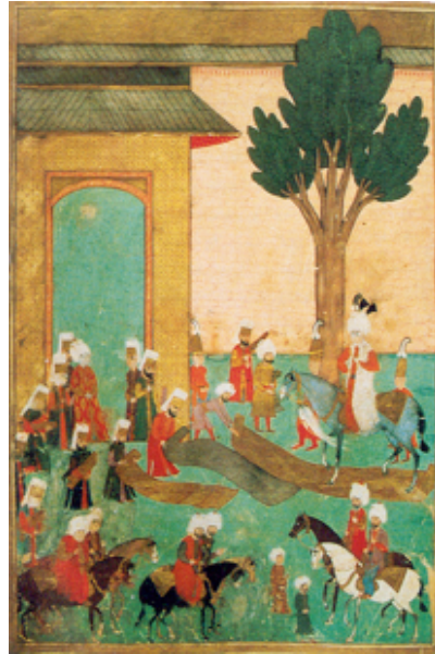
Şekil 10. Sûrnâme , yaklaşık 1582, Şehzade Mehmed'in At Meydanı'ndaki İbrahim Paşa Sarayına gelişi. Topkapı Sarayı Kütüphanesi, İstanbul, H1344, Y. 12a, Yeniçeriler, şehzadenin geçeceği yollara top top seraserlerle döşemişlerdi (Atasoy, 1997:28)

Şekil 10'da Şehzade Mehmed At Meydanı'ndaki İbrahim Paşa Sarayına giderken betimlenmektedir. Şehzade, giyilmesi en uğurlu sayılan beyaz renkli bir kaftan giymiştir. Burada yerlere, atının nallarının altına, gümüş ve altın tellerle dokunmuş seraserler serilmiştir. Bu tür sahneler hem Sûrnâme' de hem de Şehinşehname' de görülmektedir (Anonim, 2001:28-29).