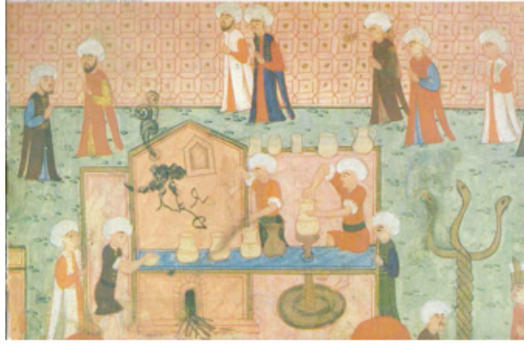
Şekil 14. Sûrnâme-i Hümayun 1582 tarihli minyatür. III. Murat Surnamesi'nden alınmıştır. [TSM:H:1344], (Anonim, 1990:129)