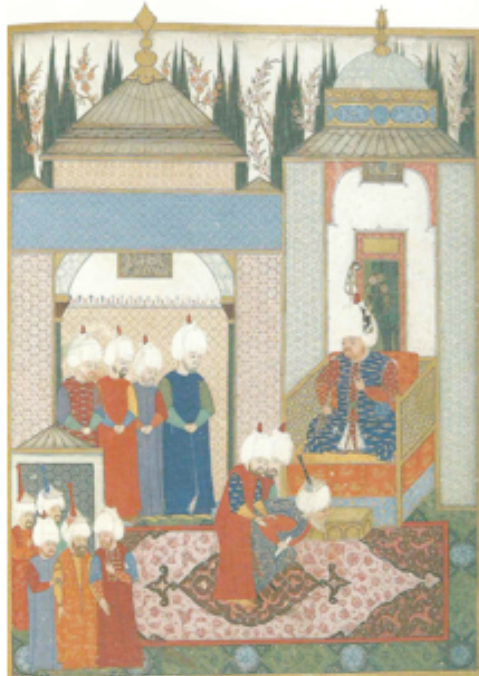
Şekil 11. Sultan II. Selim Safevî Elçisini Edirne sarayında kabul ediyor. Nüzhet el-esrâr el-ahbâr der Sefer-i Sigetvar, [TSM,H1339] (And, 2004:210)

Şekil 11'de Sultan II. Selim Safevî Elçisini Edirne sarayında kabul ederken tasvir edilmektedir. Minyatürde açık zeminli büyük bir madalyonlu Uşak halısı görülmektedir. Halının ortasında madalyon ve köşelerde ikişer kesik madalyon yer almaktadır. Madalyonların iç kısmı koyu renk üzeri rumilerle, zemin ise açık renk üzeri bitkisel motiflerle bezenmiştir.