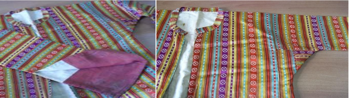
Şekil 17. Kol yırtmacı ve kuşlu kol detayı