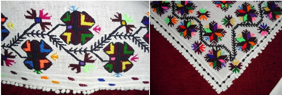
Şekil 3. Nakışlı Poğ- Eşek Nalı deseni (soldaki resim) ve Diken Gülü deseni (sağdaki resim)