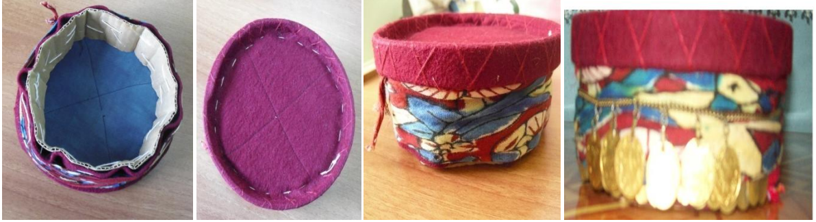
Şekil 11. Fesin iç yüzüne karton ve kasnak geçirilmesi ve üzerine takılan süsler