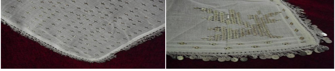
Şekil 14. Telli Poğ- Tek Geçim motifi (soldaki) ve Kaz Ayağı motifi (sağdaki)