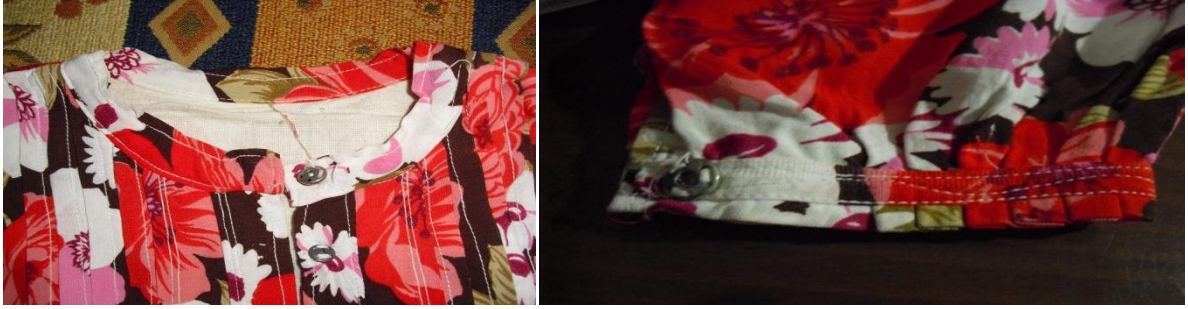
Şekil 6. Fistan- yaka ve kol ağzı detayı