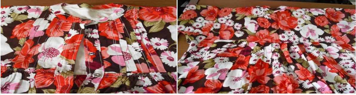
Şekil 5. Pamuklu kumaştan hazırlanmış fistanın ön ve arka robası