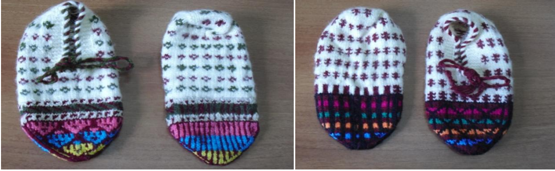
Şekil 10. Burunlu Çorap- Tarak motifi (soldaki resim) ve Güllü Burun motifi (sağdaki resim)

kuzu yününün yerini sentetik iplikler almıştır. Çorap örgüsünde kullanılan desenler, yörede “güllü burun”, “kaz ayağı”, “kuş ayağı”, “tarak” olarak adlandırılmaktadır.