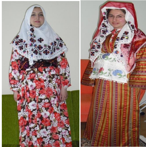
Şekil 1. Bolu İli Mengen İlçesi Kıyaslar Köyü Günlük Kadın Kıyafeti ve Gelin Kıyafeti

Yörede kullanılan günlük kadın kıyafeti; baş giyimi, iç giyim, dış giyim olmak üzere sınıflandırılarak incelenmiştir: