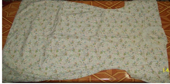
Şekil 4. Pamuklu kumaştan hazırlanmış tikolta/göynek

Pamuklu kumaşlardan evde kadınlar tarafından dikilir. Biçim olarak yuvarlak yakalı, kısa kollu, önü ve arkası kapalı olup kol altları (hareket serbestliği sağlaması amacıyla) kuşludur. Bel hattına kadar düz, etek ucuna doğru verev olarak genişler. Sanayi ürünlerinin piyasada olmadığı ve henüz yaygınlaşmadığı dönemlerde fanila- atlet yerine kullanılmıştır. Tikolta denildiği gibi “göynek” de denilmektedir.