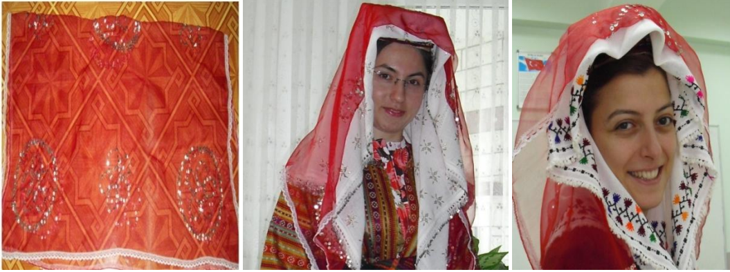
Şekil 15. Pullu Al (soldaki resim) altında Telli Poğ (ortadaki resim) ve Pullu Al altında Nakışlı Poğ (sağdaki resim) kullanılan gelin başları

Pullu al, nakışlı poğun ya da telli poğun üzerine atılarak kullanılır. Kırmızı renkte ipek ya da şifon kumaştan yapılır. Üzeri pullarla işlenir. Kenarlarına beyaz renkli ince şerit tül dikilir.