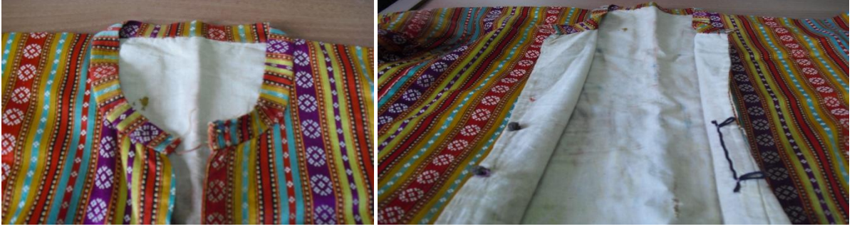
Şekil 16.Üç Etek (100 yıllık) yaka ve astar detayı

Diba, canfes, kutnu türü kumaşlardan yapılır. Yuvarlak yakalı olup göğüs hattından bel hizasına kadar önden düğmelidir. Bel hattından itibaren etek ucuna kadar yanlardan ve ortadan yırtmaçlarla 3 parçaya ayrılmıştır. Kıyafetin kollarında bilekten dirseğe doğru yaklaşık 10 cm yırtmacı vardır. Üç eteğin iç kısmı düz renkli patiska kumaşla astarlanır.