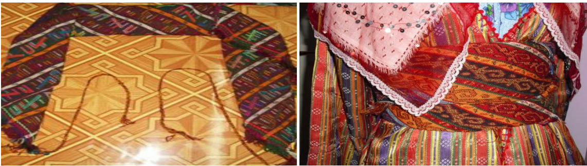
Şekil 9. Kuşağın Katlanarak Bel Çevresinde Kullanılışı