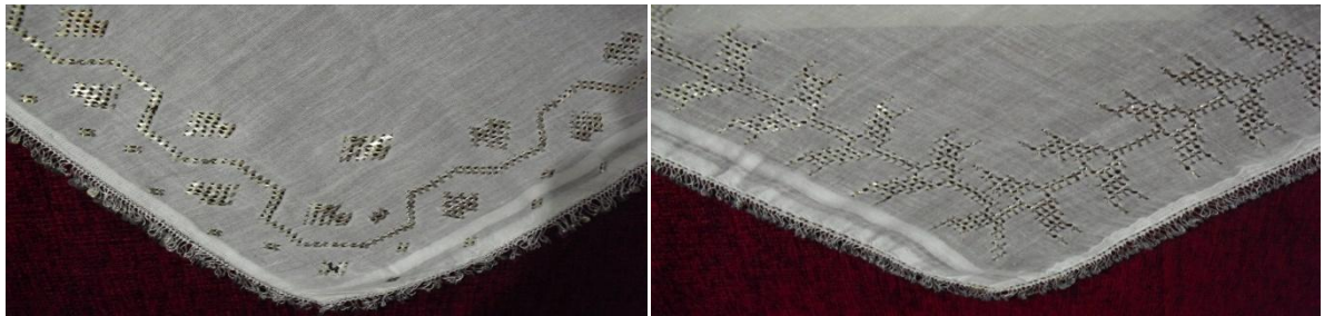
Şekil 13. Telli Poğ- Pul Oyası Motifi (soldaki) ve Eğri Büğrü Motifi (sağdaki)