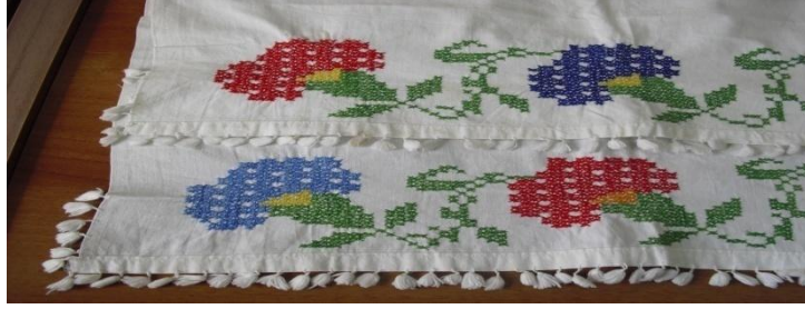
Şekil 18. Peşkir

Yörede gelinlerin kuşağının ön kısmına, kuşak üzerinden peşkir takılır. Peşkir, 90x47 cm. ebadında olup pamuklu beyaz kumaştan hazırlanır ve iki ucuna kanaviçe işlenir. Peşkirin kenarlarına iplerden hazırlanmış küçük püsküller dikilerek süslenir.