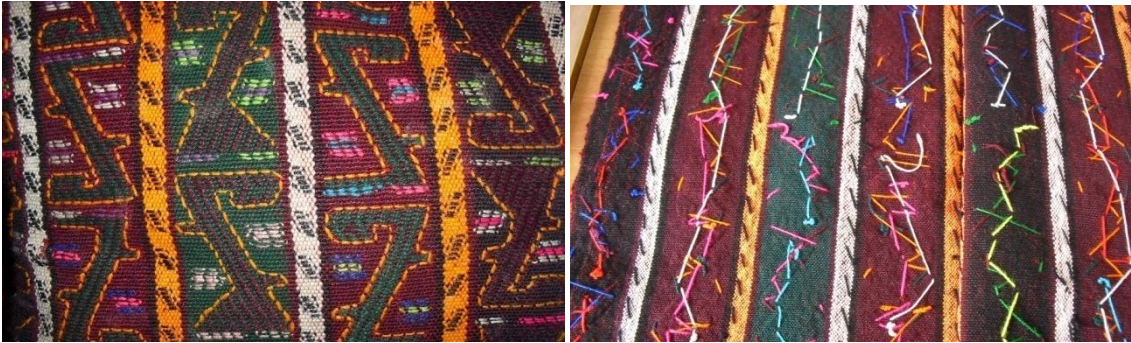
Şekil 8. Kuşağın ön ve arka yüzünden görünüşü

Beli sıkı tutması için kullanılan kuşak, günlük kadın kıyafetinde fistanın, gelin kıyafetinde ise üç eteğin üzerinden bel kısmına dolanır. Kuşak, dikdörtgen olarak dokunan 2 parçanın ortadan dikilerek birleştirilmesiyle 100X100 cm ebadında kare olarak hazırlanır. Üçgen katlanır, sivri ucu ön ortasına gelecek şekilde tekrar katlanarak kalın şerit haline getirilir, bel çevresine dolandıktan sonra, arkada uçlarına dikilen bağcıklarla bele tutturulmaktadır. Kuşakta kullanılan renkler; kırmızı, bordo, turuncu, yeşil, sarı, siyahtır, desenler ise kişinin kendi zevk ve becerisine dayalı olarak değişmektedir. Yöre halkı bundan 20-30 yıl öncesinde evlerinde eğirdikleri ve doğal boya ile boyadıkları yün ipliklerle kendi dokuma tezgahlarında kuşaklarını dokumaktayken zaman içinde yün iplikler yerini orlon ipliklere bırakmış, sonrasında da yörede el dokumacılığı sona erince günümüzde günlük kadın kıyafetinde kuşak artık kullanılmaz olmuştur.