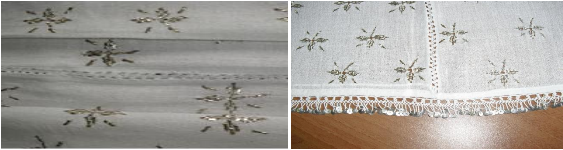
Şekil 12. Telli Pogun ortadan birleştirilmesi ve kenar uçlarının Pul Oyası ile oyalanması

Büyük kasnak üzerine gerilen Şile bezi üzerine özel tel ile ve orijinal iğnesiyle işlenerek hazırlanır. İşlemeye yörede "Bartın işi" denir. Telli poğ 2 parça halinde işlenir ve parçalar ortadan birleştirilerek kare haline getirilir, kenarlarına pul veya boncuk oyası yapılır. Poğ üzerine işlenen motifler, yörede "Pul Oyası", "Eğri Büğrü", "Tek Geçim" ve "Kaz Ayağı" olarak adlandırılır.