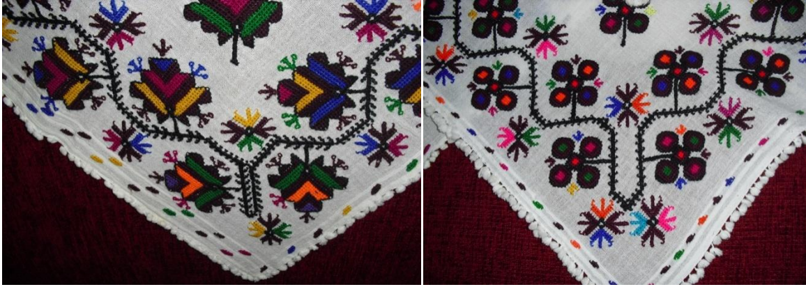
Şekil 2. Nakışlı Poğ- Zengin Nakışı deseni (soldaki resim) ve Kartopu deseni (sağdaki resim)

Yörede kullanılan poğ nakışları; “zengin nakışı”, “kartopu”, “eşek nalı”, “diken gülü” olarak adlandırılır. Nakışlı poğ 110x110 cm ebadında hazırlanır ve kare şeklinde kullanılmaktadır.