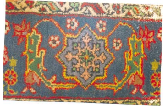
Şekil:4 Geniş bordür çiçek motifi