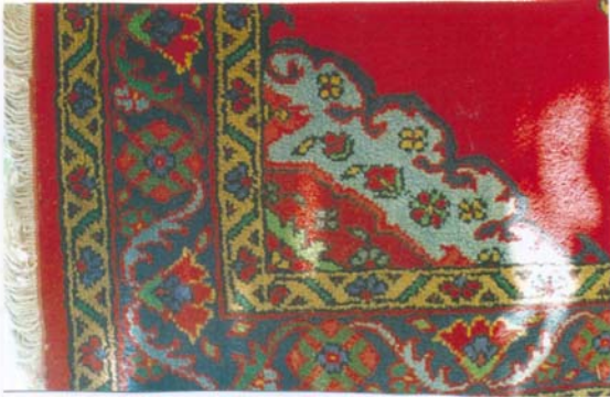
Şekil:3 Köşe madalyon