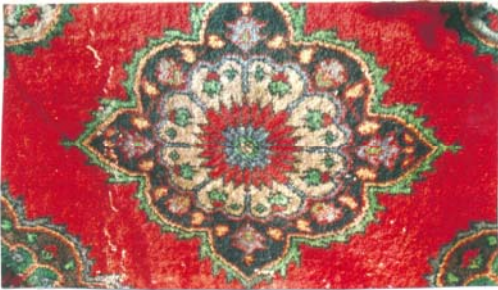
Şekil:5 ‘‘Göbek Tası’’ (İç göbek)