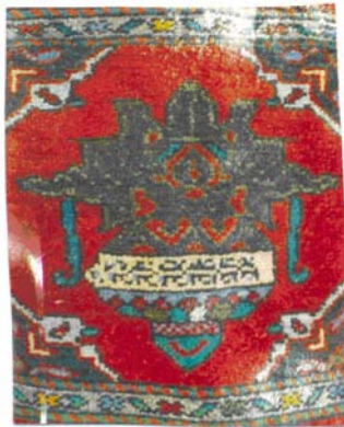
Şekil:7 Kandil motifi