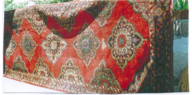
Şekil:2 Beş madalyonlu Sille halısı