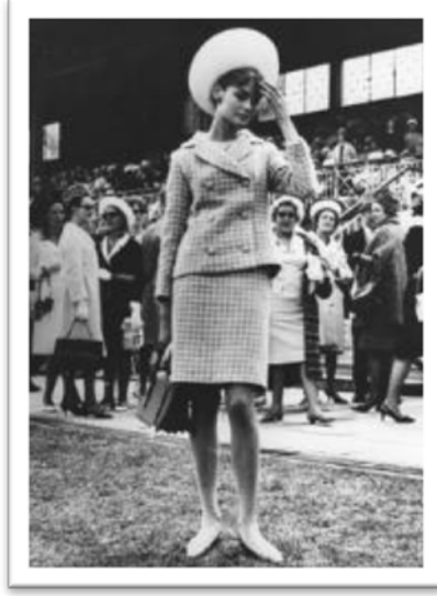
Fotoğraf 1. 1960'ların başında First Lady Jacqueline Kennedy giysi örneği

( http://www.modelinia.com/wordpress/wp-content/uploads/2009/05/gettyimages_2659869.jpg )